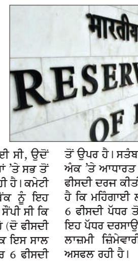
ਮਾਰਕੀਟ ਰਿਜ਼ਰਵ ਆਫ ਇੰਡੀਆ

ਮੁੰਬਈ : ਛੇ ਸਾਲ ਪਹਿਲਾਂ ਮੁਦਰਾ ਨੀਤੀ ਕਮੇਟੀ ਬਣਨ ਤੋਂ ਬਾਅਦ ਪਹਿਲੀ ਵਾਰ ਭਾਰਤੀ ਰਿਜ਼ਰਵ ਬੈਂਕ ਲਗਾਤਾਰ 9 ਮਹੀਨਿਆਂ ਦੌਰਾਨ ਮਹਿੰਗਾਈ ਦਰ ਨੂੰ ਕਾਬੂ 'ਚ ਰੱਖਣ 'ਚ ਅਸਫਲ ਰਿਹਾ 'ਤੇ ਸਰਕਾਰ ਨੂੰ ਰਿਪੋਰਟ ਤਿਆਰ ਕਰਕੇ ਸੌਂਪੇਗੀ। ਕਮੇਟੀ ਦੀ ਸਥਾਪਨਾ 2016 'ਚ ਮੁਦਰਾ ਨੀਤੀ ਬਣਾਉਣ ਲਈ ਯੋਜਨਾਬੰਧ ਵਾਂਗੋ ਕੀਤੀ ਗਈ ਸੀ, ਉਦੋਂ ਕਮੇਟੀ ਨੀਤੀਗਤ ਵਿਆਜ ਦਰਾਂ 'ਤੇ ਸਭ ਤੋਂ ਵੱਧ ਫੋਕਸ ਲੈਣ ਵਾਲੀ ਸੰਸਥਾ ਰਹੀ ਹੈ। ਕਮੇਟੀ ਦੇ ਵਾਰੋਂ ਤਹਿਤ ਸਰਕਾਰ ਨੇ ਬੈਂਕ ਨੂੰ ਇਹ ਯਕੀਨੀ ਬਣਾਉਣ ਦੀ ਜ਼ਿੰਮੇਵਾਰੀ ਸੌਂਪੀ ਸੀ ਕਿ ਮਹਿੰਗਾਈ 4 ਫੀਸਦੀ ਤੋਂ ਵੱਧ ਰਹੇ (ਦੋ ਫੀਸਦੀ ਉੱਤੇ-ਥੱਲੇ ਹੋ ਸਕਦੀ ਹੈ)। ਹਾਲਾਂਕਿ ਇਸ ਸਾਲ ਜਨਵਰੀ ਤੋਂ ਮਹਿੰਗਾਈ ਲਗਾਤਾਰ 6 ਫੀਸਦੀ