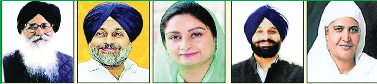
ਪ੍ਰਕਾਸ਼ ਸਿੰਘ ਬਾਦਲ ਸਾਬਕਾ ਮੁੱਖ ਮੰਤਰੀ, ਪੰਜਾਬ | ਸੁਖਬੀਰ ਸਿੰਘ ਬਾਦਲ ਪ੍ਰਧਾਨ ਸ਼੍ਰੋਮਣੀ (ਬ) | ਹਰਸਿਮਰਤ ਕੌਰ ਬਾਦਲ ਸਾਬਕਾ ਕੇਂਦਰੀ ਮੰਤਰੀ | ਬਿਕਰਮ ਸਿੰਘ ਮਜੀਠੀਆ ਸਾਬਕਾ ਕੇਂਦਰੀ ਮੰਤਰੀ, ਪੰਜਾਬ | ਬੀਬੀ ਜਗੀਰ ਕੌਰ ਸਾਬਕਾ ਪ੍ਰਧਾਨ ਸ਼੍ਰੋ. ਗੁ. ਪ੍ਰਬੰਧਕ ਕਮੇਟੀ