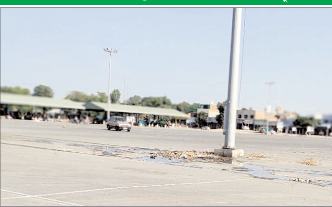
ਮਲੋਟ ਵਿਖੇ ਝੋਨੇ ਦੀ ਖਰੀਦ ਦੇ ਪਹਿਲੇ ਦਿਨ ਸੁੱਨੀ ਪਈ ਦਾਣਾ ਮੰਡੀ ਤੇ ਪਿੱਛ ਵਿਚਕਾਰ ਪਈ ਗੰਦਗੀ।