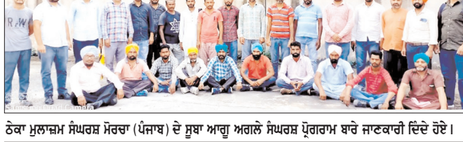
ਠੇਕਾ ਮੁਲਾਜ਼ਮ ਸੰਘਰਸ਼ ਮੋਰਚਾ (ਪੰਜਾਬ) ਦੇ ਸੁਥਾ ਆਗੂ ਅਗਲੇ ਸੰਘਰਸ਼ ਪ੍ਰੋਗਰਾਮ ਬਾਰੇ ਜਾਣਕਾਰੀ ਦਿੰਦੇ ਹੋਏ।

5 ਨੂੰ ਪੰਜਾਬ ਸਰਕਾਰ ਦੇ ਪੁਤਲੇ ਫੂਕਣ ਤੇ 7 ਨੂੰ ਪੂਰੀ ਹਾਈਵੇ ਨੂੰ ਜਾਮ ਕਰਨ ਦਾ ਐਲਾਨ