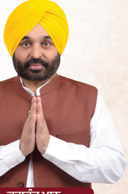
ਭਗਵੰਤ ਮਾਨ ਮੁੱਖ ਮੰਤਰੀ, ਪੰਜਾਬ

ਚੰਡੀਗੜ੍ਹ : 'ਆਪ' ਵਿਧਾਇਕਾ ਬਲਜਿੰਦਰ ਕੌਰ ਖਿਲਾਫ ਗੈਰ-ਜ਼ਮਾਨਤੀ ਵਾਰੰਟ ਜਾਰੀ ਹੋਏ ਹਨ। ਚੰਡੀਗੜ੍ਹ ਜ਼ਿਲ੍ਹਾ ਅਦਾਲਤ ਨੇ ਇਹ ਵਾਰੰਟ ਜਾਰੀ ਕੀਤਾ। ਮਾਮਲਾ 2020 'ਚ ਪੰਜਾਬ 'ਚ ਬਿਜਲੀ ਦਰਾਂ ਨੂੰ ਵਧਾਉਣ ਲਈ ਕੀਤੇ ਜਾ ਰਹੇ ਪ੍ਰਦਰਸ਼ਨ ਨਾਲ ਜੁੜਿਆ ਹੋਇਆ ਹੈ। ਸੈਕਟਰ 43 ਜ਼ਿਲ੍ਹਾ ਅਦਾਲਤ 'ਚ ਕਈ ਵਾਰ ਬੁਲਾਏ ਜਾਣ ਤੋਂ ਬਾਅਦ ਵੀ ਵਿਧਾਇਕਾ ਅਦਾਲਤ 'ਚ ਪੇਸ਼ ਨਹੀਂ ਹੋਏ। ਪੁਲਸ ਨਾਲ ਹੱਥੋਪਾਈ ਦੀ ਇਹ ਘਟਨਾ ਪਿਛਲੀ ਕਾਂਗਰਸ ਸਰਕਾਰ ਵੇਲੇ ਸਾਲ 2020 'ਚ ਵਾਪਰੀ ਸੀ। ਉਸ ਸਮੇਂ ਪੰਜਾਬ ਦੀ ਤਤਕਾਲੀ ਕਾਂਗਰਸ ਸਰਕਾਰ ਨੇ ਬਿਜਲੀ ਦਰਾਂ ਵਿਚ ਵਾਧਾ ਕੀਤਾ ਸੀ। ਇਸ ਦੇ ਵਿਰੋਧ 'ਚ ਆਮ ਆਦਮੀ ਪਾਰਟੀ ਦੇ ਆਗੂਆਂ ਤੇ ਵਰਕਰਾਂ ਨੇ