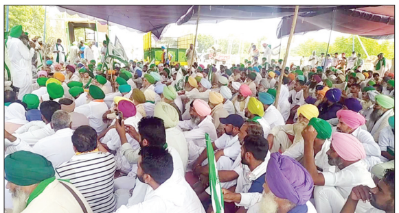
ਮਲੋਟ ਵਿਖੇ ਧਰਨੇ ਦੌਰਾਨ ਸਰਕਾਰ ਵਿਰੁੱਧ ਨਾਅਰੇਬਾਜ਼ੀ ਕਰਦੇ ਹੋਏ ਕਿਸਾਨ।