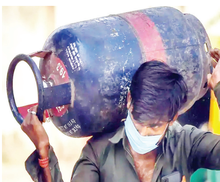
ਕੀਮਤਾਂ 'ਚ ਕੋਈ ਬਦਲਾਅ ਨਹੀਂ ਕੀਤਾ ਗਿਆ, ਜਿਸ ਨਾਲ ਆਮ ਗਾਹਕਾਂ ਨੂੰ ਇਸ ਕਟੌਤੀ ਦਾ ਕੋਈ ਲਾਭ ਨਹੀਂ ਮਿਲੇਗਾ।

ਨਵੀਂ ਦਿੱਲੀ : ਜੈੱਟ ਈਓ (ਏ ਟੀ ਐੱਫ) ਦੀਆਂ ਕੀਮਤਾਂ ਸ਼ਨੀਵਾਰ 4.5 ਵੀਸਦੀ ਤੱਕ ਡਿੱਗ ਗਈਆਂ ਅਤੇ ਹੋਟਲਾਂ ਅਤੇ ਰੈਸਟੋਰੈਂਟਾਂ 'ਚ ਵਰਤੀ ਜਾਣ ਵਾਲੀ ਵਪਾਰਕ ਐੱਲ ਪੀ ਜੀ 19 ਕਿਲੋ ਪ੍ਰਤੀ ਸਿਲੰਡਰ 25.50 ਰੁਪਏ ਤੱਕ ਹੇਠਾਂ ਆ ਗਈ। ਸਰਕਾਰੀ ਨੋਟੀਫਿਕੇਸ਼ਨ ਮੁਤਾਬਕ ਰਾਸ਼ਟਰੀ ਰਾਜਧਾਨੀ 'ਚ 19 ਕਿਲੋ 1,885 ਰੁਪਏ ਦੇ ਵਪਾਰਕ ਐੱਲ ਪੀ ਜੀ ਸਿਲੰਡਰ ਦੀ ਕੀਮਤ 1859.50 ਰੁਪਏ ਹੋ ਗਈ ਹੈ। ਕਮਰਸ਼ੀਅਲ ਐੱਲ ਪੀ ਜੀ ਦੀਆਂ ਕੀਮਤਾਂ ਵਿਚ ਜੂਨ ਤੋਂ ਛੇਵੀਂ ਵਾਰ ਕਟੌਤੀ ਕੀਤੀ ਗਈ ਹੈ, ਪਰ ਘਰੇਲੂ ਰਸੋਈ ਗੈਸ ਦੀਆਂ ਕੀਮਤਾਂ 'ਚ ਕੋਈ ਬਦਲਾਅ ਨਹੀਂ ਕੀਤਾ ਗਿਆ। ਇਸ ਦੇ ਨਾਲ ਹੀ ਏ ਟੀ ਐੱਫ ਦੀ ਕੀਮਤ 'ਚ 4.5 ਵੀਸਦੀ ਦੀ ਕਮੀ ਦਰਜ ਕੀਤੀ ਗਈ। ਮੀਡੀਆ ਰਿਪੋਰਟਾਂ ਅਨੁਸਾਰ ਮਈ ਮਹੀਨੇ 'ਚ ਵਪਾਰਕ ਗੈਸ ਸਿਲੰਡਰ ਦੀ ਕੀਮਤ 2354 ਰੁਪਏ ਹੋ ਗਈ ਸੀ, ਪਰ ਉਸ ਤੋਂ ਬਾਅਦ ਆਇਲ ਮਾਰਕੀਟਿੰਗ ਕੰਪਨੀਆਂ ਲਗਾਤਾਰ ਇਸ ਦੀ ਕੀਮਤਾਂ 'ਚ ਕਟੌਤੀ ਕਰ ਰਹੀਆਂ ਹਨ।