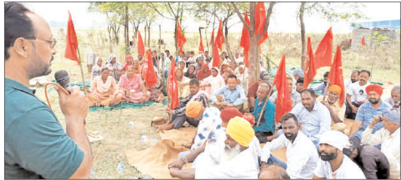
ਕਰਤਾਰਪੁਰ, (ਰਹੱਸ਼ ਏਟੋ) - ਪੁਸ਼ਪਾਸਨ ਅਤੇ ਪੰਚਾਇਤ ਵਲੋਂ ਖਿੱਡ ਬੰਨ੍ਹ ਨੱਗਲ ਵਿਖੇ ਬੇਜ਼ਮੀਨੇ ਦਲਿਤ ਮਜ਼ਦੂਰਾਂ ਦੇ ਕਬਜ਼ੇ ਹੇਠਲੀ ਪੰਚਾਇਤੀ ਜ਼ਮੀਨ ਦਾ ਕਬਜ਼ਾ ਲੈ ਕੇ ਬੇਬੰਦ ਕਰਨ ਦੇ ਵੇਸਲੇ ਦਾ ਪੇਂਡੂ ਮਜ਼ਦੂਰ ਯੂਨੀਅਨ ਪੰਜਾਬ ਵਲੋਂ ਕੀਤੇ ਜਾਣ ਵਾਲੇ ਵਿਰੋਧ ਦੇ ਕਾਰਨ ਕੋਈ ਵੀ ਅਧਿਕਾਰੀ ਪਲਾਟ ਵਾਲੀ ਜ਼ਮੀਨ ਵਿੱਚ ਨਹੀਂ ਬਹੁੜਿਆ। ਯੂਨੀਅਨ ਦੀ ਅਗਵਾਈ ਹੇਠ ਪੇਂਡੂ ਮਜ਼ਦੂਰ ਮੋਰਚਾ ਕਰਨ ਦੇ ਬੈਠੇ ਹੋਏ। ਇਸ ਮੌਕੇ ਯੂਨੀਅਨ ਵਲੋਂ ਸ਼ੋਧਕ ਸ਼ਾਹੀ ਰੰਚ ਵਲੋਂ ਦਾ ਐਲਾਨ ਕੀਤਾ ਗਿਆ। ਇਸ ਮੌਕੇ ਆਗੂਆਂ ਨੇ ਕਿਹਾ ਕਿ ਪੇਂਡੂ ਮਜ਼ਦੂਰਾਂ ਵਲੋਂ ਬੜੀ ਜੱਦੋਜਹਿਦ ਕਰਕੇ ਪਹਿਲੀ ਪੰਚਾਇਤ ਪਾਸੋਂ ਗ੍ਰਾਮ ਸਭਾ

ਅਜਲਾਸ ਕਰਵਾ ਕੇ ਬੇਬੰਦ ਅਤੇ ਬੇਜ਼ਮੀਨੇ ਕਿਰਤੀਆਂ ਨੂੰ 5-5 ਮਰਲੇ ਦੇ ਰਿਹਾਇਸ਼ੀ ਪਲਾਟ ਦੇਣ ਦਾ ਮਤਾ ਪਾਸ ਕਰਵਾਇਆ ਸੀ। ਪੇਂਡੂ ਧਨਾਚਾਂ, ਸਿਆਸਤਦਾਨਾਂ ਅਤੇ ਅਫਸਰਸ਼ਾਹੀ ਨੇ ਗੱਠਜੋੜ ਬਣਾ ਕੇ ਮਤੇ ਅਨੁਸਾਰ ਪਲਾਟਾਂ ਦੀ ਅਲਾਟਮੈਂਟ ਨਹੀਂ ਹੋਣ ਦਿੱਤੀ। ਮਜ਼ਦੂਰਾਂ ਨੇ ਪੰਚਾਇਤੀ ਜ਼ਮੀਨ ਵਿੱਚ ਭੇਡੇ ਲਗਾ ਲਏ ਅਤੇ ਕੁੱਝ ਸਮਾਂ ਪਲਾਟਾਂ ਦੀ ਅਲਾਟਮੈਂਟ ਲਈ ਉਕੀੜ ਕਰਨ ਉਪਰੰਤ ਜਦੋਂ ਪੁਸ਼ਪਾਸਨ ਦੇ ਕੰਨਾਂ ਉੱਤੇ ਜੂਠਾ ਨਾ ਸਰਕੀ ਤਾਂ ਅੱਠ ਮਜ਼ਦੂਰਾਂ ਨੇ ਮੱਥੇ ਮਕਾਨ ਉਸਾਰ ਕੇ ਪੰਚਾਇਤੀ ਜ਼ਮੀਨ ਵਿੱਚ ਖਰਾ ਬਣਾ ਕੇ ਰਿਹਾਇਸ਼ ਕਰ ਲਈ। ਪਿੱਛੋਂ ਦੀ ਜ਼ਮੀਨ ਪੰਚਾਇਤ ਨੇ ਪਲਾਟ ਅਲਾਟ ਕਰਨ