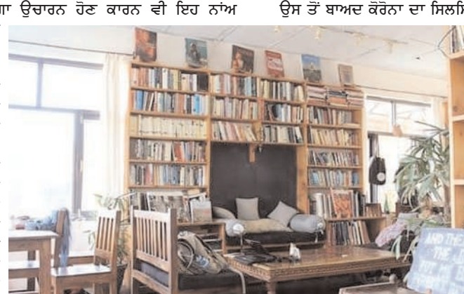
ਇਲਿਤਰਾਤੀ ਦੇ ਅੰਦਰ ਦਾ ਦ੍ਰਿਸ਼