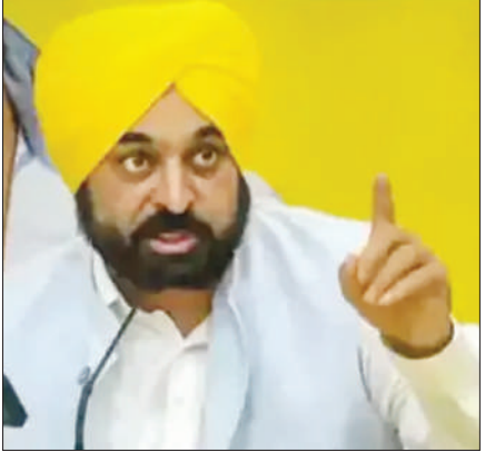
ਲਾਇਸੈਂਸ ਕਿਸੇ ਗਲਤ ਵਿਅਕਤੀ ਨੂੰ ਜਾਰੀ ਹੋਇਆ ਹੈ ਤਾਂ ਉਸ ਨੂੰ ਤੁਰੰਤ ਰੱਦ ਕੀਤਾ ਜਾਵੇ। ਆਉਣ ਵਾਲੇ ਦਿਨਾਂ ‘ਚ ਵੱਖ-ਵੱਖ ਥਾਵਾਂ ‘ਤੇ ਅਚਨਚੇਤ ਚੈਕਿੰਗ ਕੀਤੀ ਜਾਵੇ।

ਚੰਡੀਗੜ੍ਹ (ਗੁਰਜੀਤ ਬਿੱਲਾ) ਪੰਜਾਬ ‘ਚ ਕਾਨੂੰਨ-ਕਾਨੂੰਨ ਦੇ ਮਾਮਲੇ ‘ਤੇ ਘਰੀ ਸਰਕਾਰ ਨੇ ਬੰਦੂਕ ਕਲਚਰ ਅਤੇ ਹਿੰਸਾ ਨੂੰ ਉਤਸ਼ਾਹਿਤ ਕਰਨ ਵਾਲੇ ਗੀਤਾਂ ਅਤੇ ਹਥਿਆਰਾਂ ਦਾ ਵਿਖਾਵਾ ਕਰਨ ‘ਤੇ ਪਾਬੰਦੀ ਲਾਉਣ ਦਾ ਫੈਸਲਾ ਕੀਤਾ ਹੈ। ਇਸ ਕਰਕਾਰ ਨੇ ਇਸ ਦੇ ਨਾਲ ਅਗਲੇ ਤਿੰਨ ਮਹੀਨਿਆਂ ‘ਚ ਹਥਿਆਰਾਂ ਦੇ ਲਾਇਸੈਂਸਾਂ ਦੀ ਸਮੀਖਿਆ ਕਰਨ ਦੇ ਵੀ ਹੁਕਮ ਦਿੱਤੇ ਹਨ। ਹੁਕਮਾਂ ‘ਚ ਕਿਹਾ ਗਿਆ ਹੈ ਕਿ ਕਿਸੇ ਵੀ ਭਾਈਚਾਰੇ ਵਿੱਚੋਂ ਨਵਰਤ ਫੈਲਾਉਣ ਵਾਲੇ ਭਾਸ਼ਣ ਦੇਣ ਵਾਲਿਆਂ ਵਿਰੁੱਧ ਆਈ ਆਰ ਦਰਜ ਕੀਤੀ ਜਾਵੇ। ਹਥਿਆਰਾਂ ਅਤੇ ਹਿੰਸਾ ਦੀ ਵੱਡੀਆਈ ਕਰਨ ਵਾਲੇ ਗੀਤਾਂ ‘ਤੇ ਪੂਰੀ ਤਰ੍ਹਾਂ ਪਾਬੰਦੀ ਲਗਾਈ ਗਈ ਹੈ। ਸੋਸ਼ਲ ਮੀਡੀਆ ਸਮੇਤ ਹਥਿਆਰਾਂ ਦੀ ਜਨਤਕ ਪ੍ਰਦਰਸ਼ਨੀ ‘ਤੇ ਪੂਰੀ ਤਰ੍ਹਾਂ ਪਾਬੰਦੀ ਹੈ। ਜਨਤਕ ਇਕੱਠਾਂ, ਧਾਰਮਕ ਸਥਾਨਾਂ, ਵਿਆਹ ਸਮਾਗਮਾਂ ਅਤੇ ਹੋਰ ਸਮਾਗਮਾਂ ‘ਚ ਹਥਿਆਰ ਲੈ ਕੇ ਜਾਣ ਅਤੇ ਵਿਖਾਉਣ ‘ਤੇ ਮੁਕੱਲਮ ਪਾਬੰਦੀ ਹੈ। ਅਸਲਾ ਲਾਇਸੈਂਸਾਂ ਦੀ ਤਿੰਨ ਮਹੀਨਿਆਂ ਦੇ ਅੰਦਰ ਅੰਦਰ ਸਮੀਖਿਆ ਹੋਣੀ ਚਾਹੀਦੀ ਹੈ ਅਤੇ ਜੇ ਕੋਈ ਅਸਲਾ