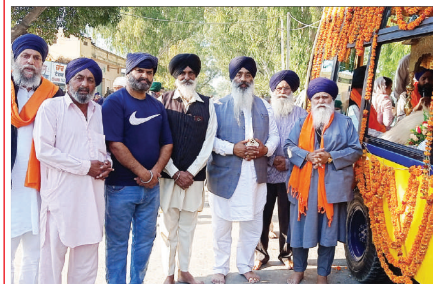
ਪੰਨ-ਪੰਨ ਸਾਹਿਬ ਸ੍ਰੀ ਗੁਰੂ ਨਾਨਕ ਦੇਵ ਜੀ ਦੇ ਪ੍ਰਕਾਸ਼ ਪੁਰਬ ਨੂੰ ਸਮਰਪਤ ਪਿੰਡ ਕੋਟਲੀ ਅਰਾਈਆਂ ਤੋਂ ਸਜਾਏ ਗਏ ਨਗਰ ਕੀਰਤਨ ਦਾ ਗੁਰਦੁਆਰਾ ਸ਼ਹੀਦ ਗੰਜ ਸਾਹਿਬ ਸੁਲਾਲਾ ਪਹੁੰਚਣ 'ਤੇ ਸਵਾਗਤ ਕਰਦੇ ਪ੍ਰਬੰਧਕ ਤੇ ਨਗਰ ਨਿਵਾਸੀ।