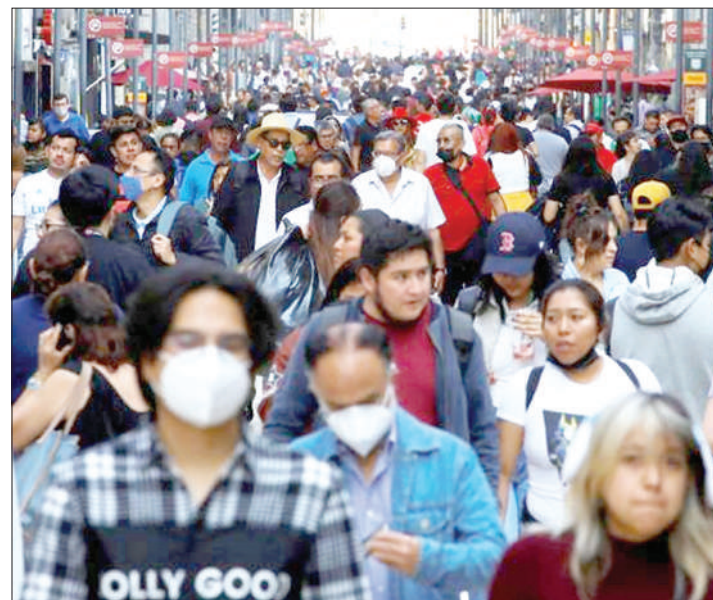
ਸੰਯੁਕਤ ਰਾਸ਼ਟਰ : ਪਿਛਲੇ 12 ਸਾਲਾਂ 'ਚ

ਇੱਕ ਅਰਬ ਦੇ ਵਾਧੇ ਤੋਂ ਬਾਅਦ ਮੰਗਲਵਾਰ ਵਿਸ਼ਵ ਦੀ ਆਬਾਦੀ 8 ਅਰਬ ਤੱਕ ਪਹੁੰਚ ਗਈ। ਇਸ ਦੇ ਨਾਲ ਹੀ ਭਾਰਤ ਅਗਲੇ ਸਾਲ ਦੁਨੀਆ ਦੇ ਸਭ ਤੋਂ ਵੱਧ ਆਬਾਦੀ ਵਾਲੇ ਦੇਸ਼ ਵਜੋਂ ਚੀਨ ਨੂੰ ਪਛਾੜਨ ਦੇ ਕੋਚੇ ਹੈ। ਸੰਯੁਕਤ ਰਾਸ਼ਟਰ ਨੇ ਕਿਹਾ ਕਿ ਵਿਸ਼ਵਵਿਆਪੀ ਅੰਕੜਾ ਜਨਤਕ ਸਿਹਤ 'ਚ ਵੱਡੇ ਸੁਧਾਰਾਂ ਨੂੰ ਦਰਸਾਉਂਦਾ ਹੈ, ਜਿਸ ਨਾਲ ਮੌਤ ਦੇ ਜੋਖਮ ਨੂੰ ਘਟਾਇਆ ਗਿਆ ਹੈ ਅਤੇ ਜੀਵਨ ਦੀ ਸੰਭਾਵਨਾ ਵਧੀ ਹੈ। ਸੰਯੁਕਤ ਰਾਸ਼ਟਰ ਆਬਾਦੀ ਫੰਡ ਨੇ ਟਵੀਟ ਕੀਤਾ—ਅੱਠ ਅਰਬ ਉਮੀਦਾਂ। ਅੱਠ ਅਰਬ ਸੁਪਨੇ। ਅੱਠ ਅਰਬ