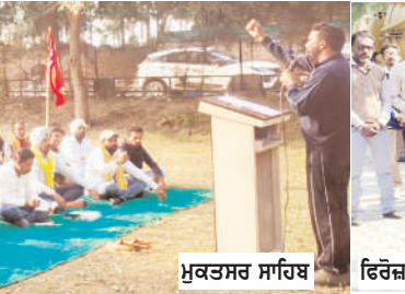
ਮੁਕਤਸਰ ਸਾਹਿਬ ਵਿਖੇ ਪਰਨਾ

ਮੁਲਾਜ਼ਮ ਸੰਘਰਸ਼ ਮੋਰਚਾ ਦੇ ਬੇਨਤ ਹੇਠ ਸੰਘਰਸ਼ ਚੱਲ ਰਿਹਾ ਹੈ ਤੇ ਮੁੱਖ ਮੰਤਰੀ ਪੰਜਾਬ ਸਰਕਾਰ ਕੋਲੋਂ ਮਹਾਂ- ਮਸਲਿਆਂ ਦਾ ਹੱਲ ਕਰਨ ਲਈ ਮੀਟਿੰਗ ਦੀ ਮੰਗ ਕੀਤੀ ਜਾ ਰਹੀ ਹੈ, ਪਰ ਪਿਛਲੇ 4-5 ਮਹੀਨਿਆਂ ਤੋਂ ਮੁੱਖ ਮੰਤਰੀ ਪੰਜਾਬ ਮੀਟਿੰਗ ਕਰਨ ਤੋਂ ਬੱਸ ਰਹੇ ਹਨ, ਜਿਸ ਦੇ ਕਾਰਨ ਪੰਜਾਬ ਸਰਕਾਰ ਵੱਲੋਂ ਪੈਦਾ ਕੀਤੀ ਗਈ ਮਜਬੂਰੀ ਕਾਰਨ ਹੀ ਠੇਕਾ ਮੁਲਾਜ਼ਮਾਂ ਵੱਲੋਂ ਸਮੂਹਿਕ ਛੁੱਟੀ 'ਤੇ ਜਾ ਕੇ ਸੰਘਰਸ਼ ਕਰਨ ਦਾ ਫੈਸਲਾ ਕੀਤਾ ਗਿਆ ਹੈ। ਉਨ੍ਹਾਂ ਮੰਗ ਕੀਤੀ ਕਿ ਸਰਕਾਰੀ ਵਿਭਾਗਾਂ 'ਚ ਕੰਮ ਕਰਦੇ ਆਊਟਸੋਰਸ/ਇਨਲਿਸਟਮੈਂਟ ਮੁਲਾਜ਼ਮਾਂ ਨੂੰ ਨਜ਼ਰਅੰਦਾਜ਼ ਕਰਕੇ ਬਾਹਰੋਂ ਪੱਕੀ ਭਰਤੀ ਕਰਨ ਦੇ ਫੈਸਲੇ ਨੂੰ ਰੋਕ ਕਰਕੇ ਆਊਟਸੋਰਸ ਤੇ ਇਨਲਿਸਟਮੈਂਟ ਮੁਲਾਜ਼ਮਾਂ ਨੂੰ ਪਹਿਲ ਦੇ ਆਪ 'ਤੇ ਰੋਗੂਕਰ ਕੀਤਾ ਜਾਵੇ। ਇਨਲਿਸਟਮੈਂਟ/ਆਊਟਸੋਰਸ ਮੁਲਾਜ਼ਮਾਂ ਨੂੰ ਸਬੰਧਤ ਕਰਦਿਆਂ ਕਿਹਾ ਕਿ ਠੇਕਾ ਮੁਲਾਜ਼ਮਾਂ ਦੀਆਂ ਮੰਗਾਂ ਨੂੰ ਤੁਰੰਤ ਮਨਦੇ ਹੋਏ ਲਾਗੂ ਕੀਤਾ ਜਾਵੇ। ਇਸ ਮੌਕੇ ਭਾਰੀ ਗਿਣਤੀ 'ਚ ਠੇਕਾ ਮੁਲਾਜ਼ਮ ਹਾਜ਼ਰ ਸਨ।