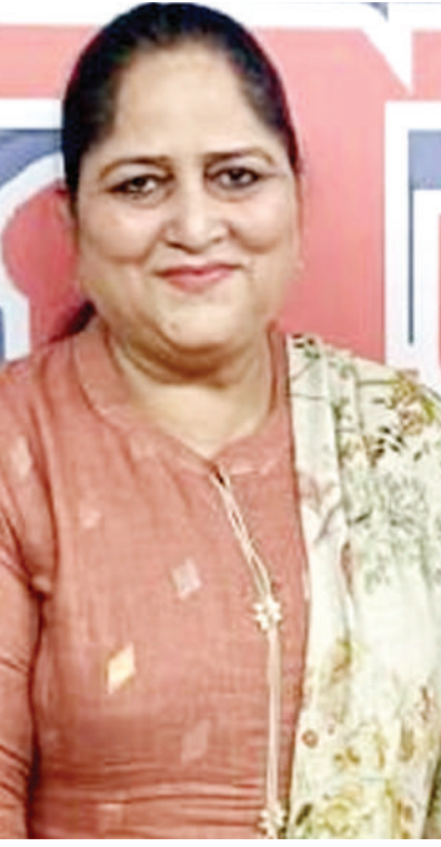
ਰਚਨਾਵਾਂ ਰਾਹੀਂ ਸਮਾਜ ਦੇ ਯਥਾਰਥ ਨੂੰ ਸਾਹਮਣੇ ਲਿਆਉਣ ਦਾ ਯਤਨ ਕੀਤਾ ਹੈ। ਸਾਹਿਤ ਆਪਣੇ ਅਸਤਿਤਵ ਸਮਾਜ ਉੱਤੇ ਨਿਰਭਰ ਕਰਦਾ ਹੈ। ਇੱਕ ਚੇਤਨ ਪਾਠੀ ਦੇ ਰੂਪ ਵਿਚ ਸਾਹਿਤਕਾਰ ਆਪਣੀ ਕਿਰਤ ਲਈ ਰਚਨਾਤਮਿਕ ਵਸਤੂ ਦਾ ਆਧਾਰ ਸਮਾਜ ਵਿੱਚੋਂ ਹੀ ਚੁਣਦਾ ਹੈ। ਸਾਹਿਤ ਮਨੁੱਖ ਦੇ ਜੀਵਨ ਦੇ ਵਰਤਾਰਿਆਂ ਦੀ ਪੇਸ਼ਕਾਰੀ ਕਰਦਾ ਹੈ। ਇਸ ਤਰ੍ਹਾਂ ਆਖ ਸਕਦੇ ਹਾਂ ਕਿ ਸਮਾਜ ਅਤੇ ਸਾਹਿਤ ਦਾ ਆਪਸੀ ਗੂੜ੍ਹਾ ਗਿੱਧਾ ਹੈ।

ਆਪਣੇ ਆਲੇ-ਦੁਆਲੇ ਵਾਪਰ ਰਹੇ ਵਰਤਾਰਿਆਂ ਨੂੰ ਜਦੋਂ ਆਪਣੀ ਅੰਤਰ ਦ੍ਰਿਸ਼ਟੀ ਨਾਲ ਸਮਝਣ ਦੀ ਚੇਤਨਾ ਕਰਦਾ ਹੈ ਤਾਂ ਉਸ ਦੀ ਚੇਤਨਾ ਸਾਹਿਤ ਹੁੰਦੀ ਹੈ ਤੇ ਉਹ ਕਿਸੇ ਨਾ ਕਿਸੇ ਵਿਚਾਰਧਾਰਾ ਦੇ ਅਧੀਨ ਹੀ ਸਿਰਜਣਾ ਕਰਦਾ ਹੈ। ਹਰੇਕ ਸਾਹਿਤਕਾਰ ਦਾ ਬੀਤ ਚੁੱਕੇ ਨਾਲ ਅਤੇ ਸਮਕਾਲੀ ਪ੍ਰਸਥਿਤੀਆਂ ਨਾਲ ਡੂੰਘਾ ਸੰਬੰਧ ਹੁੰਦਾ ਹੈ। ਉਹ ਆਪਣੀ ਵਿਚਾਰਧਾਰਕ ਦ੍ਰਿਸ਼ਟੀ ਰਾਹੀਂ ਹੀ ਆਮ ਲੋਕਾਂ ਨੂੰ ਸਾਧਾਰਨ ਲੱਗਦੀ ਗੱਲ ਵਿੱਚੋਂ ਆਸਾਧਾਰਨ ਲੱਭਣ ਦਾ ਯਤਨ ਕਰਦਾ ਹੈ। ਉਹ ਉਸ ਵਿੱਚੋਂ ਕੀ ਲੱਭਦਾ ਹੈ, ਇਹੀ ਉਸ ਦੀ ਵਿਚਾਰਧਾਰਾ ਹੁੰਦੀ ਹੈ। ਸਾਹਿਤਕਾਰ ਜਿੰਨਾ ਵਿਚਾਰਧਾਰਾ ਤੋਂ ਖੁਦ ਪ੍ਰਭਾਵਿਤ ਹੁੰਦਾ ਹੈ, ਉਹੀ ਉਸ ਦੀ ਰਚਨਾ ਵਿਚ ਉਜਾਗਰ ਹੁੰਦੀ ਹੈ।