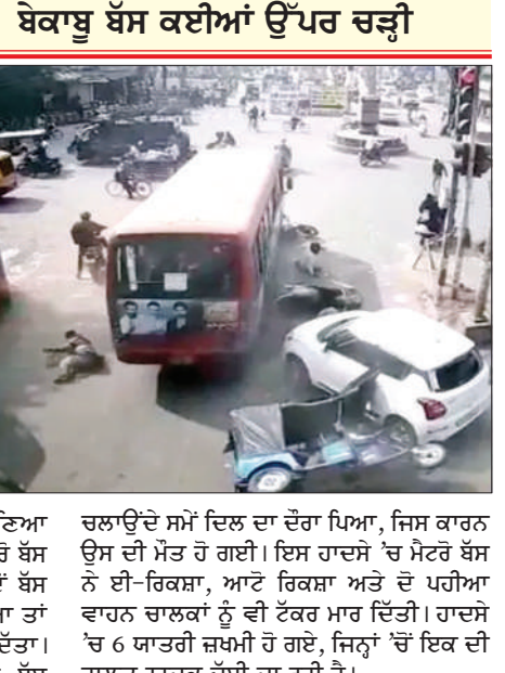
ਚਲਾਉਂਦੇ ਸਮੇਂ ਦਿਲ ਦਾ ਦੌਰਾ ਪਿਆ, ਜਿਸ ਕਾਰਨ ਉਸ ਦੀ ਮੌਤ ਹੋ ਗਈ। ਇਸ ਹਾਦਸੇ 'ਚ ਮੈਟਰੋ ਬੱਸ ਨੇ ਈ-ਰਿਕਸ਼ਾ, ਆਟੋ ਰਿਕਸ਼ਾ ਅਤੇ ਦੋ ਪਹੀਆ ਵਾਹਨ ਚਲਾ ਕੇ ਡਾਕਟਰਾਂ ਨੂੰ ਵੀ ਟੱਕਰ ਮਾਰ ਦਿੱਤੀ। ਹਾਦਸੇ 'ਚ 6 ਯਾਤਰੀ ਜ਼ਖ਼ਮੀ ਹੋ ਗਏ, ਜਿਨ੍ਹਾਂ 'ਚੋਂ ਇੱਕ ਦੀ ਹਾਲਤ ਨਾਜ਼ੁਕ ਦੱਸੀ ਜਾ ਰਹੀ ਹੈ।