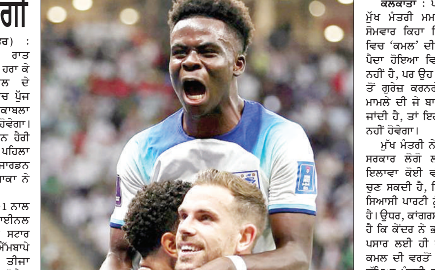
ਹੋਰਡਸਨ ਆਪਣਾ ਪਹਿਲਾ ਗੋਲ ਕਰਨ ਤੋਂ ਬਾਅਦ ਸਾਥੀਆਂ ਨਾਲ ਖੁਸ਼ੀ ਮਨਾਉਣਾ ਹੋਇਆ।

ਅਲ ਬੋਰ (ਕਤਰ) : ਇੰਗਲੈਂਡ ਐਂਟਵਾਰ ਰਾਤ ਸੋਨੇਗਲ ਨੂੰ 3-0 ਨਾਲ ਹਰਾ ਕੇ ਵਿਸ਼ਵ ਕੱਪ ਫੁੱਟਬਾਲ ਦੇ ਕੁਆਰਟਰਫਾਈਨਲ ਵਿਚ ਪੁੱਜ ਗਿਆ, ਜਿੱਥੇ ਉਸ ਦਾ ਮੁਕਾਬਲਾ ਚੈਂਪੀਅਨ ਫਰਾਂਸ ਨਾਲ ਹੋਵੇਗਾ। ਇੰਗਲੈਂਡ ਵੱਲੋਂ ਕਪਤਾਨ ਹੋਰੀ ਕੋਨ ਨੇ ਟੂਰਨਾਮੈਂਟ ਦਾ ਪਹਿਲਾ ਗੋਲ ਕੀਤਾ। ਦੂਜੇ ਗੋਲ ਜਾਰਡਨ ਹੋਰਡਸਨ ਤੇ ਬੁਕਾਰੋ ਸਾਕਾ ਨੇ ਕੀਤੇ। ਫਰਾਂਸ ਪੌਲੋਡ ਨੂੰ 3-1 ਨਾਲ ਹਰਾ ਕੇ ਕੁਆਰਟਰਫਾਈਨਲ ਵਿਚ ਪੁੱਜਾ। ਦੋ ਗੋਲ ਸਟਾਰ ਖਿਡਾਰੀ ਕੀਲੀਆਨ ਐਂਮਬਾਪੇ ਨੇ ਕੀਤੇ, ਜਦਕਿ ਤੀਜਾ ਉਲੀਵਰ ਗਿਰੇਡ ਨੇ। ਪੌਲੋਡ ਵੱਲੋਂ ਇੱਕੋ-ਇੱਕ ਗੋਲ ਰਾਬਰਟ ਲੈਵੇਡੋਵਸਕੀ ਨੇ ਕੀਤਾ।