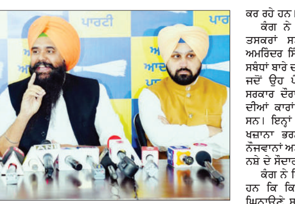
ਪਿੱਠ ਬਾਧੜਨ ਵਾਲੇ, ਨਸ਼ਾ ਤਸਕਰਾਂ, ਗੈਰਸਟਰਾਂ ਅਤੇ ਮਾਰੀਆ ਨੂੰ ਰਾਜਨੀਤਕ ਪੁਸ਼ਤਪਨਾਹੀ ਦੇਣ ਵਾਲੇ ਅੱਜ ਪੰਜਾਬ ਦੇ ਉਸ ਮੁੱਖ ਮੰਤਰੀ ਦੇ ਬਿਅਨ 'ਤੇ ਸਵਾਲ ਉਠ ਰਹੇ ਹਨ, ਜੋ ਦਿਨ-ਰਾਤ ਸੁੱਚੇ 'ਚ ਨਸ਼ਾ ਅਤੇ ਸੰਗਠਿਤ ਅਪਰਾਧ ਨੂੰ ਖਤਮ ਕਰਨ ਲਈ ਕੰਮ ਕਰ ਰਹੇ ਹਨ।