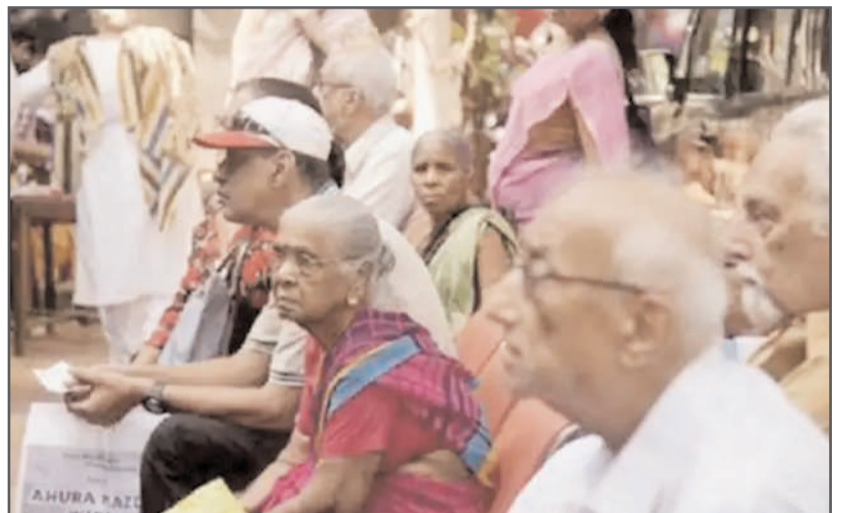
ਸੰਘਰਸ਼ ਪੂਰੇ ਜ਼ੋਰ ਨਾਲ ਚੱਲ ਰਿਹਾ ਹੈ। ਕਰਮਚਾਰੀਆਂ ਦੇ ਵਧਦੇ ਨਵੀਂ ਪੈਨਸ਼ਨ ਸਕੀਮ ਵਿਰੁੱਧ ਵਧਦੇ ਵਿਰੋਧ ਨੂੰ ਸ਼ਾਂਤ ਕਰਨ ਲਈ ਰਾਜ ਸਕੀਮ ਅੱਜ ਤੱਕ ਲਾਗੂ ਹੀ ਨਹੀਂ ਕੀਤੀ ਜਾ ਸਕੀ, ਜਦਕਿ ਤਾਮਿਲਨਾਡੂ, ਕੇਰਲਾ, ਮੇਘਾਲਿਆ 'ਚ ਕਮਿਊਨਿਸਟ ਸਰਕਾਰਾਂ ਦੇ ਜਾਣ ਬਾਅਦ