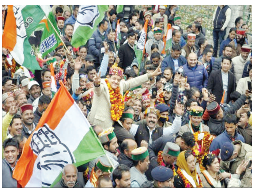
ਗੁਜਰਾਤ 'ਚ ਭਾਜਪਾ ਅਤੇ ਹਿਮਾਚਲ 'ਚ ਕਾਂਗਰਸ ਦੇ ਹਮਾਇਤੀ ਜਨਮ ਮਨਾਉਂਦੇ ਹੋਏ।

ਨਵੀਂ ਦਿੱਲੀ : ਭਾਜਪਾ ਨੇ ਗੁਜਰਾਤ ਅੰਸ਼ਬਲੀ ਚੋਣਾਂ ਵਿੱਚ 182 ਵਿੱਚੋਂ 156 ਸੀਟਾਂ ਜਿੱਤ ਕੇ ਰਿਕਾਰਡ ਬਣਾ ਦਿੱਤਾ, ਪਰ ਹਿਮਾਚਲ ਵਿੱਚ ਸੱਤਾ ਗੁਆ ਬੈਠੀ। ਕਾਂਗਰਸ ਨੇ ਮਾਧਵ ਸਿੰਘ ਸੋਲੰਕੀ ਦੀ ਅਗਵਾਈ ਵਿੱਚ ਗੁਜਰਾਤ 'ਚ 149 ਸੀਟਾਂ ਜਿੱਤੀਆਂ ਸਨ। ਪ੍ਰਧਾਨ ਮੰਤਰੀ ਨਰਿੰਦਰ ਮੋਦੀ ਨੇ ਮੁੱਖ ਮੰਤਰੀ ਹੁੰਦਿਆਂ ਭਾਜਪਾ ਨੂੰ 2002 ਵਿੱਚ 127 ਸੀਟਾਂ ਜਿੱਤੀਆਂ ਸਨ। ਕਾਂਗਰਸ ਨੇ ਪਿਛਲੀ ਵਾਰ 77 ਸੀਟਾਂ ਜਿੱਤੀਆਂ ਸਨ, ਪਰ ਐਤਕੀ 17 ਹੀ ਜਿੱਤ ਸਕੀ। ਆਮ ਆਦਮੀ ਪਾਰਟੀ 5