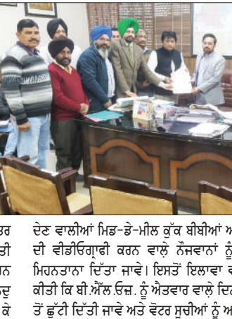
ਚੋਣ ਵਾਲੀਆਂ ਮਿਡ-ਡੇ-ਮੀਲ ਕੁੱਝ ਬੀਬੀਆਂ ਅਤੇ ਚੋਣ ਸੂਬਾ ਦੀ ਵੀਡੀਓਗ੍ਰਾਫੀ ਕਰਨ ਵਾਲੇ ਨੌਜਵਾਨਾਂ ਨੂੰ ਵੀ ਬਣਦਾ ਮਿਹਨਤਾਨਾ ਦਿੱਤਾ ਜਾਵੇ। ਇਸ ਤੋਂ ਇਲਾਵਾ ਵਕਫ ਨੇ ਮੰਗ ਕੀਤੀ ਕਿ ਬੀ ਐੱਲ ਓ. ਨੂੰ ਅੰਤਵਾਲ ਵਾਲੇ ਨੌਜਵਾਨਾਂ ਨੂੰ ਡਿਊਟੀ ਦਿੱਤਾ ਜਾਵੇ, ਚੋਣ-ਬੁਝਾ ਉੱਤੇ ਚੋਣ-ਅਮਲੇ ਨੂੰ ਖਾਣਾ ਬਣਾ ਕੇ