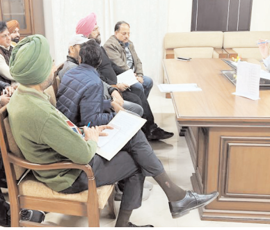
ਨਹੀਂ ਕਿਹਾ ਜਾਵੇਗਾ ਪਰ ਜਿਨ੍ਹਾਂ ਨੇ ਉਸ ਦਿਨ ਤੱਕ ਵੀ ਕਬਜ਼ੇ ਨਾ ਹਟਾਏ, ਉਨ੍ਹਾਂ ਖਿਲਾਫ਼ ਨਿਯਮ ਮੁਤਾਬਕ ਸਖ਼ਤ ਕਾਰਵਾਈ ਅਮਲ ਵਿੱਚ ਲਿਆਂਦੀ ਜਾਵੇਗੀ। ਆਪਣੇ ਦਫ਼ਤਰ 'ਚ ਬੰਗਾ ਸ਼ਹਿਰ ਦੇ ਨਜ਼ਾਇਜ਼ ਕਬਜ਼ਿਆਂ, ਨੈਸ਼ਨਲ ਹਾਈਵੇਅ ਦੇ ਕੰਮਾਂ ਦੇ ਨਿਪਟਾਰੇ ਅਤੇ ਸ਼ਹਿਰ ਦੀ ਪਾਰਕਿੰਗ ਸਥੇਰੀ ਮਾਮਲਿਆਂ 'ਤੇ ਮੀਟਿੰਗ ਦੌਰਾਨ ਉਨ੍ਹਾਂ ਨੇ ਅਧਿਕਾਰੀਆਂ ਨੂੰ ਸ਼ਹਿਰ 'ਚ ਪੱਕੇ ਤੋਂ ਆਰਜ਼ੀ ਨਜ਼ਾਇਜ਼ ਕਬਜ਼ਿਆਂ ਨੂੰ ਹਟਾਉਣ ਲਈ ਹਦਾਇਤ