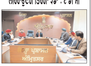
ਗੁਰੂ ਨਾਨਕ ਸਟੇਡੀਅਮ 'ਚ ਵਿੱਤ ਮੰਤਰੀ ਦੀਆਂ ਲਹਿਰਾਉਣਗੇ ਤਿੰਨਰਾ ਝੰਡਾ : ਏ ਡੀ ਸੀ