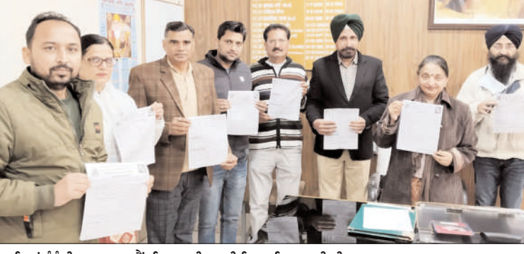
ਨਸ਼ਿਆਂ ਸੰਬੰਧੀ ਜਾਗਰੂਕਤਾ ਪੈਂਫਲਿਟ ਜਾਰੀ ਕਰਦੀ ਸਿਹਤ ਵਿਭਾਗ ਦੀ ਟੀਮ।