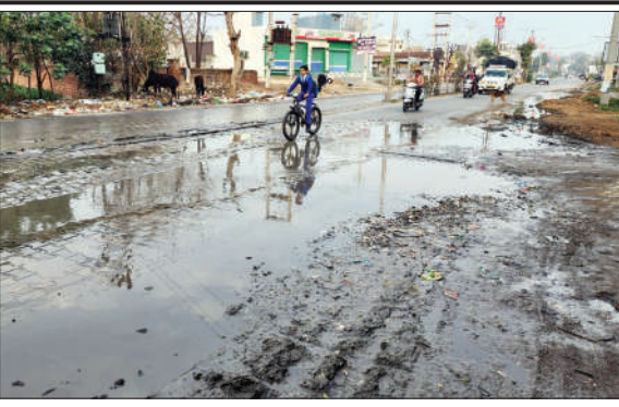
ਸਮਰਾਲਾ-ਖੰਨਾ ਰੋਡ 'ਤੇ ਸੀਵਰੇਜ ਦੇ ਖੜੇ ਗੰਦੇ ਪਾਣੀ ਦੀਆਂ ਤਸਵੀਰਾਂ।