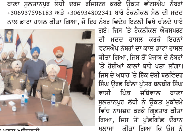
ਜਾਣਕਾਰੀ ਦਿੰਦੇ ਹੋਏ ਪੁਲਸ ਅਧਿਕਾਰੀ