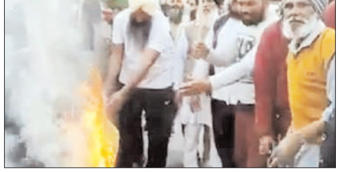
ਪੁਤਲਾ ਸਾੜਦੇ ਹੋਏ ਗੰਨਾ ਕਾਸ਼ਤਕਾਰ।