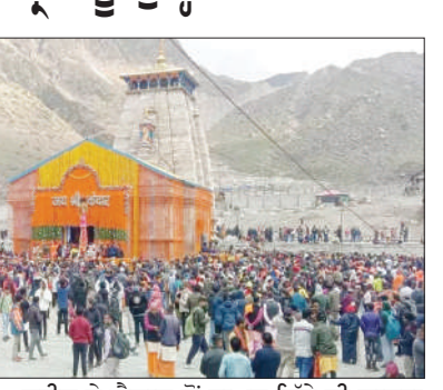
ਰੁਦਰਪ੍ਰਯਾਗ : ਸ਼ਿਵਰਾਤਰੀ ਦੇ ਮੌਕੇ 'ਤੇ ਵੇਦਪਾਠ, ਹੰਕ-ਹਕੂਕਪਾਰੀ ਅਤੇ ਗਵਾਲ ਭੀਮਾਸ਼ਕਰ ਲਿੰਗ ਦੀ ਮੌਜੂਦਗੀ 'ਚ ਕੇਦਾਰਨਾਥ ਧਾਮ ਦੇ ਦਰਵਾਜ਼ੇ ਖੋਲ੍ਹਣ ਦੀ ਤਰੀਕ ਤੈਅ ਕੀਤੀ ਗਈ। ਸ੍ਰੀ ਕੇਦਾਰਨਾਥ ਧਾਮ ਦੇ ਦਰਵਾਜ਼ੇ 25 ਅਪ੍ਰੈਲ ਨੂੰ ਸਵੇਰੇ 6.20 ਵਜੇ ਖੁੱਲ੍ਹਣਗੇ। ਪੋਰਟਲ ਖੋਲ੍ਹਣ ਦੀ ਮਿਤੀ ਦਾ ਐਲਾਨ ਸ਼ਨੀਵਾਰ ਨੂੰ ਬਾਬਾ ਕੇਦਾਰਨਾਥ ਦੇ ਸਰਦ ਰੁੱਤ ਅਸਥਾਨ ਉਥੀਮੰਠ ਸਥਿਤ ਓਮਕਾਰੇਸ਼ਵਰ ਮੰਦਰ 'ਚ ਕੀਤਾ ਗਿਆ। ਦੂਜੇ ਪਾਸੇ, ਉੱਤਰਾਖੰਡ ਦੇ ਚਾਰਧਾਮ ਵਿੱਚ ਗੰਗੋਤਰੀ ਅਤੇ ਯਮੁਨੋਤਰੀ ਦੇ ਪੋਰਟਲ 22 ਅਪ੍ਰੈਲ ਨੂੰ ਅਤੇ ਬਦਰੀਨਾਥ ਦੇ ਪੋਰਟਲ 27 ਅਪ੍ਰੈਲ ਨੂੰ ਖੋਲ੍ਹੇ ਜਾਣੇ ਹਨ। ਕੇਦਾਰਨਾਥ ਧਾਮ ਦੇ ਦਰਵਾਜ਼ੇ ਖੋਲ੍ਹਣ ਦੀ