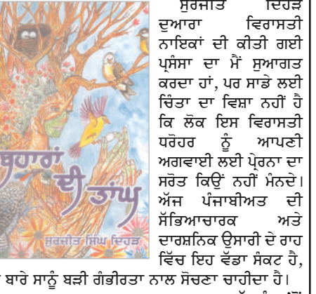
ਬਹਾਰਾਂ ਦੀ ਤਾਂਘ