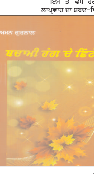
ਬਦਾਮੀ ਰੰਗ ਦੇ ਛਿੱਟੇ