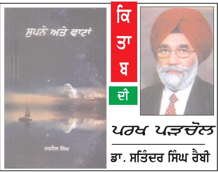
ਸੁਪਨੇ ਅਤੇ ਵਾਟਾਂ