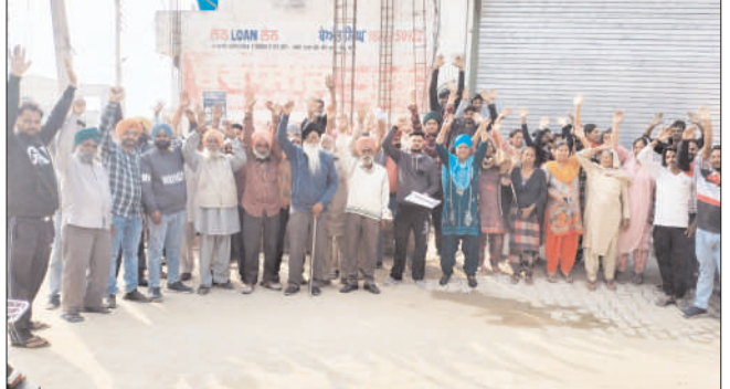
ਰਿਹਾਇਸ਼ੀ ਇਲਾਕੇ 'ਚ ਲਾਏ ਟਾਵਰ ਦਾ ਵਿਰੋਧ ਕਰਦੇ ਲੋਕ।

ਟਾਵਰ ਨਾ ਹਟਾਏ ਜਾਣ 'ਤੇ ਸੜਕਾਂ 'ਤੇ ਉਤਰਨ ਦੀ ਚੇਤਾਵਨੀ ਨਜ਼ਾਇਬ ਟਾਵਰ ਨਹੀਂ ਲੱਗਣ ਦਿਆਂਗੇ-ਈ ਓ