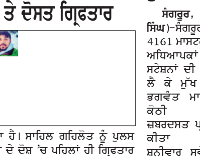
ਕੋ ਸੂਬਾ ਪੰਚਰੀ ਰੋਸ ਰੈਲੀ ਕੀਤੀ ਗਈ। ਇਸ ਰੋਸ ਰੈਲੀ ਕਰਨ ਤੋਂ ਬਾਅਦ ਭਗਵੰਤ ਮਾਨ ਦੀ ਕੋਠੀ ਤੱਕ ਰੋਸ ਮਾਰਚ ਕੀਤਾ ਗਿਆ।

ਇਸ ਸਭ ਤੋਂ ਸਾਰਾ ਸੱਚ ਪੰਜਾਬ ਦੀ ਜਨਤਾ ਸਾਹਮਣੇ ਹੈ ਕਿ ਕੋਣ ਪੰਜਾਬ ਦੇ ਸਰਮਾਏ ਨੂੰ ਲੁੱਟਣਾ ਰਿਹਾ ਅਤੇ ਕੋਣ ਇਸ ਦੇ ਹਿੱਤ ਲਈ ਕੰਮ ਕਰ ਰਿਹਾ ਹੈ। ਕੋਂ ਨੇ ਕਿਹਾ ਕਿ ਅਸਲ ਵਿੱਚ ਸਰਕਾਰੀ ਖੰਡਾਂ ਚਾਲੂ ਹੋ ਜਾਣ ਕਾਰਨ ਵਪਾਰਕ ਖੰਡਾਂ ਦੀ ਲੁੱਟ 'ਤੇ ਰੋਕ ਲੱਗੀ ਹੈ। ਉਨ੍ਹਾਂ ਨੂੰ ਮਜਬੂਰ ਰੋਣ ਦੇ ਰੋਟ ਘਟਾਉਣੇ ਪੈ ਗਏ। ਸਿਸਟਮ ਪਾਰਦਰਸ਼ੀ ਹੋਣ ਨਾਲ ਗੁੱਡਾ ਪਰਚੀ ਅਤੇ ਟਰਾਂਸਪਾਰੈਂਟ ਮਾਰੀਆ ਵੀ ਖਤਮ ਹੋਇਆ। ਇਸ ਨਾਲ ਮਜ਼ੀਨੀਆਂ ਦੇ ਸਾਥੀਆਂ ਨੂੰ ਨੁਕਸਾਨ ਹੋ ਰਿਹਾ ਹੈ ਅਤੇ ਇਸੇ ਕਰਕੇ ਹੀ ਮਜ਼ੀਨੀਆਂ ਨੂੰ ਤਕਲੀਫ ਹੋ ਰਹੀ ਹੈ ਅਤੇ ਉਹ ਮਾਨ ਸਰਕਾਰ ਨੂੰ ਬਦਲਮ ਕਰਨ ਲਈ ਝੂਠ ਬੁਠ ਕਰ ਰਹੇ ਹਨ ਅਤੇ ਲੋਕਾਂ ਨੂੰ ਗੁੰਮਰਾਹ ਕਰਨ ਦੀ ਕੋਸ਼ਿਸ਼ ਕਰ ਰਹੇ ਹਨ। ਨਿੱਜੀ ਸ਼ਬਦੀ ਵਾਰ 'ਤੇ ਪ੍ਰਤੀਕਿਰਿਆ ਦਿੰਦਿਆਂ ਕੋਂ ਨੇ ਕਿਹਾ, 'ਜਿਸ ਭਾਜਪਾ ਦਾ ਨਾਲ ਮਿਲ ਕੇ ਅਕਾਲੀ ਦਲ ਨੇ ਕਿਸਾਨ ਵਿਰੋਧੀ ਕਾਲੇ ਖੇਤੀ ਬਿੱਲ ਪਾਸ ਕੀਤੇ ਸਨ, ਮੈਂ ਉਸ ਪਾਰਟੀ ਨੂੰ ਲੱਤ ਖੜ੍ਹਾ ਹਾਂ। ਉਨ੍ਹਾਂ ਬਿਕਰਮ ਮਜ਼ੀਨੀਆਂ ਨੂੰ ਝੂਠ ਬੁਠ ਅਤੇ ਘਟੀਆ ਰਾਜਨੀਤੀ ਕਰਨ ਤੋਂ ਗੁਰੇਜ਼ ਕਰਨ ਦੀ ਸਲਾਹ ਦਿੰਦੇ ਅਤੇ ਕਿਹਾ ਕਿ ਮਾਨ ਸਰਕਾਰ ਪੰਜਾਬ ਰਿਤੋੜੀ ਅਤੇ ਲੋਕ-ਪੱਖੀ ਸਰਕਾਰ ਹੈ ਅਤੇ ਆਮ ਲੋਕਾਂ ਦੇ ਭਲੇ ਮੁੱਦੇ ਨਜ਼ਰ ਰੱਖ ਕੇ ਹੀ ਕੰਮ ਕਰ ਰਹੀ ਹੈ।