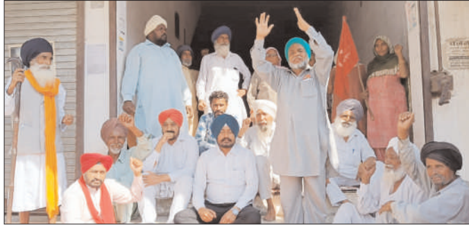
ਕੁਰਕੀ ਦੋਰਾਨ ਪਰਨਾ ਦੇ ਕੇ ਨਾਅਰੇਬਾਜ਼ੀ ਕਰਦੇ ਹੋਏ ਵੱਖ ਵੱਖ ਜਥੇਬੰਦੀਆਂ ਦੇ ਆਗੂ।

ਕੁਰਕੀ (ਗੋਤਵਾਲ)-ਇੱਥੇ ਇੱਕ ਦੁਕਾਨਦਾਰ ਦੀ ਕੁਰਕੀ ਕਰਨ ਆਈ ਪੰਜਾਬ ਨੈਸ਼ਨਲ ਬੈਂਕ ਦੀ ਟੀਮ ਤੇ ਪ੍ਰਸ਼ਾਸਨਕ ਅਧਿਕਾਰੀਆਂ ਨੂੰ ਇਸ ਕਿਸਾਨ-ਮਜ਼ਦੂਰਾਂ ਦੀਆਂ ਵੱਖ ਵੱਖ ਜਥੇਬੰਦੀਆਂ ਨੇ ਬਲਬਦਾ ਵਿਰੋਧ ਕਰਕੇ ਬੈਰੰਗ ਵਾਪਸ ਮੌੜੇ ਦਿੱਤੇ ਤੇ ਪਰਨਾਕਾਰੀਆਂ ਨੇ ਰੋਹ ਭਰਪੂਰ ਨਾਅਰੇਬਾਜ਼ੀ ਵੀ ਕੀਤੀ। ਸਿਮਵਾਰ ਸਵੇਰ ਤੋਂ ਹੀ ਭੁੱਲ ਹਿੰਦ ਕਿਸਾਨ ਸਭਾ, ਮਜ਼ਦੂਰ ਮੁਕਤੀ ਮੋਰਚਾ ਤੇ ਜਮਹੂਰੀ ਕਿਸਾਨ ਸਭਾ ਨੇ ਸਾਂਝੇ ਰੂਪ ਵਿੱਚ ਪਰਨੇ ਦੀ ਅਗਵਾਈ ਵਿੱਚ ਸਬੰਧ