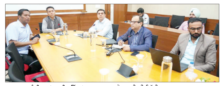
ਚੰਡੀਗੜ੍ਹ (ਗੁਰਜੀਤ ਬਿੱਲਾ)

ਕਿਹਾ ਕਿ 'ਸੀ ਐੱਮ ਦੀ ਯੋਗਸ਼ਾਲਾ' ਲੋਕਾਂ ਨੂੰ ਯੋਗ ਰਾਹੀਂ ਚੰਗੀ ਸਿਹਤ ਨੂੰ ਯਕੀਨੀ ਬਣਾਉਣ ਲਈ ਜਾਗਰੂਕਤਾ ਪੈਦਾ ਕਰਨ ਵਿਚ ਮਹੱਤਵਪੂਰਨ ਭੂਮਿਕਾ ਨਿਭਾਵੇਗੀ। ਮੁੱਖ ਮੰਤਰੀ ਨੇ ਕਿਹਾ ਕਿ ਮੌਜੂਦਾ ਸਮੇਂ ਨਾ ਸਿਰਫ ਚੰਗੀ ਸਿਹਤ, ਸਗੋਂ ਲੋਕਾਂ ਨੂੰ ਤਣਾਅ ਮੁਕਤ ਹੋਣਾ ਵੀ ਬਹੁਤ ਜ਼ਰੂਰੀ ਹੈ, ਕਿਉਂ ਜੋ ਰੋਜ਼ਾਨਾ ਜੀਵਨ ਵਿਚ ਅਨੇਕਾਂ ਚੁਣੌਤੀਆਂ ਨਾਲ ਜੂਝਣਾ ਪੈਂਦਾ ਹੈ। ਉਨ੍ਹਾਂ ਕਿਹਾ ਕਿ ਲੋਕਾਂ ਉੱਤੇ ਵਧ ਰਿਹਾ ਤਣਾਅ ਸਾਡੇ ਸਾਰਿਆਂ ਲਈ ਵੱਡੀ ਚਿੰਤਾ ਦਾ ਵਿਸ਼ਾ ਹੈ ਅਤੇ ਇਸ ਸਮੱਸਿਆ ਤੋਂ ਨਿਜਾਤ ਦਿਵਾਉਣ ਲਈ ਯੋਗਾ ਅਹਿਮ ਭੂਮਿਕਾ ਅਦਾ ਕਰ ਸਕਦਾ ਹੈ। ਚੰਗਾ ਜੀਵਨ ਬਤੀਤ ਕਰਨ ਲਈ ਮਾਨਸਿਕ ਤੇ ਸਰੀਰਕ ਤੌਰ ਉੱਤੇ ਸੰਤੁਲਨ ਕਾਇਮ ਰੱਖਣਾ ਮਹੱਤਵਪੂਰਨ ਹੈ ਅਤੇ ਜੀਵਨ ਜਾਚ ਵਿਚ ਕੁਝ ਤਬਦੀਲੀਆਂ ਲਿਆਉਣ ਅਤੇ ਯੋਗਾ ਰਾਹੀਂ ਇਸ ਨੂੰ ਯਕੀਨੀ ਬਣਾਇਆ ਜਾ ਸਕਦਾ ਹੈ। ਮੁੱਖ ਮੰਤਰੀ ਨੇ ਉਮੀਦ ਜ਼ਾਹਰ ਕੀਤੀ ਕਿ 'ਸੀ ਐੱਮ ਯੋਗਸ਼ਾਲਾ' ਮੁਹਿੰਮ ਹਰੇਕ ਪੰਜਾਬੀ ਲਈ ਤੰਦਰੁਸਤ ਤੇ ਮਿਆਰੀ ਜੀਵਨ ਨੂੰ ਯਕੀਨੀ ਬਣਾਉਣ ਦੇ ਟੀਚੇ ਨੂੰ ਹਾਸਲ ਕਰਨ ਦੀ ਸ਼ੁਰੂਆਤ ਹੈ। ਉਨ੍ਹਾਂ ਉਮੀਦ ਜ਼ਾਹਰ ਕੀਤੀ ਕਿ ਇਹ ਯੋਗਸ਼ਾਲਾਵਾਂ ਸਿਹਤਮੰਦ ਤੇ ਪ੍ਰਗਤੀਸ਼ੀਲ ਪੰਜਾਬ ਦੀ ਸਿਰਜਣਾ ਵਿਚ ਕਾਰਗਰ ਰੋਲ ਅਦਾ ਕਰਨਗੀਆਂ। ਉਹ ਦਿਨ ਦੂਰ ਨਹੀਂ ਜਦੋਂ ਇਹ ਯੋਗਸ਼ਾਲਾਵਾਂ ਪੰਜਾਬੀਆਂ ਦੇ ਬਿਹਤਰ ਜੀਵਨ ਨੂੰ ਯਕੀਨੀ ਬਣਾਉਣ ਲਈ ਸਹਾਈ ਸਿੱਧ ਹੋਣਗੀਆਂ।