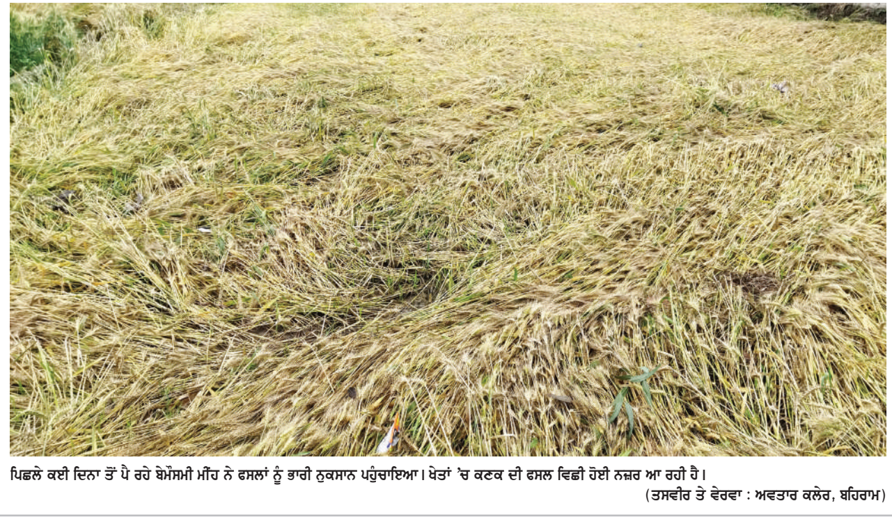
ਪਿਛਲੇ ਕਈ ਦਿਨਾਂ ਤੋਂ ਪੈ ਹੋ ਰਹੇ ਬੇਮੋਸਮੀ ਮੀਂਹ ਨੇ ਫਸਲਾਂ ਨੂੰ ਭਾਰੀ ਨੁਕਸਾਨ ਪਹੁੰਚਾਇਆ। ਪੇਟਾਂ 'ਚ ਕਣਕ ਦੀ ਫਸਲ ਵਿਛੋੜੀ ਹੋਈ ਨਜ਼ਰ ਆ ਰਹੀ ਹੈ।