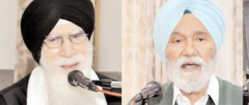
ਬਹਿਰਮ