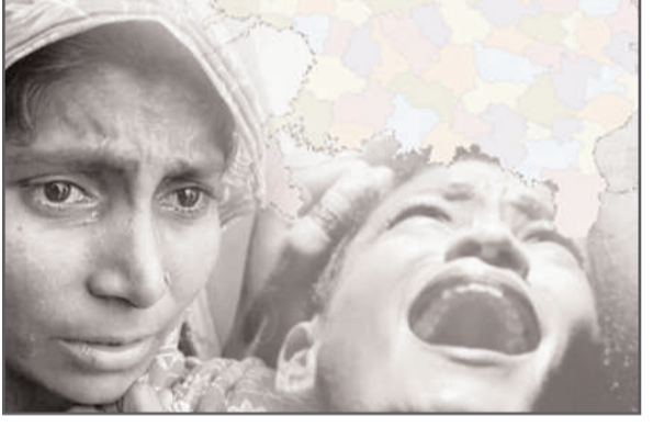
ਆਂਢ-ਗੁਆਂਢ ਜਾਂ ਗਿੜਦੇਦਾਰਾਂ ਵਿੱਚ ਹੀ ਚਾਚੇ, ਮਾਮਾਂ ਜਾਂ ਭਰਾ ਲੱਗਦੇ ਦਰਿਦੇ ਹੀ ਅੰਗਰੇਜ਼ ਨੂੰ ਨੱਚ-ਨੱਚ ਖਾ ਗਏ। ਰੋਜ਼ ਅਖਬਾਰਾਂ ਦੀਆਂ ਖਬਰਾਂ ਦਿਲ ਕੰਬਾਉਂਦੀ ਹਨ। ਕੀ ਇਸੇ ਭਾਰਤ ਨੂੰ ਲੋਕ ਮਹਾਨ ਕਹਿੰਦੇ ਹਨ? ਇੱਕ ਮਰਦ ਨੂੰ ਦੁਨੀਆਂ ਤੋਂ ਵਾਹੁਣ ਲਈ ਅੰਗਰੇਜ਼ ਦੀ ਕੁੱਖ ਦੀ ਲੋੜ ਪੈਂਦੀ ਹੈ ਤੇ ਆਉਣ ਲਈ ਅੰਗਰੇਜ਼ ਦੇ ਦੁੱਧ ਦੀ ਲੋੜ ਪੈਂਦੀ ਹੈ। ਇਹ ਅੰਗਰੇਜ਼ ਹੀ ਹੈ, ਜੋ ਜਦੋਂ ਪੰਜ ਦੀ ਪੀੜਾਂ ਸਹਿ ਕੇ ਖੱਚੇ ਨੂੰ ਜਨਮ ਦਿੰਦੀ ਹੈ ਤੇ ਗਿੱਲੀ ਥਾਂ 'ਤੇ ਆਪ ਸੌ ਕੇ ਖੱਚੇ ਨੂੰ ਸੁੱਕੀ ਥਾਂ 'ਤੇ ਪਾਉਂਦੀ ਹੈ। ਉਸ ਦੀਆਂ ਕੁਰਬਾਨੀਆਂ ਦਾ ਮੁੱਲ ਨਸ਼ੇਰੀ ਪੁੱਤ ਉਸ ਨੂੰ ਘਰੋਂ ਕੱਢ ਕੇ ਪਾਉਂਦੇ

ਹਰ ਖੇਤਰ ਵਿੱਚ ਅੰਗਰੇਜ਼ ਨੇ ਵਡਮੁੱਲਾ ਯੋਗਦਾਨ ਪਾਇਆ। ਉਸ ਨੇ ਖੇਡਾਂ ਨੂੰ ਘਰ ਬਣਾਇਆ। ਆਪਣੀ ਹਿੰਮਤ ਤੇ ਦਲੇਰੀ ਨਾਲ ਉਹ ਮਰਦ ਦੇ ਮੱਢੇ ਨਾਲ ਮੋਢਾ ਜੋੜ ਕੇ ਚੱਲੀ ਗਈ ਨਹੀਂ ਬਲਕਿ ਉਸ ਤੋਂ ਵੀ ਅੱਗੇ ਨਿਕਲ ਗਈ। ਇੱਕ ਪੜ੍ਹੀ-ਲਿਖੀ ਅਤੇ ਅੱਗੇ ਨਿਕਲ ਚੁੱਕੀ ਅੰਗਰੇਜ਼ ਵੀ ਜ਼ੁਲਮ ਦਾ ਸ਼ਿਕਾਰ ਹੁੰਦੀ ਹੈ, ਫਿਰ ਅਨਪੜ੍ਹ ਪੱਛੂ ਤੇ ਗਰੀਬ ਅੰਗਰੇਜ਼ ਦੀ ਦੁਰਦਾਸ਼ਾ ਦਾ ਅੰਦਾਜ਼ਾ ਲਗਾਉਣਾ ਕੋਈ ਮੁਸ਼ਕਲ ਨਹੀਂ ਹੈ। ਅੱਜ ਸਭ ਤੋਂ ਵੱਡੀ ਲੋੜ ਅੰਗਰੇਜ਼ ਨੂੰ ਇਕਮੁੱਠ ਹੋਣ ਤੇ ਆਪਣੀ ਸ਼ਕਤੀ ਪਹਿਚਾਣਣ ਦੀ ਹੈ। ਕੀ ਅੰਗਰੇਜ਼ ਇੰਨੀ ਬੇਸ਼ਰਾਰ ਤੇ ਕਮਜ਼ੋਰ ਹੈ ਕਿ ਜਿਸ ਦਾ ਦਿਲ ਕਰੇ, ਉਸ ਨੂੰ ਘਰੋਂ ਚੁੱਕ ਕੇ ਲੈ ਜਾਵੇ। ਜਿਸ ਦਾ ਦਿਲ ਕਰੇ, ਇਸ ਨਾਲ ਵਿਆਹ ਕਰਵਾਉਣ ਨੂੰ ਉਹ ਵਿਆਹ ਕਰਵਾ ਲਵੇ, ਜੇ ਕੋਈ ਨਾ ਮੰਨੇ ਤਾਂ ਉਸ ਨੂੰ ਤੇਜ਼ਾਬ ਨਾਲ ਜਲਾ ਦਿੱਤਾ ਜਾਵੇ। ਜਿੱਥੇ ਦਿਲ ਕਰੇ, ਇਸ ਨਾਲ ਬਲਾਤਕਾਰ ਕੀਤਾ ਜਾਵੇ, ਉਹ ਭਾਂਡੇ ਖੋਲ੍ਹੇ ਹੋਏ, ਟ੍ਰੇਨ ਹੋਵੇ, ਖੇਡ ਜਾਂ ਕੁਝ ਹੋਰ। ਆਖਿਰ ਕਿਉਂ? ਮਾਂ ਦੀ ਗੋਦੀ ਵਿੱਚ ਖੇਡਣ ਵਾਲੀਆਂ ਮਾਸੂਮ ਬੱਚੀਆਂ ਦੇ ਵੀ ਬਲਾਤਕਾਰ ਕੀਤੇ ਜਾਂਦੇ ਹਨ। ਕੀ ਕਦੀ ਸੱਚਿਆ ਕਿਸੇ ਨੇ ਕਿ ਜਿਨ੍ਹਾਂ ਬੱਚੀਆਂ ਨਾਲ ਅਜਿਹੇ ਹਾਦਸੇ ਹੋਏ ਹੋਣਗੇ, ਉਹ ਕਿਵੇਂ ਰੋਜ਼-ਤਿਲ-ਤਿਲ ਮਰਦੀਆਂ ਹੋਣਗੀਆਂ? ਜ਼ੁਮ ਦਾ ਹੱਦ ਦੇਖੋ ਕਿ ਅੰਗਰੇਜ਼ ਦਾ ਬਲਾਤਕਾਰ