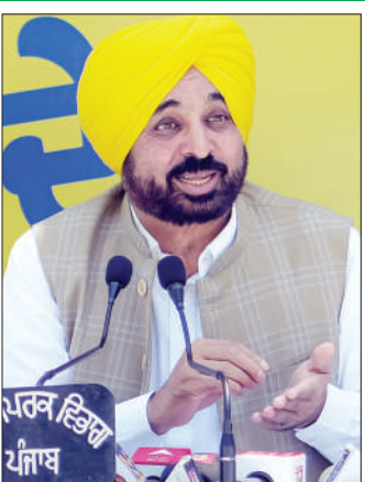
ਉਨ੍ਹਾਂ ਕਿਹਾ ਕਿ ਇਹ ਮਾਲੀਆ ਪਿਛਲੇ ਸਾਲ ਨਾਲੋਂ 2587 ਕਰੋੜ ਰੁਪਏ ਵੱਧ ਹੈ, ਜੋ ਕਿ ਲੱਗਭੱਗ 41.41 ਫੀਸਦੀ ਵੱਧ ਬਣਦਾ ਹੈ। ਭਗਵੰਤ ਮਾਨ ਨੇ ਕਿਹਾ ਕਿ ਅਗਲੇ ਵਿੱਤੀ ਸਾਲ ਲਈ 9754 ਕਰੋੜ ਰੁਪਏ ਦਾ ਨਿਰੰਤਰ ਯਤਨਾਂ ਸਦਕਾ ਇਸ ਟੀਚੇ ਨੂੰ ਵੀ ਪੂਰਾ ਕਰ ਲਿਆ ਜਾਵੇਗਾ।

ਮੁੱਖ ਮੰਤਰੀ ਨੇ ਕਿਹਾ ਕਿ ਭਾਵੇਂ ਸੂਬਾ ਸਰਕਾਰ ਨੇ ਤਿੰਨ ਮਹੀਨੇ ਦੀ ਦੇਰੀ ਨਾਲ ਆਬਕਾਰੀ ਨੀਤੀ ਅਮਲ ਵਿੱਚ ਲਿਆਂਦੀ ਸੀ, ਪਰ ਇਸ ਨਾਲ ਸੂਬੇ ਨੂੰ 8841 ਕਰੋੜ ਰੁਪਏ ਦਾ ਮਾਲੀਆ ਪ੍ਰਾਪਤ ਹੋਇਆ ਹੈ।