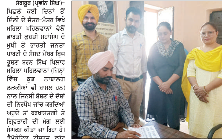
ਸੰਗਰੂਰ -ਪਿਛਲੇ ਕਈ ਦਿਨਾਂ ਤੋਂ ਦਿੱਲੀ ਦੇ ਜੰਤਰ-ਮੰਤਰ ਵਿਖੇ

ਮਹਿਲਾ ਪਹਿਲਵਾਨਾਂ ਵੱਲੋਂ ਭਾਰਤੀ ਕੁਸ਼ਤੀ ਮਹਾਂਸੰਘ ਦੇ ਮੁਖੀ ਤੇ ਭਾਰਤੀ ਜਨਤਾ ਪਾਰਟੀ ਦੇ ਸੇਸਟ ਮੈਂਬਰ ਬਿਜੂ ਭੁਸ਼ਣ ਸ਼ਰਨ ਸਿੰਘ ਖਿਲਾਫ ਮਹਿਲਾ ਪਹਿਲਵਾਨਾਂ (ਜਿਨ੍ਹਾਂ ਵਿੱਚ ਕੁਝ ਨਾਥਾਲਗ ਲੜਕੀਆਂ ਵੀ ਸ਼ਾਮਲ ਹਨ) ਨਾਲ ਜਿਨਸੀ ਸ਼ੋਸ਼ਣ ਦੇ ਦੋਸ਼ਾਂ ਦੀ ਨਿਰੂਪਣ ਕਰਦਿਆਂ ਅਹੁਦੇ ਤੋਂ ਬਰਖਾਸਤਗੀ ਤੇ ਗ੍ਰਿਫ਼ਤਾਰ ਦੀ ਮੰਗ ਲਈ ਸੰਗਰੂਰ ਦੇ ਸਕੂਲਾਂ ਵਿੱਚ ਸਤਿਕਾਰ ਮੁਹਿੰਮ ਚਲਾਈ ਜਾ ਰਹੀ ਹੈ ਅਤੇ ਸੰਘਰਸ਼ ਨਾਲ ਇਕੱਠੇ ਹੋਣ ਦੀ ਮੰਗ ਕੀਤੀ ਜਾ ਰਹੀ ਹੈ। ਇਸੇ ਲੜੀ ਤਹਿਤ ਅੱਜ ਜ਼ਿਲ੍ਹਾ ਸੰਗਰੂਰ ਤੇ ਸਾਰੇ ਬਲਾਕਾਂ ਦੇ ਸੈਕੱਡ ਸਕੂਲਾਂ ਵਿੱਚ