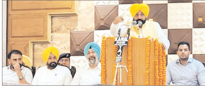
ਸੰਬੰਧਿਤ ਕਰਦੇ ਹੋਏ ਮੁੱਖ ਮੰਤਰੀ ਭਗਵੰਤ ਮਾਨ।

ਧੂਰੀ ਹਲਕੇ ਦੇ ਲੋਕਾਂ ਵੱਲੋਂ ਮਿਲੇ ਮਾਣ-ਸਤਿਕਾਰ ਦਾ ਕਿਸੇ ਵੀ ਕਰਸੀ 'ਚ ਕਰਜ਼ਾ ਨਹੀਂ ਮੋੜ ਸਕਦਾ