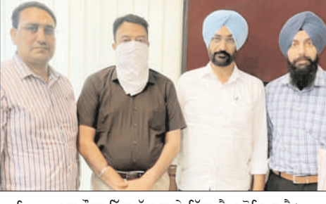
ਬੁਲਾਰੇ ਨੇ ਦੱਸਿਆ ਕਿ ਇਸ ਸ਼ਿਕਾਇਤ ਦੀ ਮੁੱਢਲੀ ਜਾਂਚ ਉਦਾਰ ਬਿੰਡਾ ਰੋਜ਼ ਦੀ ਵਿਜੀਲੈਂਸ ਯੂਨਿਟ ਨੇ ਜਾਲ ਵਿਭਾਗ ਤੇ ਮੁਲਜ਼ਮ ਸੁਪਰਡੈਂਟ ਇੰਜੀਨੀਅਰ ਨੂੰ ਦੇ ਸਰਕਾਰੀ ਗਵਾਹਾਂ ਦੀ ਗਵਾਹੀ ਵਿੱਚ ਸ਼ਿਕਾਇਤਕਰਤਾ ਤੋਂ 1,00,000 ਰੁਪਏ ਰਿਸ਼ਵਤ ਲੈਣ ਦੀਆਂ ਰੰਗੇ ਹੱਥੀਂ ਕਾਬੂ ਕਰ ਲਿਆ। ਵਿਜੀਲੈਂਸ ਟੀਮ ਨੇ ਉਸ ਕੋਲੋਂ ਮੌਕੇ 'ਤੇ ਹੀ ਗ੍ਰਿਫਤਾਰ ਦੀ ਕਮਾਂ ਕਰਵਾ ਕਰ ਲਈ। ਇਸ ਸਬੰਧੀ ਉਕਤ ਮੁਲਜ਼ਮ ਖਿਲਾਫ ਵਿਜੀਲੈਂਸ ਬਿਊਰੋ ਦੇ ਬਾਣਾ ਬਿੰਡਾ ਵਿਖੇ ਭ੍ਰਿਸ਼ਟਾਚਾਰ ਕੇਸ ਕਾਨੂੰਨ ਤਹਿਤ ਮੁਕੱਦਮਾ ਦਰਜ ਕਰਕੇ ਅਗਲੀ ਜਾਂਚ ਆਰੰਭ ਦਿੱਤੀ ਗਈ ਹੈ।