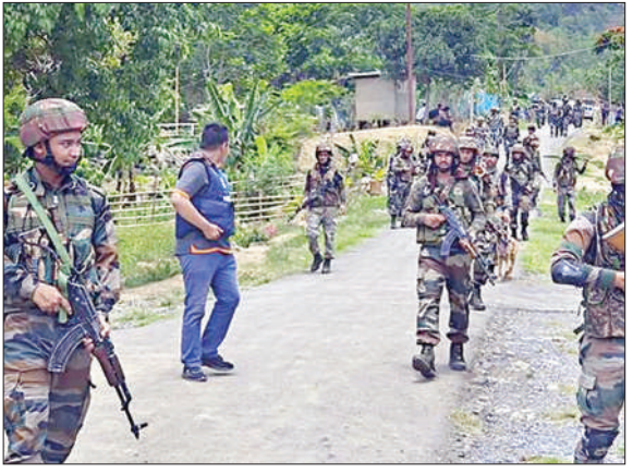
ਚਲੇ ਗਏ। ਇਸੇ ਦੌਰਾਨ ਮਨੀਪੁਰ ਦੇ ਮੁੱਖ ਮੰਤਰੀ ਐੱਨ ਬੀਰੇਨ ਸਿੰਘ ਐਤਵਾਰ ਦਿੱਲੀ 'ਚ ਕੇਂਦਰੀ ਗ੍ਰਹਿ ਮੰਤਰੀ ਅਮਿਤ ਸ਼ਾਹ ਨੂੰ ਉਨ੍ਹਾਂ ਦੀ ਰਿਹਾਇਸ਼ 'ਤੇ ਮਿਲੇ। ਸੂਰਤਾਂ ਮੁਤਾਬਕ ਸਿੰਘ ਨੇ ਸ਼ਾਹ ਨੂੰ ਸੂਬੇ ਦੇ ਮੌਜੂਦਾ ਹਾਲਾਤ ਬਾਰੇ ਸੰਖੇਪ 'ਚ ਜਾਣਕਾਰੀ ਦਿੱਤੀ। ਮੁੱਖ ਮੰਤਰੀ ਅਜਿਹੇ ਮੌਕੇ ਦਿੱਲੀ ਆਏ ਹਨ, ਜਦੋਂ ਇਕ ਦਿਨ ਪਹਿਲਾਂ ਸ਼ਾਹ ਨੇ ਸਰਬ-ਪਾਰਟੀ ਮੀਟਿੰਗ ਸੱਦ ਕੇ ਆਵਾ ਕੀਤਾ ਸੀ ਕਿ ਪ੍ਰਧਾਨ ਮੰਤਰੀ ਨਰਿੰਦਰ ਮੋਦੀ ਵੱਲੋਂ ਹਿੰਸਾ ਦੇ ਸੰਭਵ ਮਨੀਪੁਰ 'ਤੇ ਨੌਕਿਰੀ ਨਜ਼ਰ ਰੱਖੀ ਜਾ ਰਹੀ ਹੈ ਤੇ ਉਹ ਇਸ ਸੰਵੇਦਨਸ਼ੀਲ ਸੂਦੇ ਦਾ ਹੱਲ ਲੱਭਣ ਲਈ ਸੋਧ ਦੇ ਰਹੇ ਹਨ।