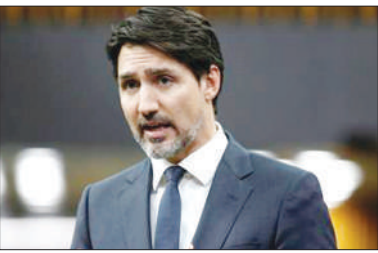
ਪਿਆਨ ਪੀੜਤਾਂ ਨੂੰ ਸਜ਼ਾ ਦੇਣ ਦੀ ਬਜਾਏ ਦੋਸ਼ੀਆਂ ਦੀ ਪਛਾਣ ਕਰਨਾ ਹੈ। ਪ੍ਰਧਾਨ ਮੰਤਰੀ ਨੇ ਐੱਨ ਡੀ ਪੀ ਆਗੂ ਜਗਮੀਤ ਸਿੰਘ ਵੱਲੋਂ ਦੇਸ਼ ਨਿਕਾਲਾ ਦਿੱਤੇ ਜਾਣ ਵਾਲੇ ਪੀੜਤ ਵਿਦਿਆਰਥੀਆਂ ਦੀ ਸਥਿਤੀ ਬਾਰੇ ਚਿੰਤਾਵਾਂ ਦਾ

ਓਟਾਵਾ : ਫਰਜ਼ੀ ਦਾਖਲਾ ਪੱਤਰ ਕਾਰਨ ਕੈਨੇਡਾ ਤੋਂ ਦੇਸ਼ ਨਿਕਾਲੇ ਦਾ ਸਾਹਮਣਾ ਕਰ ਰਹੇ 700 ਭਾਰਤੀ ਵਿਦਿਆਰਥੀਆਂ ਨੂੰ ਭਰੋਸਾ ਦਿਵਾਉਂਦਿਆਂ ਪ੍ਰਧਾਨ ਮੰਤਰੀ ਜਸਟਿਨ ਟਰੂਡੋ ਨੇ ਕਿਹਾ ਕਿ ਉਹ ਹਰੇਕ ਕੇਸ ਦਾ ਮੁਲਾਂਕਣ ਕਰਨਗੇ ਅਤੇ ਧੋਖਾਧੜੀ ਦੇ ਪੀੜਤਾਂ ਨੂੰ ਆਪਣਾ ਪੱਖ ਰੱਖਣ ਤੇ ਬੇਕਸੂਰ ਹੋਣ ਬਾਰੇ ਸਬੂਤ ਪੇਸ਼ ਕਰਨ ਦਾ ਮੌਕਾ ਮਿਲੇਗਾ। ਇਹ ਟਿੱਪਣੀ ਅਜਿਹੇ ਸਮੇਂ ਆਈ ਹੈ, ਜਦੋਂ ਸੈਂਕੜੇ ਭਾਰਤੀ ਵਿਦਿਆਰਥੀ, ਜਿਨ੍ਹਾਂ ‘ਚ ਜ਼ਿਆਦਾਤਰ ਪੰਜਾਬ ਦੇ ਹਨ, ਕੈਨੇਡਾ ‘ਚ ਸੜਕਾਂ ‘ਤੇ ਉਤਰ ਰਹੇ ਹਨ। ਉਹ ਇਹ ਕਹਿ ਰਹੇ ਹਨ ਕਿ ਉਨ੍ਹਾਂ ਨੂੰ ਭਾਰਤ ‘ਚ ਏਜੰਟਾਂ ਨੇ ਧੋਖਾ ਦਿੱਤਾ ਹੈ। ਇਸ ‘ਚ ਉਨ੍ਹਾਂ ਦਾ ਕੋਈ ਕਸੂਰ ਨਹੀਂ ਹੈ। ਟਰੂਡੋ ਨੇ ਪਾਲੀਵਾਲ ਬਿਹਸ ਦੌਰਾਨ ਕਿਹਾ—ਮੈਂ ਇਸ ਮਾਮਲੇ ਤੋਂ ਜਾਣੂ ਹਾਂ। ਸਾਡਾ