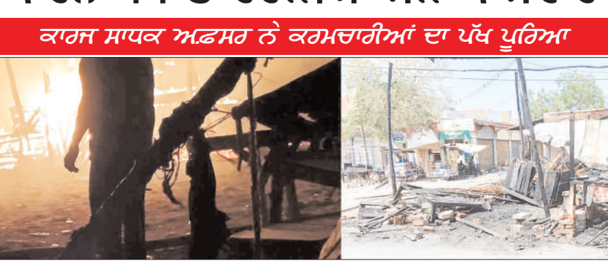
ਕਾਰਜ ਸਾਧਕ ਅਫਸਰ ਨੇ ਕਰਮਚਾਰੀਆਂ ਦਾ ਪੱਖ ਪੂਰਿਆ

ਮਲੋਟ (ਗੁਰਮੀਤ ਸਿੰਘ ਮੱਕੜ) ਬੀਤੀ ਗਤ ਰੇਲਵੇ ਟਰੈਕ ਨੇੜੇ ਲਗਭਗ ਪੇਂਟੇ 11 ਵੇਰੇ ਹੋਰੀ ਤੇ ਖੱਬਿਆਂ ਨੂੰ ਡਿਊਟੀ ਆਂਗ ਲੱਗ ਗਈ, ਜਿਸ ਦੀ ਤੁਰੰਤ ਸੂਚਨਾ ਵਾਰਿਓ ਬ੍ਰਿਗੇਡ ਨੂੰ ਫੋਨ 'ਤੇ ਦਿੱਤੀ ਗਈ, ਜਿੱਥੇ ਬੇਠੇ ਕਰਮਚਾਰੀ ਨੇ ਇਸ ਨੂੰ ਅਟਰੋਲਿਆ ਕਰਦਿਆਂ ਹੋਇਆਂ ਸੂਚਨਾ ਦੇਣ ਵਾਲੇ ਵਿਅਕਤੀ ਨੂੰ ਉਸ ਦਾ ਪਤਾ, ਫੋਨ ਨੰਬਰ ਆਦਿ ਪਹਿਲਾਂ ਲਿਖਵਾਉਣ ਲਈ ਕਿਹਾ ਤੇ ਫਿਰ ਅੱਗ 'ਤੇ ਕਾਬੂ ਪਾਉਣ ਦੀ ਗੱਲ ਕਹੀ, ਜਦੋਂ ਕਿ ਕਰਮਚਾਰੀ ਨੂੰ ਦੱਸਿਆ ਕਿ ਅੱਗ ਡਿਊਟੀ ਆਂਗ ਹੋਣ ਕਰਕੇ ਰਿਹਾਇਸ਼ੀ ਇਲਾਕਿਆਂ ਵੱਲ ਵਧ ਰਹੀ ਹੈ, ਪੰਜੂ ਉਹ ਕਰਮਚਾਰੀ ਆਪਣੀ ਗੱਲ 'ਤੇ ਹੀ ਅੰਤਿਆ