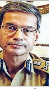
ਚੰਡੀਗੜ੍ਹ : ਪੰਜਾਬ ਅਸੈਂਬਲੀ ਨੇ ਮੰਗਲਵਾਰ ਪੰਜਾਬ ਪੁਲਸ ਐਕਟ ਵਿੱਚ ਸੋਧ ਪਾਸ ਕਰ ਦਿੱਤੀ, ਜਿਸ ਮੁਤਾਬਕ ਉਹ ਆਪਣੀ ਪਸੰਦ ਦਾ ਡੀ ਜੀ ਪੀ ਨਿਯੁਕਤ ਕਰ ਸਕੇਗੀ।