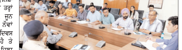
ਯੋਗਾ ਦਿਵਸ ਮਨਾਉਣ ਵਾਲੇ ਲੋਕਾਂ ਲਈ ਪਾਣੀ ਆਦਿ ਦੀ ਸਹੂਲਤ ਕਰਨੀ।