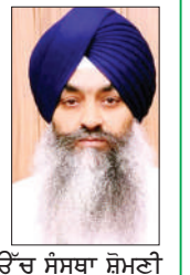
ਅੰਮ੍ਰਿਤਸਰ : ਸ੍ਰੀ ਹਰਿਮੰਦਰ ਸਾਹਿਬ ਵਿੱਚ ਹੁੰਦੇ ਕੀਰਤਨ ਦੇ ਪ੍ਰਸਾਰਨ ਬਾਰੇ ਵਿਧਾਨ ਸਭਾ ਵਿੱਚ ਮਤਾ ਪਾਸ ਹੋਣ ਤੋਂ ਪਹਿਲਾਂ ਅਕਾਲ ਤਖਤ ਦੇ ਜਥੇਦਾਰ ਗਿਆਨੀ ਰਘਬੀਰ ਸਿੰਘ ਨੇ ਸਰਕਾਰ ਨੂੰ ਕਿਹਾ ਕਿ ਉਹ ਸਿੱਖਾਂ ਦੀ ਸਰਵ-ਉੱਚ ਸੰਸਥਾ ਸ਼੍ਰੋਮਣੀ ਗੁਰਦੁਆਰਾ ਪ੍ਰਬੰਧਕ ਕਮੇਟੀ ਦੇ ਮਾਮਲਿਆਂ ‘ਚ ਦਖਲਅੰਦਾਜ਼ੀ ਨਾ ਕਰੇ।

ਅੰਮ੍ਰਿਤਸਰ : ਸ੍ਰੀ ਹਰਿਮੰਦਰ ਸਾਹਿਬ ਵਿੱਚ ਹੁੰਦੇ ਕੀਰਤਨ ਦੇ ਪ੍ਰਸਾਰਨ ਬਾਰੇ ਵਿਧਾਨ ਸਭਾ ਵਿੱਚ ਮਤਾ ਪਾਸ ਹੋਣ ਤੋਂ ਪਹਿਲਾਂ ਅਕਾਲ ਤਖਤ ਦੇ ਜਥੇਦਾਰ ਗਿਆਨੀ ਰਘਬੀਰ ਸਿੰਘ ਨੇ ਸਰਕਾਰ ਨੂੰ ਕਿਹਾ ਕਿ ਉਹ ਸਿੱਖਾਂ ਦੀ ਸਰਵ-ਉੱਚ ਸੰਸਥਾ ਸ਼੍ਰੋਮਣੀ ਗੁਰਦੁਆਰਾ ਪ੍ਰਬੰਧਕ ਕਮੇਟੀ ਦੇ ਮਾਮਲਿਆਂ ‘ਚ ਦਖਲਅੰਦਾਜ਼ੀ ਨਾ ਕਰੇ। ਵੀਡੀਓ ਬਿਆਨ ਰਾਹੀਂ ਗਿਆਨੀ ਰਘਬੀਰ ਸਿੰਘ ਨੇ ਕਿਹਾ ਕਿ ਸਰਕਾਰ ਦੀ ਇਹ ਕਾਰਵਾਈ ਸਿੱਖ ਖੰਭ ‘ਚ ਦੁਬਿਧਾ ਪੈਦਾ ਕਰ ਰਹੀ ਹੈ। ਗੁਰਬਾਣੀ ਪ੍ਰਸਾਰਨ ਦੇ ਮਾਲਮਿਲ ‘ਚ ਦੋਵਾਂ ਪਿਰਾਂ ਨੂੰ ● ਬਾਕੀ ਸਫ਼ਾ 2 ‘ਤੇ