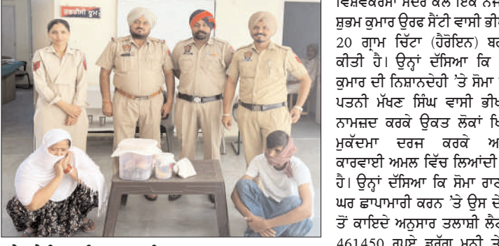
ਫੜੇ ਗਏ ਵਿਅਕਤੀ ਪੁਲਸ ਪਾਰਟੀ ਨਾਲ।

461450 ਰੁਪਏ ਡਰੱਗ ਮਨੀ ਤੇ 95 ਗ੍ਰਾਮ ਸੋਨੇ ਦੇ ਗ੍ਰਿਫ਼ਟੇ ਵੀ ਬਰਾਮਦ