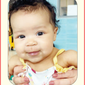
ਅੰਨਾਬੇਲੀ (ਯੂ ਐੱਸ ਏ)