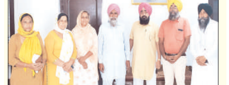
ਸ਼੍ਰੋਮਣੀ ਗੁਰਦੁਆਰਾ ਪ੍ਰਬੰਧਕ ਕਮੇਟੀ ਦੁਆਰਾ ਸ਼੍ਰੀ ਗੁਰੂ ਹਰਿਗੋਬਿੰਦ ਸਾਹਿਬ ਦਾ ਪ੍ਰਕਾਸ਼ ਦਿਹਾੜਾ ਮਨਾਇਆ ਜਾ ਰਿਹਾ ਹੈ।