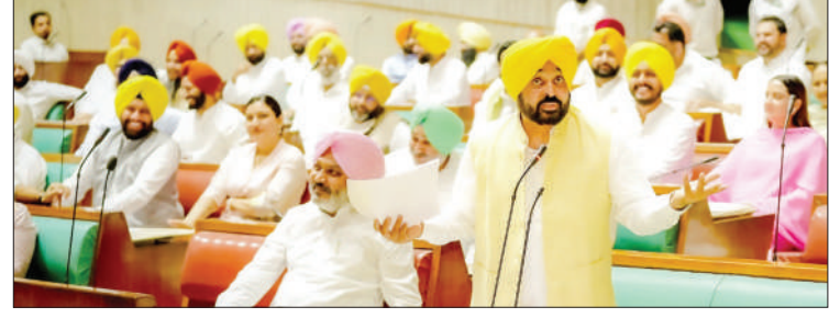
ਚੈਨਲ ਨੂੰ ਕਿਵੇਂ ਦਿੱਤੇ ਜਾ ਸਕਦੇ ਹਨ? ਮੁੱਖ ਮੰਤਰੀ ਨੇ ਕਿਹਾ ਕਿ ਇਹ ਬਿੱਲ ਕਿਸੇ ਵੀ ਤਰ੍ਹਾਂ ਨਾਲ ਧਾਰਮਿਕ ਮਾਮਲਿਆਂ ਵਿੱਚ ਦਖਲਅੰਦਾਜ਼ੀ ਨਹੀਂ ਕਰਦਾ, ਸਗੋਂ ਗੁਰਬਾਣੀ ਨੂੰ ਘਰ-ਘਰ ਤੱਕ ਪਹੁੰਚਾਉਣ ਨੂੰ ਯਕੀਨੀ ਬਣਾਉਣ ਲਈ ਇਹ ਨਿਮਾਣਾ ਜਿਹਾ ਕਦਮ ਹੈ।