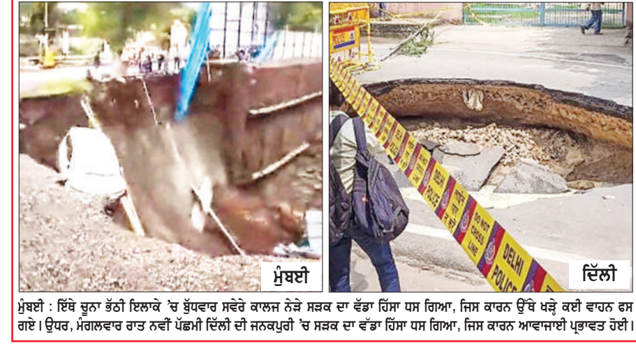
ਮੁੰਬਈ : ਇੱਥੇ ਬੁੱਧਾ ਭੱਠੀ ਲਿਲਕੇ 'ਚ ਬੁੱਧਵਾਰ ਸਵੇਰੇ ਕਾਲਜ ਨੇੜੇ ਸੜਕ ਦਾ ਵੱਡਾ ਹਿੱਸਾ ਜਾ ਗਿਆ, ਜਿਸ ਕਾਰਨ ਉੱਚੇ ਖੜ੍ਹੇ ਕਈ ਵਾਹਨ ਫਸ ਗਏ। ਉੱਚ, ਮੰਗਲਵਾਰ ਰਾਤ ਨਵੀਂ ਪੱਛਮੀ ਦਿੱਲੀ ਦੀ ਜਨਕਪੁਰੀ 'ਚ ਸੜਕ ਦਾ ਵੱਡਾ ਹਿੱਸਾ ਜਾ ਗਿਆ, ਜਿਸ ਕਾਰਨ ਆਵਾਜਾਈ ਪ੍ਰਭਾਵਤ ਹੋਈ।