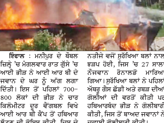
ਇੰਦਰਾ : ਮਨੀਪੁਰ ਦੇ ਬੋਝਲ ਜ਼ਿਲ੍ਹੇ 'ਚ ਮੰਗਲਵਾਰ ਰਾਤ ਗੁੱਸੇ 'ਚ ਆਈ ਭੀੜ ਨੇ ਆਈ ਆਰ ਬੀ ਦੇ ਜਵਾਨ ਦੇ ਘਰ ਨੂੰ ਅੱਗ ਲਗਾ ਦਿੱਤੀ। ਇਸ ਤੋਂ ਪਹਿਲਾਂ 700-800 ਲੋਕਾਂ ਦੀ ਭੀੜ ਨੇ ਚਾਰ ਕਿਲੋਮੀਟਰ ਦੂਰ ਵੈਂਗਲ ਵਿਖੇ ਆਈ ਆਰ ਬੀ ਕੈਂਪ ਤੋਂ ਹਥਿਆਰ ਲੁੱਟਣ ਦੀ ਕੋਸ਼ਿਸ਼ ਕੀਤੀ, ਜਿਸ ਦੇ ਨਤੀਜੇ ਵਜੋਂ ਸੁਰੱਖਿਆ ਬਲਾਂ ਨਾਲ ਝੜਪ ਹੋਈ, ਜਿਸ 'ਚ 27 ਸਾਲਾ ਨੌਜਵਾਨ ਰੋਨਾਲਡ ਮਾਰਿਆ ਗਿਆ। ਸੁਰੱਖਿਆ ਬਲਾਂ ਨੇ ਪਹਿਲਾਂ ਅੱਥਰੂ ਗੈਸ ਛੱਡੀ ਅਤੇ ਹੜਤਾਲ ਦੀਆਂ ਗੱਲੀਆਂ ਦੀ ਵਰਤੋਂ ਕੀਤੀ ਪਰ ਬਿਥਾਰਬੰਦ ਕੀਤੀ ਨਹੀਂ ਗਈ। ਜਿਸ ਤੋਂ ਬਾਅਦ ਜਵਾਨਾਂ ਨੇ ਜਵਾਬੀ ਗੋਲੀਬਾਰੀ ਕੀਤੀ।