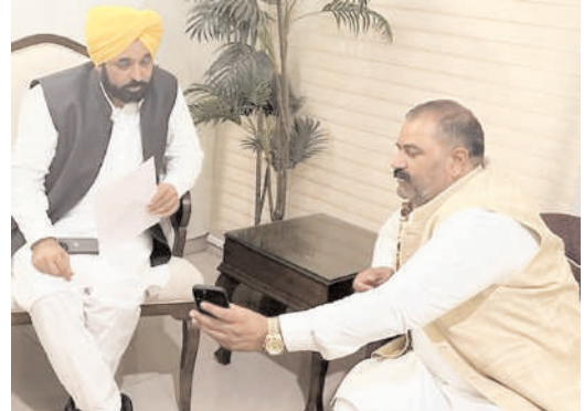
ਉਨ੍ਹਾਂ ਨੇ ਅੱਗੇ ਦੱਸਿਆ ਕਿ ਜਿਲ੍ਹੇ ਦੇ ਸਮੁੱਚੇ 9 ਵਿਧਾਨ ਸਭਾ ਹਲਕਿਆਂ ਦੇ ਸਰਬਪੱਖੀ ਵਿਕਾਸ ਦੇ ਸਬੰਧ ਵਿੱਚ ਮੁੱਖ ਮੰਤਰੀ ਨਾਲ ਵਿਚਾਰ ਨਾਲ ਚਰਚਾ ਕੀਤੀ ਗਈ। ਉਨ੍ਹਾਂ ਕਿਹਾ ਕਿ ਸਰਕਾਰ ਵੱਲੋਂ ਜਲੰਧਰ ਜਿਲ੍ਹੇ ਨੂੰ ਵਿਕਾਸ ਦੀਆਂ ਉੱਚ ਨੀਤੀਆਂ 'ਤੇ ਲਿਆਣ ਲਈ ਨਵੀਆਂ ਪਹਿਲਕਦਮੀਆਂ ਸ਼ੁਰੂ ਕਰਨ ਲਈ ਪਹਿਲਾਂ ਹੀ ਖਾਧਾ ਤਿਆਰ ਕੀਤਾ ਜਾ ਚੁੱਕਾ ਹੈ।