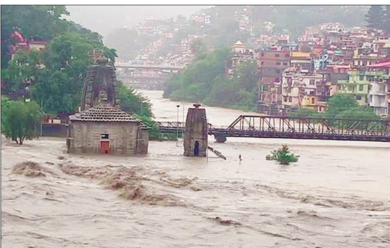
ਹਿਮਾਚਲ ਦੇ ਮੰਡੀ ਸ਼ਹਿਰ 'ਚੋਂ ਨਿਕਲਦਾ ਬਿਆਸ ਦਰਿਆ।

133.4 ਤੇ 2013 'ਚ 123.4 ਮਿਲੀਮੀਟਰ ਮੀਂਹ ਪਿਆ ਸੀ। ਜੰਮੂ-ਕਸ਼ਮੀਰ ਦੇ ਪੁਣਡ 'ਚ ਦੋ ਫੌਜੀ ਪੌਸ਼ਾਨਾ ਨਦੀ ਪਾਰ ਕਰਦੇ ਡੁੱਬ ਗਏ। ਹਿਮਾਚਲ 'ਚ 5, ਜੰਮੂ 'ਚ 2 ਅਤੇ ਯੂ ਪੀ 'ਚ 4 ਮੌਤਾਂ ਦੀਆਂ ਰਿਪੋਰਟਾਂ ਸਨ।