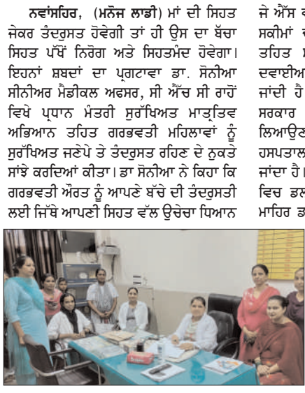
ਦੇਸ਼ ਚਾਹੀਦਾ ਹੈ, ਉੱਚੇ ਬੱਚੇ ਦੇ ਜਨਮ ਤੋਂ ਛੇ ਮਹੀਨੇ ਤੱਕ ਆਪਣਾ ਦੁੱਧ ਹੀ ਪਿਲਾਉਣਾ ਹੈ, ਜੋ ਬੱਚੇ ਲਈ ਅਤਿਅੰਤ ਵਾਗ ਸਾਬਤ ਹੁੰਦਾ ਹੈ। ਸੀਨੀਅਰ ਮੈਡੀਕਲ ਅਫਸਰ ਨੇ ਅੱਗੇ ਕਿਹਾ ਕਿ ਗਰਭਵਤੀ ਮਹਿਲਾਵਾਂ ਲਈ ਸਿਹਤ ਤੇ ਪੁਸ਼ਟੀਕਾਰ ਲਈ ਵਿਵਹਾਰ, ਪੰਜਾਬ, ਜਿਲ੍ਹਾ ਸ਼ਹੀਦ ਭਗਤ ਸਿੰਘ ਨਗਰ ਵੱਲੋਂ ਜੈ ਐੱਸ ਐੱਸ ਕੇ,