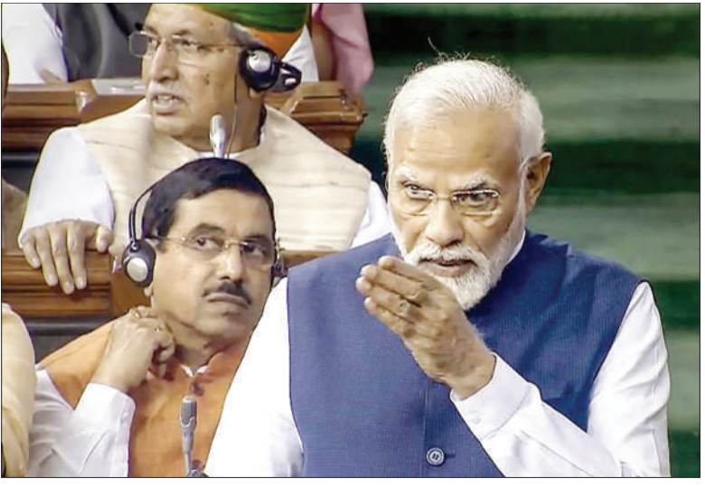
ਦੱਸਿਆ। ਪ੍ਰਧਾਨ ਮੰਤਰੀ ਨੇ ਦਾਅਵਾ ਕੀਤਾ ਕਿ ਚੋਸ਼ ਦੇ ਲੋਕ ਉਨ੍ਹਾਂ ਦੇ ਨਾਲ ਹਨ। ਉਨ੍ਹਾਂ ਦੀ ਸਰਕਾਰ ਨੇ ਦੁਨੀਆ ਵਿਚ ਚੋਸ਼ ਦਾ ਵਕਾਰ ਵਧਾਇਆ ਹੈ, ਪਰ ਕੁਝ ਲੋਕ ਇਸ ਦੀ ਸਾਖ ਪਰਾਥ ਕਰ ਰਹੇ ਹਨ। ਦੁਨੀਆ ਵਿਚ ਭਾਰਤ ਦੀ ਵਿਸ਼ਵਾਸ ਵਧ ਰਿਹਾ ਹੈ। ਉਨ੍ਹਾਂ ਕਿਹਾ ਕਿ ਉਨ੍ਹਾਂ ਨੌਜਵਾਨਾਂ ਨੂੰ

ਨਵੀਂ ਦਿੱਲੀ : ਪ੍ਰਧਾਨ ਮੰਤਰੀ ਨਰਿੰਦਰ ਮੋਦੀ ਨੇ ਆਪੋਜ਼ੀਸ਼ਨ ਵੱਲੋਂ ਮਨੀਪੁਰ ਨੂੰ ਪ੍ਰਮੁੱਖ ਮੁੱਦੇ ਵਜੋਂ ਉਭਾਰਦਿਆਂ ਲਿਆਂਦੇ ਗਏ ਬੇਵਿਸ਼ਵਾਸੀ ਮਤੇ 'ਤੇ ਤਿੰਨ ਦਿਨ ਚੱਲੀ ਬਹਿਸ ਦਾ ਵੀਰਵਾਰ ਲੋਕ ਸਭਾ 'ਚ ਜਵਾਬ ਦਿੰਦਿਆਂ ਦੇ ਘੰਟੇ 12 ਮਿੰਟ ਦੇ ਭਾਸ਼ਣ 'ਚ ਬਹੁਤ ਸਮਾਂ ਆਪਣੀ ਸਰਕਾਰ ਦੇ ਗੁਣਗੁਣ 'ਚ ਲੱਘਾਇਆ। ਮਨੀਪੁਰ ਬਾਰੇ ਸਿਰਫ਼ ਏਨਾ ਹੀ ਕਿਹਾ—ਗੁਰਿ ਮੰਤਰੀ ਅਮਿਤ ਸ਼ਾਹ ਨੇ ਪਹਿਲਾਂ ਹੀ ਲੋਕ ਸਭਾ ਵਿਚ ਮਨੀਪੁਰ ਦੀ ਸਥਿਤੀ ਬਾਰੇ ਵਿਸਥਾਰ ਨਾਲ ਗੱਲਾਂ ਕੀਤੀਆਂ ਹਨ। ਮੈਂ ਮਨੀਪੁਰ ਦੇ ਲੋਕਾਂ ਨੂੰ ਯਕੀਨ ਦਿਵਾਉਂਦਾ ਹਾਂ ਕਿ ਉਨ੍ਹਾਂ ਦਾ ਸੁਭਾ ਫਿਰ ਵਿਕਾਸ ਦੇ ਰਾਹ 'ਤੇ ਪਰਤੋਂਗਾ। ਉੱਤਰ-ਪੂਰਬ ਉਨ੍ਹਾਂ ਦੇ ਜਿਹਾਦ ਟੁਕੜਾ ਹੈ। ਮਹਿਲਾਵਾਂ ਨਾਲ ਅਪਰਾਧ ਕਰਨ ਵਾਲਿਆਂ ਨੂੰ ਸਜ਼ਾ ਦੇਣ ਲਈ ਕੇਂਦਰ ਤੋਂ ਰਾਜ ਮਿਲ ਕੇ ਯਤਨ ਕਰ ਰਹੇ ਹਨ। ਚੋਸ਼ ਤੇ ਸਦਨ ਮਨੀਪੁਰ ਦੀਆਂ ਬੇਟੀਆਂ-ਮਾਂਵਾਂ-ਭੈਣਾਂ ਦੇ ਨਾਲ ਹੈ। ਉਨ੍ਹਾਂ ਦਾਅਵਾ ਕੀਤਾ ਕਿ 2018 ਵਿਚ ਲਿਆਂਦੇ ਗਏ ਬੇਵਿਸ਼ਵਾਸੀ ਮਤੇ ਤੋਂ ਬਾਅਦ ਉਹ 2019 ਵਿਚ ਦੂਜੀ ਵਾਰ ਵਧੇਰੇ ਸੀਟਾਂ ਜਿੱਤ ਕੇ ਸੱਤਾ 'ਚ ਆਏ ਸਨ ਤੇ ਤੀਜੀ ਵਾਰ ਵੀ 'ਰੱਬ ਦਾ ਆਸ਼ੀਰਵਾਦ' ਉਨ੍ਹਾਂ ਨੂੰ ਹੀ ਮਿਲੇਗਾ। ਉਨ੍ਹਾਂ ਬੇਵਿਸ਼ਵਾਸੀ ਮਤੇ ਨੂੰ ਆਪਣੇ ਲਈ ਲੱਕੀ