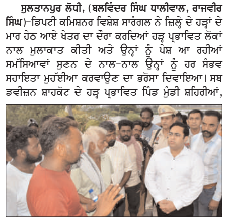
ਮੁੰਡੀ ਚੋਲੀਆਂ ਸਮੇਤ ਹੋਰਨਾਂ ਪਿੰਡਾਂ ਦੇ ਦੋਹੇ ਦਰਾਨ ਡਿਪਟੀ ਕਮਿਸ਼ਨਰ ਨੇ ਪ੍ਰਭਾਵਤ ਲੋਕਾਂ ਨਾਲ ਗੱਲਬਾਤ ਕੀਤੀ ਅਤੇ ਉਨ੍ਹਾਂ ਨੂੰ ਪ੍ਰਭਾਵਨ ਵੱਲੋਂ ਰਾਸ਼ਨ, ਤਰਪਾਲ ਸਮੇਤ ਮੁਹੱਈਆ ਕਰਵਾਈਆਂ ਜਾ ਰਹੀਆਂ ਹੋਰ ਸਹੂਲਤਾਂ ਬਾਰੇ ਉਨ੍ਹਾਂ ਦੀ ਪ੍ਰਤੀਕਿਰਿਆ ਹਾਸਲ ਕੀਤੀ। ਉਨ੍ਹਾਂ ਕਿਹਾ ਕਿ ਇਸ ਮੁਸ਼ਕਲ ਦੀ ਘਣੀ ਵਿੱਚ ਪੰਜਾਬ ਸਰਕਾਰ ਅਤੇ ਪ੍ਰਧਾਨ ਮੰਤਰੀ ਦੇ ਨਾਲ ਖੁਸ਼ੀ ਹੈ ਅਤੇ ਉਨ੍ਹਾਂ ਨੂੰ ਹਰ ਸੰਭਵ ਸਹਾਇਤਾ ਮੁਹੱਈਆ ਕਰਵਾਈ ਜਾਵੇਗੀ। ਇਸ ਤੋਂ ਇਲਾਵਾ ਮੁੰਡੀ ਸਹਿਰੀਆਂ ਪਿੰਡ ਦੇ ਵਾਸੀਆਂ ਵੱਲੋਂ ਗੀਤੀ ਕਿਸ਼ਤੀ ਮੰਗ ਪੂਰੀ ਕਰਨ ਦੇ ਵੀ ਐੱਸ ਡੀ ਐਮ ਸਾਹਕੇਟ ਸਿਸ਼ ਖਾਸਲ ਨੂੰ ਨਿਰਦੇਸ਼ ਦਿੱਤੇ।