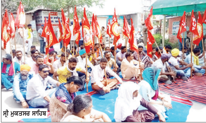
ਸ਼੍ਰੀ ਮੁਕਤਸਰ ਸਾਹਿਬ

ਮੁੱਖ ਮੰਤਰੀ ਤੇ ਕੈਬਨਿਟ ਸਬ-ਕਮੇਟੀ ਨੂੰ ਭੇਜੇ ਮੰਗ ਪੱਤਰ 4 ਨੂੰ ਵਿੱਤ ਮੰਤਰੀ ਦੀ ਰਿਹਾਇਸ਼ ਅੱਗੇ ਸੂਬਾ ਪੱਧਰੀ ਧਰਨਾ