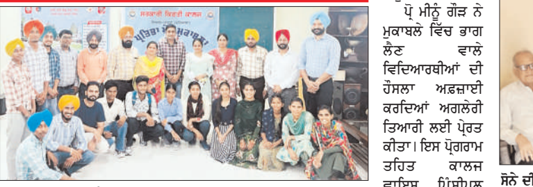
ਸਮਾਗਮ ਵਿੱਚ ਭਾਗ ਲੈਣ ਵਾਲੇ ਵਿਦਿਆਰਥੀ ਕਾਲਜ ਸਟਾਫ ਨਾਲ।

■ ਖੇਤਰੀ ਖੁਫ ਮੇਲੇ ਲਈ ਹੁਨਰਮੰਦ ਵਿਦਿਆਰਥੀਆਂ ਦੀ ਚੋਣ