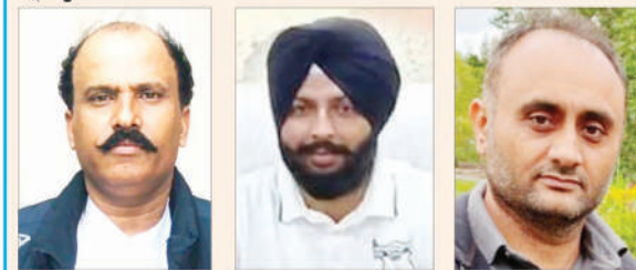
ਜਸਵੀਰ ਕੁਮਾਰ ਦਾਰਾ

ਸ੍ਰੀ ਗੁਰੂ ਨਾਨਕ ਦੇਵ ਜੀ ਅਤੇ ਮਾਤਾ ਸੁਲੱਖਣੀ ਜੀ ਦੇ ਵਿਆਹ ਪੁਰਬ ਦੀਆਂ ਲੱਖ-ਲੱਖ ਵਧਾਈਆਂ