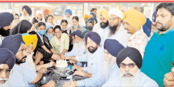
ਵਿਦਿਆਰਥੀਆਂ ਮੰਗਾਂ ਮੰਨਣ ਦੀ ਖੁਸ਼ੀ 'ਚ ਕੋਕ ਕੋਟ ਦੇ ਵਿਦਿਆਰਥੀ ਇਨਸਾਫ ਸਾਥਾ ਮੋਰਚੇ ਦੇ ਆਗੂਆਂ ਨਾਲ ਖੁਸ਼ੀ ਸਾਂਝੀ ਕਰਨ ਸਮੇਂ।