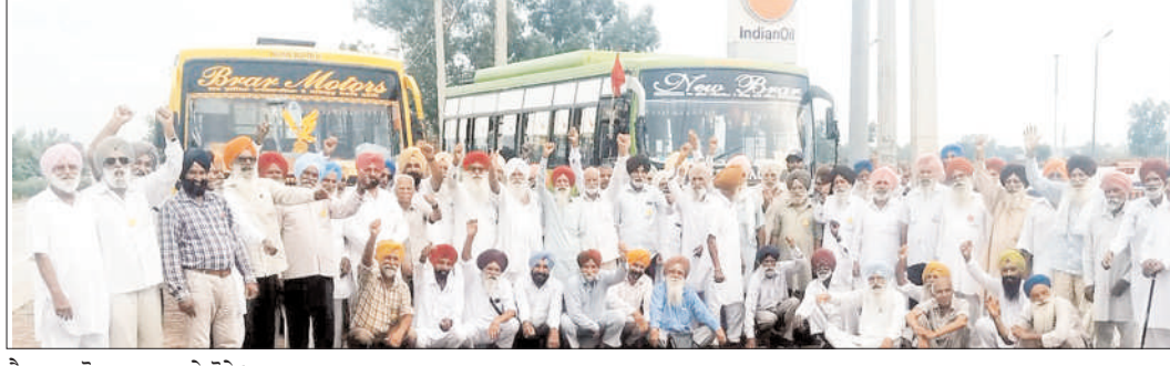
ਪੈਨਸ਼ਨਰ ਰੋਸ ਪ੍ਰਗਟ ਕਰਦੇ ਹੋਏ।

ਮੋਗਾ (ਅਮਰਜੀਤ ਬੱਬਰੀ)-ਪੰਜਾਬ ਗੋਰਮਿਟ ਪੈਨਸ਼ਨਰ ਐਸੋਸੀਏਸ਼ਨ ਪੰਜਾਬ ਦੀ ਜ਼ਿਲ੍ਹਾ ਇਕਾਈ ਮੋਗਾ ਨੇ ਇੱਕ ਪ੍ਰੈੱਸ ਬਿਆਨ ਨਹੀਂ ਕਰਦਿਆਂ ਦੱਸਿਆ ਕਿ ਪੰਜਾਬ ਦੇ ਪੈਨਸ਼ਨਰਾਂ ਦਾ ਜੁਲਾਈ 15 ਤੋਂ ਦਸੰਬਰ 15 ਤੱਕ ਦਾ ਛੇ ਮਹੀਨੇ ਦਾ ਬਕਾਇਆ ਬਹੁਤ ਸਾਰੀਆਂ ਬੈਂਕ ਬਰਾਂਚ ਪੰਜਾਬ ਨੈਸ਼ਨਲ ਬੈਂਕ ਬਰਾਂਚ ਬਾਘ ਪੁਰਾਣਾ ਤੋਂ ਪੰਜਾਬ ਐੱਚ ਐੱਚ ਬੈਂਕ ਸ਼ਾਮਲਸ ਤੇ ਚੱਕਿੰਗ ਆਦਿ ਬੈਂਕ ਆਫ ਇੰਡੀਆ ਬਰਾਂਚ ਮਿਨੀ ਸੈਕਟਰੀਏਟ ਮੋਗਾ ਆਦਿ ਨੇ ਅਜੇ ਤੱਕ ਨਹੀਂ ਪਾਇਆ, ਜਦੋਂਕਿ ਪੰਜਾਬ ਸਰਕਾਰ ਵੱਲੋਂ ਹਾਈ ਕੋਰਟ ਦੇ ਫੈਸਲੇ ਨੂੰ ਜਨਰਲਾਈਜ਼ ਕਰਦਿਆਂ ਸਾਰੇ ਪੈਨਸ਼ਨਰਾਂ ਨੂੰ ਇਹ ਬਕਾਇਆ ਦੇਣ ਲਈ ਅੱਜ ਤੋਂ ਤਿੰਨ ਮਹੀਨੇ ਪਹਿਲਾਂ ਗਾਰੰਟੀ ਜਾਰੀ ਕਰਕੇ ਸਾਰੇ ਬੈਂਕਾਂ ਦੇ ਪੈਨਸ਼ਨ ਪ੍ਰੋਸੈਸਿੰਗ ਕੇਂਦਰਾਂ ਤੇ ਸਾਰੇ ਮਹਿਕਮਿਆਂ ਦੇ ਪ੍ਰਿੰਟਿੰਗ ਨੂੰ ਪੱਤਰ ਜਾਰੀ ਕਰ ਦਿੱਤਾ ਸੀ। ਜਿਥੇਥੀ ਨੇ ਬੈਂਕ ਅਧਿਕਾਰੀਆਂ ਨੂੰ ਅਪੀਲ ਕਰਦੇ ਹੋਏ