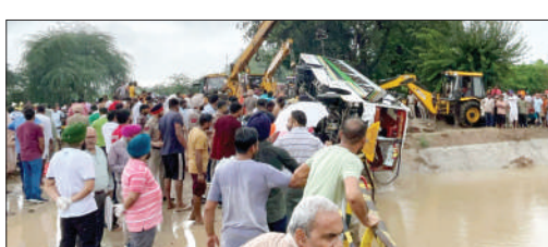
ਸ਼੍ਰੀ ਮੁਕਤਸਰ ਸਾਹਿਬ (ਸ਼ਮਿਦਰਪਾਲ, ਪੁਜਾ) ਮੁਕਤਸਰ-ਕੋਟਕਪੂਰਾ ਰੋਡ 'ਤੇ ਪਿੰਡ ਝਬੋਲਵਾਲੀ ਨੇੜਿਓਂ ਲੰਘਦੀਆਂ ਜੁੜਵਾਂ ਨਹਿਰਾਂ 'ਚੋਂ ਸਰਹਿਦ ਨਹਿਰ ਵਿੱਚ ਸਵਾਰੀਆਂ ਨਾਲ ਭਰੀ ਨਿਊ ਦੀਪ ਕੋਪਨੀ ਦੀ ਬੱਸ ਡਿੱਗ ਗਈ। ਬੱਸ 'ਚ ਸਵਾਰ ਕਰੀਬ 45 ਸਵਾਰੀਆਂ 'ਚੋਂ 8 ਦੀ ਮੌਤ ਦੱਸੀ ਜਾ ਰਹੀ ਹੈ, ਜਦਕਿ ਪ੍ਰਥਮ ਦੌਲੇ ਪੰਜ

ਲੋਕਾਂ ਦੀ ਪੁਸ਼ਟੀ ਕੀਤੀ ਗਈ, ਜਿਨ੍ਹਾਂ 'ਚ 3 ਪੁਰਸ਼ ਅਤੇ 2 ਔਰਤਾਂ ਹਨ। ਇਸ ਤੋਂ ਇਲਾਵਾ 10 ਲੋਕ ਜ਼ਖਮੀ ਹੋ ਗਏ, ਜਿਨ੍ਹਾਂ ਨੂੰ ਇਲਾਜ ਲਈ ਸਿਵਲ ਹਸਪਤਾਲ ਲਿਆਂਦਾ ਗਿਆ, ਜਿੱਥੋਂ ਦੋ ਲੋਕ ਘਰ ਚਲੇ ਗਏ, ਜਦਕਿ 8 ਲੋਕ ਜ਼ੋਰੇ ਇਲਾਜ ਹਨ। ਨਿਊ ਦੀਪ ਕੋਪਨੀ ਦੀ ਬੱਸ ਨੰਬਰ ਪੀ ਬੀ 04 ਏ 0878 ਮੁਕਤਸਰ ਤੋਂ ਅੰਮ੍ਰਿਤਸਰ ਵੱਲ ਜਾ ਰਹੀ ਸੀ ਕਿ ਪਿੰਡ ਝਬੋਲਵਾਲੀ ਜੁੜਵੀਆਂ ਨਹਿਰਾਂ ਕੋਲ ਪੁਲ ਨੂੰ ਕਰਾਸ ਕਰਨ ਸਮੇਂ ਬੱਸ ਨਹਿਰ ਦੇ ਪੁਲ 'ਤੇ ਲੱਗੇ ਹੋਏ ਦੋ ਔਰਤਾਂ ਵਿੱਚ ਵੱਜਣ ਦੇ ਚਲਦਿਆਂ ਨਹਿਰ 'ਚ ਡਿੱਗ ਗਈ। ਬੱਸ ਦਾ ਔਠਾ ਹਿੱਸਾ ਨਹਿਰ 'ਚ ਜਾ ਲਟਕਿਆ, ਜਦਕਿ ਔਠਾ ਹਿੱਸਾ ਬਾਹਰ ਪੁਲ ਉੱਪਰ ਰਹਿ ਗਿਆ। ਲੋਕਾਂ ਨੂੰ ਇਸ