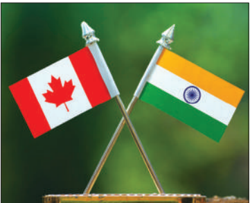
ਕੈਨੇਡੀਆ ਸੂਬੇ ਦੇ ਸਰੀ 'ਚ ਗੁਰਦੁਆਰੇ ਦੇ ਬਾਹਰ ਦੋ ਅਣਪਛਾਤੇ ਹਮਲਾਵਰਾਂ ਨੇ ਗੋਲੀ ਮਾਰ ਕੇ ਹੱਤਿਆ ਕਰ ਦਿੱਤੀ ਸੀ। ਟਰੂਡੋ ਨੇ ਸੰਸਦ ਦੇ ਹੇਠਲੇ ਸਦਨ ਹਾਊਸ ਆਫ ਕਾਮਨਜ਼ 'ਚ ਆਪਣੇ ਸੰਬੋਧਨ 'ਚ