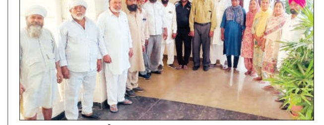
ਪੰਜਾਬ ਤੋਂ ਪਟਨਾ ਪਹੁੰਚੇ ਭੋਲੀਗੋਰ।

ਪਟਨਾ (ਗਿਆਨ ਸੋਦਪੁਰੀ) ਭਾਰਤੀ ਖੇਤ ਮਜ਼ਦੂਰ ਯੂਨੀਅਨ ਦੀ 15ਵੀਂ ਕੌਮੀ ਕਾਨਫਰੰਸ ਇੱਥੇ ਦੇ ਨਵੰਬਰ ਤੋਂ ਸ਼ੁਰੂ ਹੋ ਕੇ 5 ਨਵੰਬਰ ਤੱਕ ਚੱਲੇਗੀ। ਇਸ ਚਾਰ ਰੋਜ਼ਾ ਕੌਮੀ ਸੰਮੇਲਨ ਦੀ ਸ਼ੁਰੂਆਤ ਇੱਥੇ ਦੇ ਗਾਂਧੀ ਮੈਦਾਨ ਵਿੱਚ ‘ਭਾਜਪਾ’ ਹਟਾਏ ਦੇਸ਼ ਬਚਾਏ’ ਦਾ ਹੱਕਾ ਦਿੰਦੀ ਮਹਾਂ ਰੈਲੀ