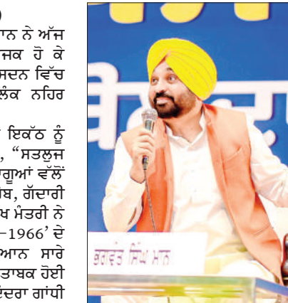
ਤਰਜੀਹ ਦਿੱਤੀ। ਉਨ੍ਹਾਂ ਕਿਹਾ ਕਿ ਪੰਜਾਬ ਦੇ ਪਾਣੀਆਂ ਦੀ ਵੰਡ ਬਾਰੇ 31 ਦਸੰਬਰ, 1981 ਨੂੰ ਉਦੋਂ ਦੇ ਮੁੱਖ ਮੰਤਰੀ ਦਰਬਾਰ ਸਿੰਘ, ਹਰਿਆਣਾ ਦੇ ਮੁੱਖ ਮੰਤਰੀ ਤੇ ਰਾਜਸਥਾਨ ਦੇ ਮੁੱਖ ਮੰਤਰੀ ਵਿਚਾਲੇ ਸ਼੍ਰੀਮਤੀ ਇੰਦਰਾ ਗਾਂਧੀ ਦੀ ਹਾਜ਼ਰੀ ਵਿੱਚ ਸਮਝੌਤਾ ਹੋਇਆ ਸੀ ਕਿਉਂਕਿ ਉਸ ਸਮੇਂ ਕੇਂਦਰ ਤੋਂ ਇਨ੍ਹਾਂ ਤਿੰਨਾਂ ਸੂਬਿਆਂ ਵਿੱਚ ਕਾਂਗਰਸ ਦੀਆਂ ਸਰਕਾਰਾਂ ਸਨ। ਭਗਵੰਤ ਸਿੰਘ ਮਾਨ ਨੇ ਕਿਹਾ ਕਿ ਉਸ ਸਮੇਂ ਦੇ ਕਾਂਗਰਸ ਦੇ ਮੁੱਖ ਮੰਤਰੀ ਨੇ ਕੇਂਦਰ ਸਰਕਾਰ ਦੇ ਨਾਜਾਇਜ਼ ਆਦੇਸ਼ ਉੱਤੇ ਪੰਜਾਬ ਦੇ ਹਿੱਤਾਂ ਨੂੰ ਨਜ਼ਰਅੰਦਾਜ਼ ਕੀਤਾ। ਭਗਵੰਤ ਸਿੰਘ ਮਾਨ ਨੇ ਕਿਹਾ ਕਿ ਇਸ ਪ੍ਰਾਜੈਕਟ ਲਈ ਜਮੀਨ ਐਕੁਆਇਰ ਕਰਕੇ ਐਸ.ਵਾਈ.ਐਲ. ਦੀ ਉਸਾਰੀ ਦਾ ਮੁੱਢ ਬੰਨ੍ਹਣ ਦਾ ਸਿਹਰਾ ਪ੍ਰਕਾਸ਼ ਸਿੰਘ ਬਾਦਲ ਨੂੰ ਜਾਂਦਾ ਹੈ ਜਦੋਂ ਕਿ ਅਕਾਲੀ ਮੁੱਖ ਮੰਤਰੀ ਸੁਰਜੀਤ ਸਿੰਘ ਬਰਨਾਲਾ ਨੇ ਨਹਿਰ ਦੀ ਉਸਾਰੀ ਦਾ ਕੰਮ ਮੁਕੰਮਲ ਕਰਵਾਇਆ। ਮੁੱਖ ਮੰਤਰੀ ਨੇ ਕਿਹਾ ਕਿ ਸੂਬਾ ਸਰਕਾਰ ਨੇ ਪੰਜਾਬ ਕੋਲ ਪਾਣੀ ਦੀ ਘੱਟ ਉਪਲਬਧਤਾ ਦੇ ਮੁੱਦੇ ਨੂੰ ਜ਼ੋਰਦਾਰ ਢੰਗ ਨਾਲ ਪੇਸ਼ ਕੀਤਾ ਹੈ ਅਤੇ ਇਹ ਸੁਧਾਰੀ ਕਰਦੇ ਹੋਏ ਫੈਸਲੇ ਵਿੱਚ ਵੀ ਦਰਜ ਹੈ। ਉਨ੍ਹਾਂ ਕਿਹਾ ਕਿ ਅਕਾਲੀ ਦਲ ਪਿਛਲੇ 30 ਸਾਲਾਂ ਤੋਂ ਪੰਜਾਬ ਦੇ ਲੋਕਾਂ ਦੀਆਂ ਭਾਵਨਾਵਾਂ ਨਾਲ ਖੋਬ ਰਿਹਾ ਹੈ ਅਤੇ ਹੁਣ ਵੀ ਇਸ ਮੁੱਦੇ ‘ਤੇ ਲੋਕਾਂ ਨੂੰ ਗੁਮਰਾਹ ਵੀ ਕਰ ਰਿਹਾ ਹੈ। ਭਗਵੰਤ ਸਿੰਘ ਮਾਨ ਨੇ ਕਿਹਾ ਕਿ ਮੌਜੂਦਾ ਸੂਬਾ ਸਰਕਾਰ ਦੇ ਵਕੀਲਾਂ ਨੇ ਨਹਿਰ ਮੁਕੰਮਲ ਹੋਣ ਸਬੰਧੀ ਕਿਤੇ ਵੀ ਕੋਈ ਜ਼ਿਕਰ ਨਹੀਂ ਕੀਤਾ।

ਮੁੱਖ ਮੰਤਰੀ ਨੇ ਅੱਗੇ ਕਿਹਾ ਕਿ ਸਾਲ 1977 ਵਿੱਚ ਸੱਤਾ ਸੰਭਾਲਣ ਤੋਂ ਬਾਅਦ ਪ੍ਰਕਾਸ਼ ਸਿੰਘ ਬਾਦਲ ਨੇ ਹਰਿਆਣਾ ਨੂੰ ਐਸ.ਵਾਈ.ਐਲ. ਰਾਹੀਂ ਪਾਣੀ ਦੇਣ ਦੇ ਕੰਮ ਨੂੰ ਇਕ ਵਾਰ ਵੀ ਨਹੀਂ ਰੋਕਿਆ। ਮੁੱਖ ਮੰਤਰੀ ਨੇ ਕਿਹਾ ਕਿ ਇਹ ਕਹਾਣੀ ਇੱਥੇ ਹੀ ਖਤਮ ਨਹੀਂ ਹੋਈ ਕਿਉਂਕਿ ਸਾਲ 1998 ਵਿੱਚ ਸਦਾਂ ਪ੍ਰਕਾਸ਼ ਸਿੰਘ ਬਾਦਲ ਇਕ ਵਾਰ ਫੇਰ ਮੁੱਖ ਮੰਤਰੀ ਬਣੇ ਤਾਂ ਉਨ੍ਹਾਂ ਨੇ ਭਾਖੜਾ ਮੈਨ ਲਾਈਨ ਦੇ ਕਿਨਾਰਿਆਂ ਨੂੰ ਲਗਾਪਗ ਇਕ ਫੁੱਟ ਉੱਚਾ ਕਰ ਦਿੱਤਾ ਤਾਂ ਕਿ ਹਰਿਆਣਾ ਨੂੰ ਹੋਰ ਪਾਣੀ ਦਿੱਤਾ ਜਾ ਸਕੇ ਅਤੇ ਇਸ ਮੰਤਵ ਲਈ ਹਰਿਆਣਾ ਪਾਸੋਂ 45 ਕਰੋੜ ਰੁਪਏ ਵੀ ਹਾਸਲ ਕੀਤੇ। ਮੁੱਖ ਮੰਤਰੀ ਨੇ ਕਿਹਾ ਕਿ ਇਹ ਇਸ ਗੱਲ ਤੋਂ ਸਪੱਸ਼ਟ ਹੈ ਕਿ ਅਕਾਲੀ ਸਰਕਾਰ ਨੇ ਪੰਜਾਬ ਦੇ ਲੋਕਾਂ ਦੇ ਹਿੱਤਾਂ ਨਾਲ ਧੁੱਕ ਕਮਾ ਕੇ ਲੋਕਾਂ ਨਾਲ ਆਪਣੇ ਨਿੱਜੀ ਹਿੱਤਾਂ ਨੂੰ