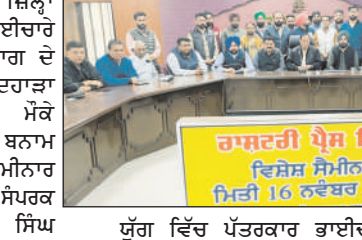
ਯੁੱਗ ਵਿੱਚ ਪੱਤਰਕਾਰ ਭਾਈਚਾਰੇ ਨੂੰ ਆਪ