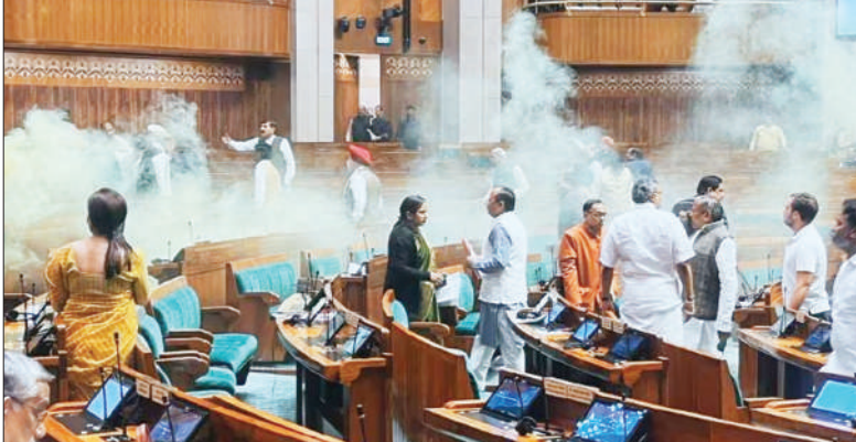
ਪੀਲੇ ਰੰਗ ਦੀ ਗੈਸ ਛੱਡੇ ਜਾਣ ਦੇਰਾਨ ਲੋਕ ਸਭਾ ਦੇ ਮੈਂਬਰ ਨੌਜਵਾਨਾਂ ਵੱਲ ਦੇਖਦੇ ਹੋਏ।

ਅੰਦਰ ਤੇ ਬਾਹਰ ਤਾਨਾਸ਼ਾਹੀ ਖਿਲਾਫ ਨਾਅਰੇ ਲਾਉਣ ਵਾਲੀ ਮਹਿਲਾ ਸਣੇ ਚਾਰ ਗ੍ਰਿਫਤਾਰ