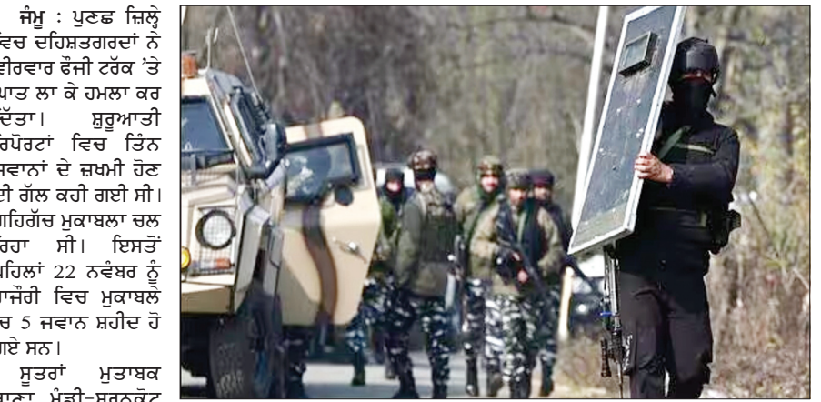
ਜੰਮੂ : ਪੁਲਿਸ ਜ਼ਿਲ੍ਹੇ ਵਿਚ ਦਹਿਸ਼ਤਗਰਦਾਨਾਂ ਨੇ ਵੀਰਵਾਰ ਫੋਜੀ ਟਰੱਕ 'ਤੇ ਘਾਤ ਲਾ ਕੇ ਹਮਲਾ ਕਰ ਦਿੱਤਾ। ਸ਼ੁਰੂਆਤੀ ਰਿਪੋਰਟਾਂ ਵਿਚ ਤਿੰਨ ਜਵਾਨਾਂ ਦੇ ਜ਼ਖਮੀ ਹੋਣ ਦੀ ਗੱਲ ਕਹੀ ਗਈ ਸੀ। ਗਹਿਰਾਓਂ ਮੁਕਾਬਲਾ ਚਲ ਰਿਹਾ ਸੀ। ਇਸ ਤੋਂ ਪਹਿਲਾਂ 22 ਨਵੰਬਰ ਨੂੰ ਰਾਜੌਰੀ ਵਿਚ ਮੁਕਾਬਲੇ 'ਚ 5 ਜਵਾਨ ਸ਼ਹੀਦ ਹੋ ਗਏ ਸਨ।

ਉਨ੍ਹਾਂ ਦਾ ਵਿਰੋਧ ਬੇਕਾਰ ਹੋ ਗਿਆ ਹੈ। ਇਨ੍ਹਾਂ ਨੇ ਮਹਿਲਾ ਭਲਵਾਨਾਂ ਦੇ ਜਿਸੇ ਸ਼ੇਸ਼ ਨੂੰ ਲੈ ਕੇ ਬ੍ਰਿਜ ਭੂਸ਼ਣ ਵਿਰੁੱਧ ਵੱਡਾ ਅੰਦੋਲਨ ਚਲਾਇਆ ਸੀ ਤੇ ਕੁਸ਼ਤੀ ਫੈਡਰੇਸ਼ਨ ਨੂੰ ਸਾਥ ਕਰਨ ਲਈ ਲੜਾਈ ਲੜੀ ਸੀ। ਨਤੀਜਿਆਂ ਦੇ ਐਲਾਨ ਤੋਂ ਬਾਅਦ ਉਲੰਪਿਕ 'ਚ ਕਾਂਸੀ ਤਮਗਾ ਜਿੱਤਣ ਵਾਲੀ ਸਾਕਸ਼ੀ ਮਲਿਕ ਨੇ ਕੁਸ਼ਤੀ ਤੋਂ ਸੰਨਿਆਸ ਲੈਣ ਦਾ ਐਲਾਨ ਕਰਦਿਆਂ ਕਿਹਾ ਕਿ ਉਹ ਬ੍ਰਿਜ ਭੂਸ਼ਣ ਦੇ ਵਿਭਾਗਸ਼ਾਸਤਰ ਦੀ ਅਗਵਾਈ 'ਚ ਨਹੀਂ ਖੇਡੇਗੀ। ਪ੍ਰੈੱਸ ਕਾਨਫਰੰਸ 'ਚ ਸਾਕਸ਼ੀ ਨੇ ਫਿਰ ਚੁੱਕ ਕੇ ਚਲੇ ਗਏ। ਸਾਕਸ਼ੀ ਨੇ ਕਿਹਾ—ਅਸੀਂ ਬ੍ਰਿਜ ਭੂਸ਼ਣ ਵਿਰੁੱਧ ਕਾਢੀ ਹੋਮਲੇ ਨਾਲ ਲੜਾਈ ਲੜੀ, ਪਰ ਅੱਜ ਉਸ ਦੀ ਸੱਜੀ ਬਾਂਹ ਪ੍ਰਧਾਨ ਚੁਣੀ ਗਈ। ਅਸੀਂ ਮਹਿਲਾ ਪ੍ਰਧਾਨ ਚਾਹੁੰਦੇ ਸਾਂ, ਪਰ ਕਾਮਯਾਬ ਨਹੀਂ ਹੋਏ। ਵਿਨੋਬ ਫੋਗਟ ਨੇ ਕਿਹਾ ਕਿ ਬਦਕਿਸਮਤੀ ਦੀ ਗੱਲ ਹੈ ਕਿ ਦੇਸ਼ ਵਿਚ ਅਜਿਹੇ ਅਹੁਦਿਆਂ 'ਤੇ ਅਜਿਹੇ ਲੋਕ ਚੁਣੇ ਜਾ ਰਹੇ ਹਨ। ਹੁਣ ਕੁਸ਼ਤੀ ਨੂੰ ਵੀ ਸ਼ੇਸ਼ ਦਾ ਸ਼ਿਕਾਰ ਹੋਣਾ ਪਵੇਗਾ। ਅਫਸੋਸ ਦੀ ਗੱਲ ਹੈ ਕਿ ਲੜਾਈ ਦੇ ਬਾਵਜੂਦ ਅਸੀਂ ਤਬਦੀਲੀ ਨਹੀਂ ਲਿਆ ਸਕੇ। ਮੈਨੂੰ ਪਤਾ ਨਹੀਂ ਕਿ ਆਪਣੇ ਦੇਸ਼ ਵਿਚ ਇਨਸਾਫ ਕਿਵੇਂ ਹਾਸਲ ਕੀਤਾ ਜਾ ਸਕਦਾ ਹੈ। ਇਸ ਮੌਕੇ ਬਜਰੰਗ ਪੁਨੀਆ ਨੇ ਕਿਹਾ ਕਿ ਇਹ ਮੁੱਦਾ ਗੱਲ ਹੈ ਕਿ ਸਰਕਾਰ ਆਪਣੇ ਸਟੇਟ 'ਤੇ ਕਾਇਮ ਨਹੀਂ ਰਹੀ ਕਿ ਬ੍ਰਿਜ ਭੂਸ਼ਣ ਦਾ ਕੋਈ ਵੀ ਵਫ਼ਾਦਾਰ ਚੋਣ ਨਹੀਂ ਲਏਗਾ।