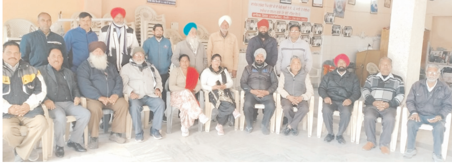
ਬਹਿਰਾਮ