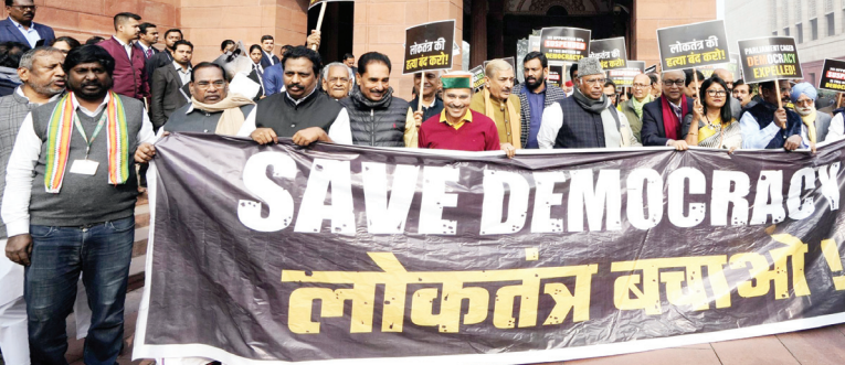
ਨਵੀਂ ਦਿੱਲੀ : ਸੰਸਦ ਮੈਂਬਰਾਂ ਦੀ ਮੁਅੱਤਲੀ ਦੇ ਵਿਰੋਧ 'ਚ ਵਿਰੋਧੀ ਪਿਠ ਦੇ ਸੰਸਦ ਮੈਂਬਰਾਂ ਨੇ ਵੀਰਵਾਰ ਸੰਸਦ ਭਵਨ ਤੋਂ ਵਿਜੇ ਚੌਕ ਤੱਕ ਰੋਸ ਮਾਰਚ ਕੀਤਾ। ਇਸ ਮੌਕੇ ਕਾਂਗਰਸ ਪ੍ਰਧਾਨ ਮਲਕਾਰਜੁਨ ਖੜਗੇ ਨੇ ਕਿਹਾ ਕਿ ਸਰਕਾਰ ਨਹੀਂ

ਚਿੰਮੇਵਾਰ ਹੈ। ਉਨ੍ਹਾਂ ਕਿਹਾ ਕਿ ਪ੍ਰਧਾਨ ਮੰਤਰੀ ਨਰਿੰਦਰ ਮੋਦੀ ਅਤੇ ਗ੍ਰਹਿ ਮੰਤਰੀ ਅਮਿਤ ਸ਼ਾਹ ਨੂੰ ਸੁਰੱਖਿਆ 'ਚ ਕੁਝਾਹੀ ਬਾਰੇ ਸਦਨ 'ਚ ਬੋਲਣਾ ਚਾਹੀਦਾ ਸੀ। ਪ੍ਰਧਾਨ ਮੰਤਰੀ ਕਿਤੇ ਹੋਰ ਬੋਲੇ, ਪਰ ਲੋਕ ਸਭਾ 'ਤੇ ਰਾਜ ਸਭਾ 'ਚ ਨਹੀਂ ਆਏ।