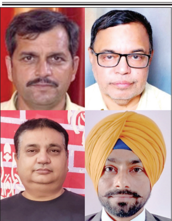
ਦੇ 4 ਅਕਤੂਬਰ 2023 ਨੂੰ ਜਾਰੀ ਕੀਤੇ ਗਏ ਅੰਤਿਮ ਹੁਕਮਾਂ ਉਪਰੰਤ ਹੀ ਨਵੀਂ ਨੌਕਰੀ ਨਸੀਬ ਹੋਈ ਸੀ। ਬੀਤੇ 13 ਅਕਤੂਬਰ 2023 ਨੂੰ ਡਾਇਰੈਕਟਰ ਸਕੂਲ ਸਿੱਖਿਆ ਸੈਕਟਰ ਪੰਜਾਬ ਦੇ ਹੁਕਮਾਂ ਰਾਹੀਂ ਸਬੰਧਤ