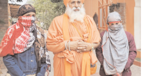
ਜਾਣਕਾਰੀ ਦਿੰਦੇ ਹੋਏ ਸੰਤ ਸੀਚੇਵਾਲ