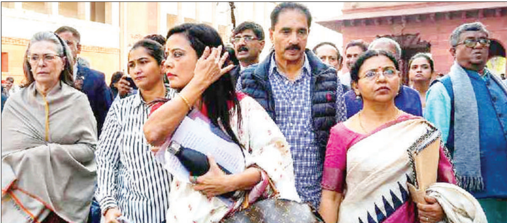
ਇਕੱਠ 'ਚ ਮੁਜ਼ਾਹਰਾ ਕਰਦਿਆਂ ਸੋਨੀਆ ਗਾਂਧੀ ਤੇ ਹੋਰ ਮੈਂਬਰ ਮਹੂਆ ਮੰਤਿਰੀ ਦੇ ਨਾਲ ਸਦਨ ਵਿੱਚੋਂ ਬਾਹਰ ਨਿਕਲੇ।

ਨਵੀਂ ਦਿੱਲੀ : ਸਰਕਾਰ ਖਿਲਾਫ ਖੁੱਲ੍ਹ ਕੇ ਬੋਲਣ ਵਾਲੀ ਟੀ ਐੱਮ ਸੀ ਦੀ ਸਾਂਸਦ ਮਹੂਆ ਮੰਤਿਰੀ ਨੂੰ ਪੰਜੇ ਲੈ ਕੇ ਸਵਾਲ ਪੁੱਛਣ ਦੇ ਦੋਸ਼ ਵਿਚ ਸ਼ੁੱਕਰਵਾਰ ਅਪੰਜੀਸ਼ਨ ਮੈਂਬਰਾਂ ਦੇ ਵਾਕਾਅਉਟ ਦਰਮਿਆਨ ਲੋਕ ਸਭਾ ਵਿੱਚੋਂ ਕੱਢ ਦਿੱਤਾ ਗਿਆ। ਸਦਨ ਨੇ ਨੌਤਿਕਤਾ (ਐਂਥਿਕਸ) ਕਮੇਟੀ ਦੀ ਉਸ ਰਿਪੋਰਟ ਨੂੰ ਮਨਜ਼ੂਰੀ ਦੇ ਦਿੱਤੀ, ਜਿਸ 'ਚ ਮਹੂਆ ਨੂੰ ਕੱਢਣ ਦੀ ਸਿਫਾਰਸ਼ ਕੀਤੀ ਗਈ ਸੀ। ਇਸ ਤੋਂ ਬਾਅਦ ਲੋਕ ਸਭਾ ਨੇ ਮਹੂਆ ਮੰਤਿਰੀ ਨੂੰ ਕੱਢਣ ਦੇ ਸੰਸਦੀ ਮਾਮਲਿਆਂ ਬਾਰੇ ਮੰਤਰੀ ਪ੍ਰਹਲਾਦ ਜੱਸੀ ਦੇ ਮਤੇ ਨੂੰ ਮਨਜ਼ੂਰੀ ਦੇ ਦਿੱਤੀ। ਫਿਰ ਸਦਨ ਨੂੰ ਸੋਮਵਾਰ ਸਵੇਰੇ 11 ਵਜੇ ਤੱਕ ਲਈ ਉਠਾਅ ਦਿੱਤਾ ਗਿਆ। ਸੋਨੀਆ ਗਾਂਧੀ ਤੇ ਰਾਹੁਲ ਗਾਂਧੀ ਇਕੱਠ 'ਚ ਮਹੂਆ ਮੰਤਿਰੀ ਦੇ ਨਾਲ ਸਦਨ ਵਿੱਚੋਂ ਬਾਹਰ ਆਏ। ਰਿਪੋਰਟ 'ਚੋਂ ਬਹਿਸ ਦੌਰਾਨ ਸਪੀਕਰ ਓਮ ਬਿੜਲਾ ਨੇ ਮਹੂਆ ਨੂੰ ਬੋਲਣ ਦਾ ਇਹ ਕਹਿ ਕੇ ਸਮਾਂ ਨਹੀਂ ਦਿੱਤਾ ਕਿ ਉਹ ਨੌਤਿਕਤਾ ਕਮੇਟੀ ਦੀਆਂ ਮੀਟਿੰਗਾਂ ਵਿਚ ਬੋਲ ਚੁੱਕੀ ਹੈ। ਮਹੂਆ ਨੇ ਬਰਖਾਸਤ ਕੀਤੇ ਜਾਣ ਤੋਂ ਬਾਅਦ ਕਿਹਾ—ਲੋਕ ਸਭਾ ਦੀ ਨੌਤਿਕਤਾ ਕਮੇਟੀ ਦੀ ਰਿਪੋਰਟ ਨੇ ਸਾਰੇ ਨਿਯਮ ਤੋੜ ਦਿੱਤੇ ਹਨ ਤੇ ਇਹ ਮੈਨੂੰ ਭੁਕਣ ਲਈ ਮਜਬੂਰ ਕਰਨ ਦਾ ਹਥਿਆਰ ਬਣ ਗਈ। ਮੈਨੂੰ ਉਸ