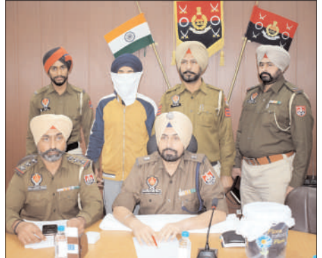
ਜਿਸ 'ਤੇ ਮੁਕੱਦਮਾ ਨੰਬਰ 246 ਮਿਤੀ 06-12-2023 ਅ/ਪ 18/61/85 ਐਨ. ਡੀ. ਪੀ.ਐੱਸ. ਐਕਟ ਬਾਣਾ ਸਿੰਘਾਂ ਵੱਲੋਂ ਦਰਜ ਰਜਿਸਟਰ ਕੀਤਾ ਗਿਆ ਹੈ ਅਤੇ ਬੰਨ੍ਹ ਦਰਿਆ ਬਾਹਿਰ ਖੁਰਦਪੁਰਾ ਪਰ ਤੁਰੰਤ ਨਾਕਾਬੰਦੀ ਕੀਤੀ ਗਈ। ਦੌਰਾਨ ਨਾਕਾਬੰਦੀ ਇੱਕ ਸਰਦਾਰ ਵਿਅਕਤੀ, ਜਿਸ ਦੇ ਮੱਥੇ ਵਿੱਚ ਕੰਗ ਹਨ ਦੀ ਕਿੱਟ (ਬੰਗ) ਪਾਈ ਹੋਈ ਸੀ, ਨੂੰ ਕਾਬੂ ਕਰਕੇ ਗ੍ਰਿਫ਼ਤਾਰ ਕੀਤਾ ਗਿਆ। ਕਿੱਟ ਦੀ ਤਲਾਸ਼ੀ ਕੀਤੀ ਗਈ ਤਾਂ 02 ਕਿੱਲੋ 700 ਗ੍ਰਾਮ ਅਫ਼ੀਮ ਬਰਾਮਦ ਹੋਈ। ਪੁਲਿਸ ਨੂੰ ਮਾਨਯੋਗ ਅਦਾਲਤ ਵਿੱਚ ਪੇਸ਼ ਕਰਕੇ ਉਸਦਾ ਪੁਲਿਸ ਰਿਮਾਂਡ ਹਾਜ਼ਲ ਕਰਕੇ ਫ਼ੂਫ਼ਾਈ ਨਾਲ ਪੁੱਛਗਿੱਛ ਕੀਤੀ ਜਾਵੇਗੀ।