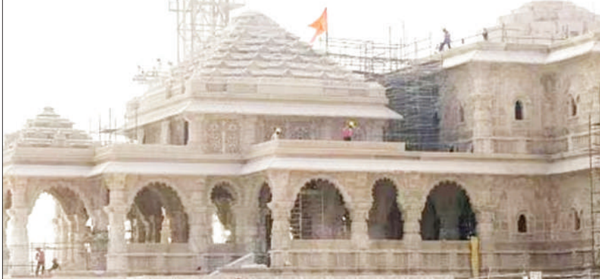
ਨਵੀਂ ਦਿੱਲੀ : ਕਾਂਗਰਸ ਨੇ ਬੁੱਧਵਾਰ ਕਿਹਾ ਕਿ ਸੋਨੀਆ ਗਾਂਧੀ, ਮਲਿਕਾਰਜੁਨ ਖੜਗੇ ਤੇ ਅਧੀਰ ਰੰਜਨ ਚੌਧਰੀ 22 ਜਨਵਰੀ ਨੂੰ ਅਯੁੱਧਿਆ ਵਿੱਚ ਰਾਮਲਲਾ ਦੇ ਪੁਰਾ ਪ੍ਰਤਿਸ਼ਠਾ ਸਮਾਰੋਹ ਵਿੱਚ ਸ਼ਾਮਲ ਨਹੀਂ ਹੋਣਗੇ। ਇੰਡੀਆ ਗੇਂਡਜੋੜ ਦੇ ਭਾਈਵਾਲਾਂ ਵੱਲੋਂ ਵੱਖ-ਵੱਖ ਬਿਆਨ ਆਉਣ ਦਰਮਿਆਨ ਕਾਂਗਰਸ ਦੇ ਸਟੈਂਡ ਬਾਰੇ ਲੰਗ ਰਹੀਆਂ ਕਿਆਸਾਵਾਦੀਆਂ ਨੂੰ ਵਿਰਾਮ ਦੇਣ ਲਈ ਪਾਰਟੀ ਨੇ ਬਿਆਨ ਜਾਰੀ ਕਰਕੇ ਇਹ ਜਾਣਕਾਰੀ ਦਿੱਤੀ ਹੈ। ਕਾਂਗਰਸ ਨੇ ਕਿਹਾ ਹੈ ਕਿ ਸਮਾਰੋਹ ਸਾਫ ਤੌਰ 'ਤੇ ਆਰ ਐੱਸ ਐੱਸ ਤੇ ਭਾਜਪਾ ਦਾ ਇਵੇਂਟ ਬਣ ਗਿਆ ਹੈ।

ਕਾਂਗਰਸ ਨੇ ਕਿਹਾ ਹੈ—ਭਗਵਾਨ ਰਾਮ ਸਾਡੇ ਦੇਸ਼ ਵਿੱਚ ਲਖੂਖ ਲੋਕਾਂ ਵੱਲੋਂ ਪੁਜੇ ਜਾਂਦੇ ਹਨ। ਧਰਮ ਨਿੱਜੀ ਮਾਮਲਾ ਹੁੰਦਾ ਹੈ, ਪਰ ਆਰ ਐੱਸ ਐੱਸ ਤੇ ਭਾਜਪਾ ਨੇ ਅਯੁੱਧਿਆ ਵਿੱਚ ਮੰਦਰ ਨੂੰ ਸਿਆਸੀ ਪੁੱਜੇਕਰ ਬਣਾ ਪਰਿਆ ਹੈ। ਚੋਣ ਲਾਹਾ ਲੈਣ ਲਈ ਭਾਜਪਾ ਤੇ ਆਰ ਐੱਸ ਐੱਸ ਅਧੂਰੇ ਮੰਦਰ ਦਾ ਅਗਾਊਂ ਉਦਘਾਟਨ ਕਰਨ ਜਾ ਰਹੇ ਹਨ। ਸੁਪਰੀਮ ਕੋਰਟ ਦੇ 2019 ਦੇ ਫੈਸਲੇ ਅਤੇ ਭਗਵਾਨ ਰਾਮ ਨੂੰ ਮੰਨਣ ਵਾਲੇ ਲਖੂਖ ਲੋਕਾਂ ਦੀਆਂ ਭਾਵਨਾਵਾਂ ਦਾ ਸਤਿਕਾਰ ਕਰਦਿਆਂ ਸ੍ਰੀ ਮਲਿਕਾਰਜੁਨ ਖੜਗੇ, ਸ਼੍ਰੀਮਤੀ ਸੋਨੀਆ ਗਾਂਧੀ ਤੇ ਸ੍ਰੀ ਅਧੀਰ ਰੰਜਨ ਨੇ ਆਰ ਐੱਸ ਐੱਸ ਤੇ ਭਾਜਪਾ ਦੇ ਇਵੇਂਟ ਦਾ ਸੱਦਾ ਸਤਿਕਾਰ ਸਹਿਤ ਨਾਮਨਜ਼ੂਰ ਕਰ ਦਿੱਤਾ ਹੈ। ਬਿਆਨ ਵਿੱਚ ਕਿਹਾ ਗਿਆ ਹੈ ਕਿ ਕਾਂਗਰਸ ਪ੍ਰਧਾਨ ਤੇ ਰਾਜ ਸਭਾ ਵਿੱਚ ਆਪੋਜੀਫ਼ਨ ਦੇ ਆਗੂ ਸ੍ਰੀ ਮਲਿਕਾਰਜੁਨ ਖੜਗੇ, ਕਾਂਗਰਸ ਸੰਸਦੀ ਦਲ ਦੀ ਚੇਅਰਪਰਸਨ ਸ਼੍ਰੀਮਤੀ ਸੋਨੀਆ ਗਾਂਧੀ ਤੇ ਲੋਕ ਸਭਾ ਵਿੱਚ ਕਾਂਗਰਸ ਪਾਰਟੀ ਦੇ ਆਗੂ ਸ੍ਰੀ ਅਧੀਰ ਰੰਜਨ ਚੌਧਰੀ ਨੂੰ ਪਿਛਲੇ ਮਹੀਨੇ ਰਾਮ ਮੰਦਰ ਦੇ ਉਦਘਾਟਨ ਵਿੱਚ ਸ਼ਾਮਲ ਹੋਣ ਦਾ ਸੱਦਾ ਮਿਲਿਆ ਸੀ। ਕੋਰਟੀ ਮੰਤਰੀ ਹਰਦੀਪ ਸਿੰਘ ਪੁਰੀ ਨੇ ਕਿਹਾ ਹੈ ਕਿ ਕਾਂਗਰਸ ਆਪਣੇ ਫੈਸਲੇ 'ਤੇ ਪਛਤਾਏਗੀ। ਭਾਜਪਾ ਆਗੂ ਨਲਿਨ ਕੋਲੀ ਨੇ ਕਿਹਾ ਕਿ ਕਾਂਗਰਸ ਦੇ ਫੈਸਲੇ ਤੋਂ ਹੋਰਨੀ ਨਹੀਂ ਹੋਈ, ਕਿਉਂਕਿ ਉਹ ਭਗਵਾਨ ਰਾਮ ਦੀ ਹੋਂਦ ਨੂੰ ਨਹੀਂ ਮੰਨਦੀ।