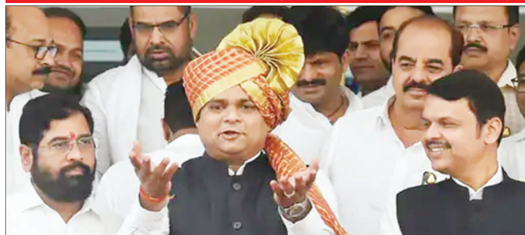
ਉਧਵ ਠਾਕਰੇ ਦੇ ਪੱਤੇ ਨੇ ਦੋਸ਼ ਲਾਇਆ ਸੀ ਕਿ ਸਪੀਕਰ ਨਾਰਵੇਕਰ ਨੇ ਬੁੱਧਵਾਰ ਸ਼ਿੰਦੇ ਨਾਲ 'ਵਰਗ' ਖੇਲਣ ਵਿੱਚ ਮੁਲਕਕਾਰ ਕੀਤੀ ਸੀ। ਦੋਸ਼ ਵਿਚਾਲੇ 18 ਅਕਤੂਬਰ 2023 ਨੂੰ ਵੀ ਮੁਲਕਕਾਰ ਹੋਈ ਸੀ। ਇਸ ਪੁਰਾਣੀ ਤਸਵੀਰ ਵਿੱਚ ਸਪੀਕਰ ਸ਼ਿੰਦੇ (ਖੱਬੇ) ਤੇ ਉਪ ਮੁੱਖ ਮੰਤਰੀ ਦਵਿੰਦਰ ਵਰਨਵੀਸ ਨਾਲ ਨਜ਼ਰ ਆ ਰਹੇ ਹਨ।

ਉਧਵ ਠਾਕਰੇ ਦੇ ਪੱਤੇ ਨੇ ਦੋਸ਼ ਲਾਇਆ ਸੀ ਕਿ ਸਪੀਕਰ ਨਾਰਵੇਕਰ ਨੇ ਬੁੱਧਵਾਰ ਸ਼ਿੰਦੇ ਨਾਲ 'ਵਰਗ' ਖੇਲਣ ਵਿੱਚ ਮੁਲਕਕਾਰ ਕੀਤੀ ਸੀ। ਦੋਸ਼ ਵਿਚਾਲੇ 18 ਅਕਤੂਬਰ 2023 ਨੂੰ ਵੀ ਮੁਲਕਕਾਰ ਹੋਈ ਸੀ। ਇਸ ਪੁਰਾਣੀ ਤਸਵੀਰ ਵਿੱਚ ਸਪੀਕਰ ਸ਼ਿੰਦੇ (ਖੱਬੇ) ਤੇ ਉਪ ਮੁੱਖ ਮੰਤਰੀ ਦਵਿੰਦਰ ਵਰਨਵੀਸ ਨਾਲ ਨਜ਼ਰ ਆ ਰਹੇ ਹਨ। ਮੁੱਖ ਮੰਤਰੀ : ਮਹਾਰਾਸ਼ਟਰ ਵਿੱਚ ਏਕਨਾਥ ਸ਼ਿੰਦੇ ਮੁੱਖ ਮੰਤਰੀ ਬਣੇ ਰਹਿਣਗੇ। ਅਸੰਬਲੀ ਦੇ ਸਪੀਕਰ ਗੁਲਾਮ ਨਾਰਵੇਕਰ ਨੇ ਬੁੱਧਵਾਰ ਸ਼ਿੰਦੇ ਸਣੇ ਉਨ੍ਹਾਂ ਦੇ ਪੱਤੇ ਦੇ 16 ਵਿਧਾਇਕਾਂ ਨੂੰ ਅਯੋਗ ਕਰਾਰ ਦੇਣ ਦੀ ਮੰਗ ਰੱਦ ਕਰ ਦਿੱਤੀ। ਸਪੀਕਰ ਨੇ ਉਧਵ ਠਾਕਰੇ ਪੱਤੇ ਦੇ 14 ਵਿਧਾਇਕਾਂ ਨੂੰ ਵੀ ਅਯੋਗ ਕਰਾਰ ਦੇਣ ਤੋਂ ਇਨਕਾਰ ਕਰ ਦਿੱਤਾ। ਸ਼ਿੰਦੇ ਪੱਤੇ ਦੇ ਚੀਫ ਵਿੱਧ ਨੂੰ ਇਨ੍ਹਾਂ ਨੂੰ ਅਯੋਗ ਕਰਾਰ ਦੇਣ ਦੀ ਮੰਗ ਕੀਤੀ ਸੀ। 1200 ਸਫਿਆਂ ਦੇ ਫੈਸਲੇ ਦੇ ਮੁੱਖ ਬਿੰਦੂਆਂ ਨੂੰ ਪ੍ਰਕਾਸ਼ਿਤ ਕਰਨ ਤੋਂ ਬਾਅਦ ਸ਼ਿੰਦੇ ਸਣੇ 16 ਵਿਧਾਇਕਾਂ ਨੂੰ ਅਯੋਗ ਕਰਾਰ ਦੇਣ ਦੀ ਮੰਗ ਰੱਦ ਕਰ ਦਿੱਤੀ। ਸਪੀਕਰ ਨੇ ਉਧਵ ਠਾਕਰੇ ਪੱਤੇ ਦੇ 14 ਵਿਧਾਇਕਾਂ ਨੂੰ ਵੀ ਅਯੋਗ ਕਰਾਰ ਦੇਣ ਤੋਂ ਇਨਕਾਰ ਕਰ ਦਿੱਤਾ।