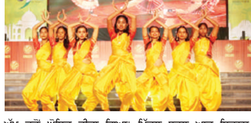
ਅੱਪ ਵਜੋਂ ਘੋਸ਼ਣਾ ਕੀਤਾ ਗਿਆ। ਮਿੱਤਲ ਸਕੂਲ ਆਫ ਬਿਜਨਸ, ਕੰਪਿਊਟਰ ਗ੍ਰਾਫਿਕਸ ਅਤੇ ਕੰਪਿਊਟਰ ਐਪਲੀਕੇਸ਼ਨ ਦੁਆਰਾ ਤਿੰਨ ਦਿਲਾਸਾ ਇਤਿਆ ਸਾਥੇ ਕੀਤੇ ਗਏ ਜੋ ਕਿ ਮੁੱਖ ਪ੍ਰਦੇਸ਼, ਆਪਣਾ ਪ੍ਰਦੇਸ਼, ਅਤੇ ਕੇਰਲ ਦੀ

ਜਲੰਧਰ (ਬੈਲੀ ਐਲਬਰਟ)-ਲਵਲੀ ਪੁੰਛਨਲ ਯੂਨੀਵਰਸਿਟੀ (ਐੱਲ ਪੀ. ਯੂ.) ਦੇ ਸਕੂਲ ਆਫ ਲਿਬਰਲ ਐਂਡ ਕ੍ਰਿਏਟਿਵ ਆਰਟਸ ਨੇ ਤਾਮਿਲਨਾਡੂ ਰਾਜ ਦੀ ਸਪੋਰਟ ਤੌਰ 'ਤੇ ਨੁਮਾਇੰਦਗੀ ਕਰਨ ਲਈ ਸਾਲਾਨਾ 12ਵੇਂ ਸੱਭਿਆਚਾਰਕ ਮੇਲੇ 'ਵਨ ਇੰਡੀਆ-2024' ਦੀ ਦੌਰਵਾਲਾ ਚੈਂਪੀਅਨਸ਼ਿਪ ਟਰਾਫੀ ਜਿੱਤ ਲਈ ਹੈ। ਜੇਤੂ ਟੀਮਾਂ ਸਮੇਤ ਪਹਿਲੇ ਅਤੇ ਦੂਜੇ ਉਪ ਜੇਤੂ ਨੇ ਵੀ ਕੁਲ ਮਿਲਾ ਕੇ 1,25,000 ਦੀ ਨਕਦ ਇਨਾਮੀ ਰਾਸ਼ੀ ਜਿੱਤੀ ਹੈ। ਕੰਪਿਊਟਰ ਗ੍ਰਾਫਿਕਸ ਅਤੇ ਇਲੈਕਟ੍ਰੀਕਲ ਅਤੇ ਆਰਕੀਟੈਕਚਰ ਅਤੇ ਡਿਜ਼ਾਈਨ ਦੇ ਸਕੂਲਾਂ ਨੂੰ ਕੁਮਵਾਰ ਸਿੱਧਮ ਅਤੇ ਪੰਜਾਬੀ ਬੰਗਾਲ ਰਾਜਾਂ ਦੀ ਨੁਮਾਇੰਦਗੀ ਕਰਨ ਲਈ ਛਾਣ ਕਰਨ ਅਤੇ ਘੋਸ਼ਣਾ ਕੀਤਾ ਗਿਆ। ਸਿੱਖਿਆ ਦੇ ਸਕੂਲ; ਖੇਤੀਬਾੜੀ; ਅਤੇ ਸੀ ਐਸ ਟੀ ਨੂੰ ਕੁਮਵਾਰ ਉੱਤਰਾਖੰਡ, ਅਸਾਮ ਅਤੇ ਉੱਤਰ ਪ੍ਰਦੇਸ਼ ਨੂੰ ਦਰਸਾਉਣ ਲਈ ਦੂਜੇ ਰਠਰ-