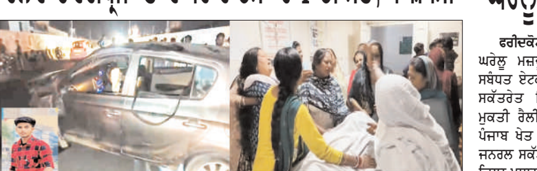
ਹਾਦਸਾਗ੍ਰਸਤ ਕਾਰ, ਮ੍ਰਿਤਕ ਦੀ ਇਨੋਕਸ 'ਚ ਫੋਟੋ ਤੇ ਵਿਰਲਪ ਕਰਦੇ ਹੋਏ ਹਿਠੇਦੇਵਾਰ।