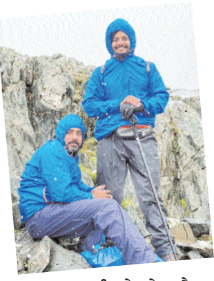
ਕਸ਼ਮੀਰ ਗੇਟ ਟਰੈਕ ਟਰੈਕਰ ਆਖਰੀ ਸਫ਼ੇ 'ਤੇ