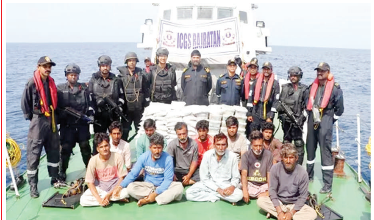
ਨਵੀਂ ਦਿੱਲੀ : ਸੂਰੱਖਿਆ ਬਲਾਂ ਨੇ ਗੁਜਰਾਤ ਦੀ ਕੋਮਾਂਤਰੀ ਜਲ ਸੀਮਾ ਨੇੜੇ ਇਕ ਕਿਸਤੀ 'ਚੋਂ 600 ਕਰੋੜ ਦੀ 86 ਕਿੱਲੋ ਡਰੱਗਜ਼ ਸਣੇ 14 ਪਾਕਿਸਤਾਨੀਆਂ ਨੂੰ ਫੜਿਆ ਹੈ। ਮਾਰਚ ਵਿਚ ਵੀ ਡਰੱਗਜ਼ ਦੇ 60 ਪੈਕਟਾਂ ਨਾਲ 6 ਪਾਕਿਸਤਾਨੀ ਫੜੇ ਗਏ ਸਨ।