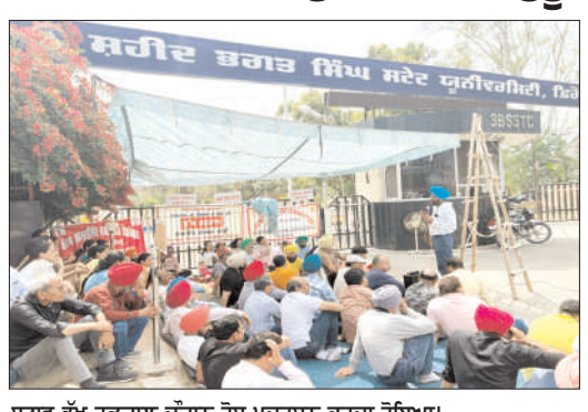
ਸਟਾਫ ਭੁੱਖ ਹੜਤਾਲ ਦੌਰਾਨ ਰੋਸ ਪ੍ਰਦਰਸ਼ਨ ਕਰਦਾ ਹੋਇਆ।