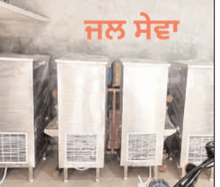
ਚੋਰਲਾ ਸਾਹਿਬ (ਮਨ ਚੱਢਾ)—ਇਤਿਹਾਸਕ ਨਗਰ ਚੋਰਲਾ ਸਾਹਿਬ ਵਿੱਚ ਬੀਤੇ ਲੰਮੇ ਸਮੇਂ ਤੋਂ ਚਾਰ ਗਾੜ੍ਹ ਤੇ ਸਬੰਧ ਵਿੱਚ ਠੰਢੇ ਪਾਣੀ ਵਾਲੀਆਂ ਕੈਂਡੀਆਂ ਵੱਖ ਵੱਖ ਰਸਤਿਆਂ ਤੇ ਲਗਾਈਆਂ ਜਾ ਰਹੀਆਂ ਹਨ ਅਤੇ ਰਸਤਿਆਂ 'ਤੇ ਰਿਵਲੈਕਟਰ ਸ਼ੀਸ਼ੇ ਲਗਾਏ ਜਾ ਰਹੇ ਹਨ ਤਾਂ ਕਿ ਰਾਹਗੀਰਾਂ ਨੂੰ ਮੁਬਕਲਾ ਦਾ ਸਾਹਮਣਾ ਨਾ ਕਰਨਾ ਪਵੇ ਅਤੇ ਗਰਮੀ ਦੇ ਮੌਸਮ ਵਿੱਚ ਠੰਢਾ ਪਾਣੀ ਪੀਣ ਲਈ ਮਿਲ ਸਕੇ। ਖਤਰਨਾਕ ਮੌਸਮਾਂ 'ਤੇ ਚਾਰ ਪਹੀਆ ਵਾਹਨ ਅਤੇ ਦੋ ਪਹੀਆ ਵਾਹਨ ਨੂੰ ਲੰਘਣ ਸਮੇਂ ਰਿਵਲੈਕਟਰ ਸ਼ੀਸ਼ੇ ਰਾਹੀਂ ਰਸਤਾ ਸਹੀ ਦਿਸ ਸਕੇ ਤਾਂ ਕਿ ਐਕਸੀਡੈਂਟ ਆਦਿ ਨਾ ਹੋ ਸਕਣ।