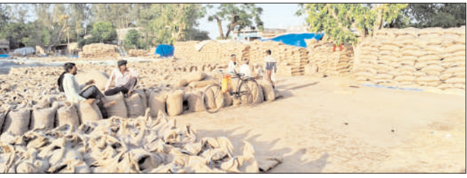
ਅਨਾਜ ਮੰਡੀ ਵਿੱਚ ਬਿਨਾਂ ਢੱਕੇ ਪਈਆਂ ਅਨਾਜ ਦੀਆਂ ਬੋਹੀਆਂ।

■ ਤਰਪਾਲਾਂ ਤੇ ਸ਼ੈੱਡ ਦਾ ਪ੍ਰਬੰਧ ਨਾ ਹੋਣ ਕਾਰਨ ਮੀਂਹ 'ਚ ਭਿਜਦੀ ਰਹੀ ਕਣਕ