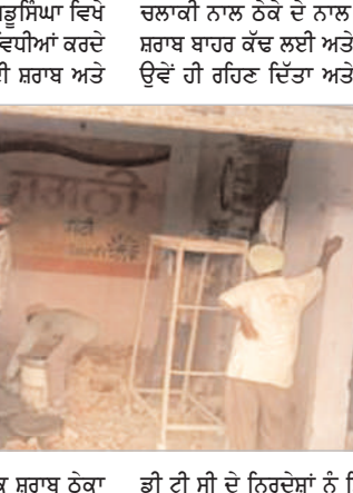
ਕਸਬਾ ਜੰਡੂਸਿਆ ਵਿਖੇ ਦੁਸ਼ਕਰ ਦੇ ਨਜ਼ਦੀਕ ਇੱਕ ਸ਼ਰਾਬ ਠੇਕਾ ਹੈ ਜਿਸ ਵਿੱਚ ਇੱਕ ਨਜ਼ਾਇਜ਼ ਗਤੀਵਿਧੀਆਂ ਚੱਲ ਰਹੀਆਂ ਸਨ। ਜਦੋਂ ਉਕਤ ਗਤੀਵਿਧੀਆਂ ਦੀ ਖਬਰ ਇਲੈਕਸ਼ਨ ਕਮਿਸ਼ਨ ਨੂੰ ਮਿਲੀ ਤਾਂ ਉਨ੍ਹਾਂ ਤੁਰੰਤ ਹੀ ਐਕਸਾਈਜ਼ ਡਿਪਾਰਟਮੈਂਟ ਨੂੰ ਨਿਰਦੇਸ਼ ਦਿੱਤੇ ਕਿ ਤੁਰੰਤ ਹੀ ਇਸ ਠੇਕੇ ਨੂੰ ਬੰਦ ਕੀਤਾ ਜਾਵੇ, ਜਿਸ ਤੋਂ ਬਾਅਦ ਐਕਸਾਈਜ਼ ਡਿਪਾਰਟਮੈਂਟ ਵੱਲੋਂ ਇਸ ਠੇਕੇ ਅਤੇ ਇਸ ਦੇ ਅੰਦਰ ਪਈ ਸ਼ਰਾਬ ਨੂੰ ਸੀਲ ਕਰ ਦਿੱਤਾ ਸੀ। ਪਰ ਜਿਉਂ ਹੀ ਲੋਕ

ਜਲੰਧਰ- ਹੁਸ਼ਿਆਰਪੁਰ ਰੋਡ 'ਤੇ ਪੈਂਦੇ ਕਸਬਾ ਜੰਡੂਸਿਆ ਵਿਖੇ ਚੋਟ ਸ਼ਾਬ ਦੇ ਦੋਹਾਨ ਸ਼ਰਾਬ ਠੇਕੇ ਨੂੰ ਨਜ਼ਾਇਜ਼ ਗਤੀਵਿਧੀਆਂ ਕਰਦੇ ਦੇਖ ਕੇ ਐਕਸਾਈਜ਼ ਡਿਪਾਰਟਮੈਂਟ ਵੱਲੋਂ ਅੰਦਰ ਪਈ ਸ਼ਰਾਬ ਅਤੇ ਠੇਕੇ ਨੂੰ ਬਾਹਰ ਤੋਂ ਸੀਲ ਕਰ ਦਿੱਤਾ ਗਿਆ ਸੀ। ਚੋਟਾਂ ਨੂੰ ਨਜ਼ਦੀਕ ਦੇਖ ਕੇ ਸ਼ਰਾਬ ਠੇਕੇਦਾਰ ਨੇ ਠੇਕੇ ਅੰਦਰੋਂ ਸ਼ਾਈਡ ਦੀ ਕੰਪ ਨੂੰ ਤੋੜ ਕੇ ਸਾਰੀ ਦੀ ਸਾਰੀ ਸ਼ਰਾਬ ਬਾਹਰ ਕੱਢ ਲਈ ਸੀ। ਜਿਸ ਤੋਂ ਬਾਅਦ ਡੀ ਟੀ ਸੀ ਵੱਲੋਂ ਸ਼ਰਾਬ ਠੇਕੇਦਾਰ ਖਿਲਾਫ ਪਰਚਾ ਕਰਨ ਦੀ ਸਿਫਾਰਿਸ਼ ਕੀਤੀ ਗਈ ਸੀ ਪਰ ਫੋਟੋ ਅਫਸਰਾਂ ਵੱਲੋਂ ਠੇਕੇਦਾਰ ਨਾਲ ਮਿਲ ਕੇ ਉਸ 'ਤੇ ਕੋਈ ਵੀ ਕਾਰਵਾਈ ਨਹੀਂ ਕੀਤੀ ਗਈ।