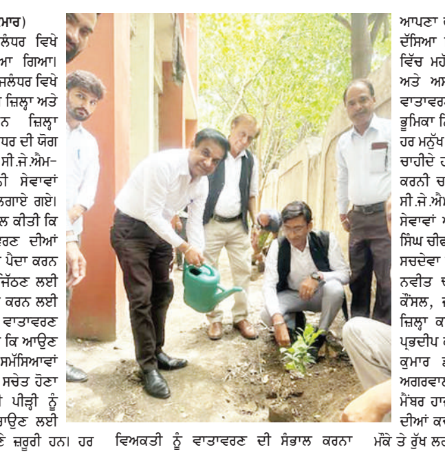
ਵਿਅਕਤੀ ਨੂੰ ਵਾਤਾਵਰਣ ਦੀ ਸੰਭਾਲ ਕਰਨਾ ਮੌਕੇ ਤੋਂ ਰੁੱਖ ਲਗਾਏ ਗਏ।

ਜਲੰਧਰ (ਸੁਰਿੰਦਰ ਕੁਮਾਰ) ਜ਼ਿਲ੍ਹਾ ਕਚਹਿਰੀਆਂ ਜਲੰਧਰ ਵਿਖੇ ਵਾਤਾਵਰਣ ਦਿਵਸ ਮਨਾਇਆ ਗਿਆ। ਇਸ ਮੌਕੇ ਜ਼ਿਲ੍ਹਾ ਕਚਹਿਰੀਆਂ ਜਲੰਧਰ ਵਿਖੇ ਸੈਨਿਕ ਸੱਜ-ਕਮ-ਚੇਅਰਮੈਨ ਜ਼ਿਲ੍ਹਾ ਕਾਨੂੰਨੀ ਸੇਵਾਵਾਂ ਅਥਾਰਟੀ ਜਲੰਧਰ ਦੀ ਯੋਗ ਰਹਿਨੁਮਾਈ ਹੇਠ ਬਗੀਚਾ ਸਿੱਖ ਸੀ.ਐੱਮ.ਐੱਮ. ਸਕੱਤਰ ਵਿਚ ਕਾਨੂੰਨੀ ਸੇਵਾਵਾਂ ਅਥਾਰਟੀ ਜਲੰਧਰ ਵੱਲੋਂ ਰੁੱਖ ਲਗਾਏ ਗਏ। ਇਸ ਮੌਕੇ ਉਨ੍ਹਾਂ ਲੋਕਾਂ ਨੂੰ ਅਪੀਲ ਕੀਤੀ ਕਿ ਵਾਤਾਵਰਣ ਦਿਵਸ, ਵਾਤਾਵਰਣ ਦੀਆਂ ਸਮੱਸਿਆਵਾਂ ਬਾਰੇ ਜਾਗਰੂਕਤਾ ਪੈਦਾ ਕਰਨ ਅਤੇ ਲੋਕਾਂ ਨੂੰ ਉਨ੍ਹਾਂ ਨਾਲ ਨਜਿੱਠਣ ਲਈ ਠੋਸ ਕਦਮ ਚੁੱਕਣ ਲਈ ਪ੍ਰੇਰਿਤ ਕਰਨ ਲਈ ਸਹਿਣ ਪ੍ਰਤੀ ਜਾਗਰੂਕ ਕਰਨਾ ਹੈ ਤਾਂ ਜੋ ਹਰੇਕ ਨਾਗਰਿਕ ਬਰਸਾਤ ਦੇ ਮੌਸਮ ਵਿਚ ਵੱਖ-ਵੱਖ ਪ੍ਰਜਾਤੀਆਂ ਦੇ ਵੱਧ ਤੋਂ ਵੱਧ ਪੌਦੇ ਲਗਾ ਕੇ ਉਨ੍ਹਾਂ ਦੀ ਦੇਖਭਾਲ ਵੀ ਕਰਨ। ਮਨੁੱਖ ਬਣਨ ਜਾ ਰਹੀਆਂ ਹਨ, ਵਾਤਾਵਰਣ ਨਾਲ ਜੁੜੀਆਂ ਸਮੱਸਿਆਵਾਂ, ਜੋ ਕਿ ਆਉਣ ਵਾਲੇ ਸਮੇਂ ਵਿੱਚ ਵੱਡੀਆਂ ਸਮੱਸਿਆਵਾਂ ਬਣਨ ਜਾ ਰਹੀਆਂ ਹਨ, ਉਨ੍ਹਾਂ ਸੰਬੰਧਤ ਚਾਹੀਦਾ ਹੈ। ਆਉਣ ਵਾਲੀ ਪੀੜ੍ਹੀ ਨੂੰ ਵੱਡੀਆਂ ਸਮੱਸਿਆਵਾਂ ਤੋਂ ਬਚਾਉਣ ਲਈ ਸਮੇਂ ਸਿਰ ਸਮਤ ਕਦਮ ਚੁੱਕਣੇ ਜ਼ਰੂਰੀ ਹਨ। ਹਰ