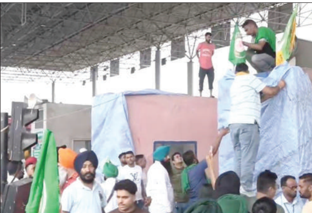
ਕਿਸਾਨਾਂ ਦੀ ਤਾਲਾਬੰਦੀ ਨੂੰ ਰੋਕਣ ਲਈ ਟੋਲ ਪਲਾਜ਼ਾ 'ਤੇ ਭਾਰੀ ਗਿਣਤੀ 'ਚ ਪੁਲਿਸ ਮੌਜੂਦ ਸੀ, ਪਰ ਕਿਸਾਨ ਲਾਡੋਵਾਲ ਟੋਲ ਪਲਾਜ਼ਾ ਨੂੰ ਬੰਦ ਕਰਕੇ ਹੀ ਰਹੇ। ਭਾਰਤੀ ਕਿਸਾਨ-ਮਜ਼ਦੂਰ ਯੂਨੀਅਨ ਦੇ ਪ੍ਰਧਾਨ ਨੇ ਦੱਸਿਆ ਕਿ ਇਸ ਟੋਲ ਦੇ ਹਟਾਏ ਜਾਣ 'ਤੇ ਵੱਧ ਹਨ। ਇਸ ਤੋਂ ਪਹਿਲਾਂ ਪੰਜਾਬ ਸੌਪਿਆ, ਜਿਸ 'ਚ 6 ਮੁੱਖ ਮੋਰਚੇ ਰੱਖੀਆਂ ਹਨ। ਕਿਸਾਨਾਂ ਨੇ ਟੋਲ ਪਲਾਜ਼ੇ 'ਤੇ ਪੱਲੀਆਂ ਪਾ ਕੇ ਰੱਸੀਆਂ ਬੰਨ੍ਹ ਦਿੱਤੀਆਂ ਹਨ।

ਜਲੰਧਰ : ਕਿਸਾਨਾਂ ਨੇ ਆਪਣੇ ਮੋਰਚੇ ਦੇ ਸ਼ੁਰੂ ਵਿੱਚ ਐਤਵਾਰ ਵਿਲੱਖਣ ਕੋਲ ਲਾਡੋਵਾਲ ਦੇ ਪੰਜਾਬ ਦੇ ਸਭ ਤੋਂ ਮਹਿੰਗੇ ਟੋਲ ਪਲਾਜ਼ਾ ਨੂੰ ਪੱਕੇ ਤੌਰ 'ਤੇ ਬੰਦ ਕਰ ਦਿੱਤਾ। ਕਿਸਾਨਾਂ ਨੇ ਇਸ ਦੇ ਨਾਲ ਹੀ ਨੈਸ਼ਨਲ ਹਾਈਵੇ ਅਥਾਰਿਟੀ ਆਫ ਇੰਡੀਆ ਦੇ ਨਾਅਰੇ ਵੀ ਸੁਣਾਏ। ਇਸ ਤੋਂ ਪਹਿਲਾਂ ਪੰਜਾਬ ਸੌਪਿਆ, ਜਿਸ 'ਚ 6 ਮੁੱਖ ਮੋਰਚੇ ਰੱਖੀਆਂ ਹਨ। ਕਿਸਾਨਾਂ ਨੇ ਟੋਲ ਪਲਾਜ਼ੇ 'ਤੇ ਪੱਲੀਆਂ ਪਾ ਕੇ ਰੱਸੀਆਂ ਬੰਨ੍ਹ ਦਿੱਤੀਆਂ ਹਨ।