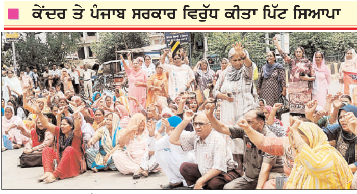
ਆਪਣੀਆਂ ਹੱਕੀ ਮੰਗਾਂ ਨੂੰ ਲੈ ਕੇ ਰੋਸ ਪ੍ਰਦਰਸ਼ਨ ਕਰਦੀਆਂ ਮਿੱਡ ਡੇ ਮੀਲ ਕੁੱਕ ਬੀਬੀਆਂ।