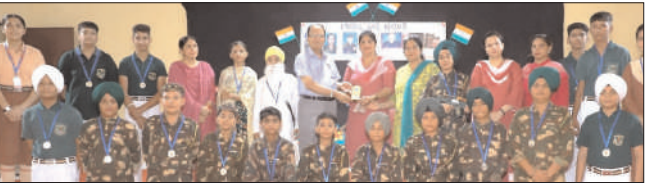
ਬੱਚੇ ਦੇ ਨਾਇਕਾਂ 'ਤੇ ਭਾਸ਼ਣ, ਕਵਿਤਾਵਾਂ ਅਤੇ ਦੇਸ਼ ਭਗਤੀ ਦੇ ਚਿੱਤਰ

ਜਲੰਧਰ (ਇਕਬਾਲ ਸਿੰਘ ਉਭੀ)-ਸੇਂਟ ਸੋਲਜਰ ਗਰੁੱਪ ਆਫ ਇਸਟੀਚਿਊਸ਼ਨਜ਼ ਦੀਆਂ ਵੱਖ-ਵੱਖ ਸਕੂਲ ਸਾਖਾਵਾਂ ਵੱਲੋਂ ਸਕੂਲ ਡਾਇਰੈਕਟਰਾਂ ਅਤੇ ਪਿੰਡੀਪਾਲਾਂ ਦੀ ਅਗਵਾਈ ਹੇਠ ਕਾਰਗਿਲ ਵਿਜੇ ਦਿਵਸ ਮਨਾਇਆ ਗਿਆ। ਇਹ ਦਿਨ ਲੰਦਾਪ ਦੇ ਉੱਤਰੀ ਕਾਰਗਿਲ ਜ਼ਿਲ੍ਹੇ ਦੀਆਂ ਪਹਾੜੀ ਢੇਰੀਆਂ 'ਤੇ ਪਾਕਿਸਤਾਨੀ ਫੌਜਾਂ ਨੂੰ ਉਨ੍ਹਾਂ ਦੇ ਕਬਜ਼ੇ ਵਾਲੇ ਸਥਾਨਾਂ ਤੋਂ ਬਾਹਰ ਕੱਢਣ ਲਈ 1999 ਵਿੱਚ ਕਾਰਗਿਲ ਯੁੱਧ ਵਿੱਚ ਪਾਕਿਸਤਾਨ ਉੱਤੇ ਭਾਰਤ ਦੀ ਜਿੱਤ ਦੀ ਯਾਦ ਕਰਵਾਉਣ ਦੇ ਉੱਤਰ ਪ੍ਰਦੇਸ਼ ਵਿੱਚ ਸਕੂਲ ਦੀਆਂ ਵੱਖ-ਵੱਖ ਸਮਾਜਾਂ ਦੇ ਵਿਦਿਆਰਥੀਆਂ ਨੇ ਚੋਰ ਉਤਸਾਹ ਨਾਲ ਭਾਗ ਲਿਆ, ਉਨ੍ਹਾਂ ਨੇ ਬੱਚੇ ਦੇ ਨਾਇਕਾਂ 'ਤੇ ਭਾਸ਼ਣ, ਕਵਿਤਾਵਾਂ ਅਤੇ ਦੇਸ਼ ਭਗਤੀ ਦੇ ਚਿੱਤਰ