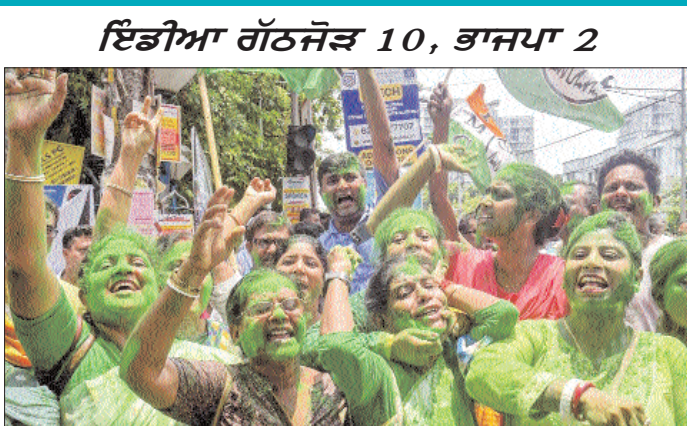
ਇੰਡੀਆ ਗਠਜੋੜ 10, ਭਾਜਪਾ 2

ਨਵੀਂ ਦਿੱਲੀ : ਲੋਕ ਸਭਾ ਚੋਣਾਂ ਤੋਂ ਬਾਅਦ 7 ਸੂਬਿਆਂ ਦੀਆਂ 13 ਵਿਧਾਨ ਸਭਾ ਸੀਟਾਂ 'ਤੇ ਹੋਈ ਉਪ ਚੋਣ ਦੇ ਸਾਹਮਣੇ ਆਏ ਨਤੀਜਿਆਂ 'ਚ ‘ਇੰਡੀਆ’ ਗਠਜੋੜ ਨੇ ਧਮਾਕੇਦਾਰ ਪ੍ਰਦਰਸ਼ਨ ਕੀਤਾ, ਜਦਕਿ ਭਾਜਪਾ ਨੂੰ ਭਾਰੀ ਨੁਕਸਾਨ ਹੋਇਆ। 13 'ਚੋਂ 10 ਸੀਟਾਂ ‘ਇੰਡੀਆ’ ਗਠਜੋੜ ਦੇ ਖਾਤੇ 'ਚ ਗਈਆਂ। ਕਾਂਗਰਸ ਨੇ 4, ਟੀ ਐੱਮ ਸੀ ਨੇ 4, ਭਾਜਪਾ ਨੇ 2, ਆਪ, ਡੀ ਐੱਮ ਕੇ ਅਤੇ ਆਜ਼ਾਦ ਨੇ 1-1 ਸੀਟ ਜਿੱਤੀ। ਉਪ ਚੋਣ 'ਚ ਕਾਂਗਰਸ ਨੇ ਪਹਾੜੀ ਸੂਬੇ ਉਤਰਾਖੰਡ ਅਤੇ ਹਿਮਾਚਲ 'ਚ ਕਮਾਲ ਦਾ ਪ੍ਰਦਰਸ਼ਨ ਕੀਤਾ, ਉਥੇ ਹੀ ਮਮਤਾ ਦੀ ਪਾਰਟੀ ਨੇ ਬੰਗਾਲ 'ਚ ਕਲੀਨ ਸਵੈਧੀ ਕੀਤਾ, ਜਦਕਿ ਭਾਜਪਾ ਨੇ ਮੱਧ ਪ੍ਰਦੇਸ਼ ਅਤੇ ਹਿਮਾਚਲ 'ਚ ਇੱਕ ਇੱਕ ਸੀਟ ਜਿੱਤੀ। ਉਪ ਚੋਣ 'ਚ ਆਮ ਆਦਮੀ ਪਾਰਟੀ ਦੇ ਖਾਤੇ 'ਚ ਆਈ ਹੈ। ‘ਇੰਡੀਆ’ ਗਠਜੋੜ ਜਿਮਨੀ ਚੋਣਾਂ ਲਈ ਪਈਆਂ ਵੋਟਾਂ ਦੀ ਗਿਣਤੀ ਦੌਰਾਨ ਪੰਜਾਬ ਦੀ ਜਲੰਧਰ ਪੱਛਮੀ, ਹਿਮਾਚਲ ਪ੍ਰਦੇਸ਼ ਦੀਆਂ ਦੋਹਰਾ ਤੇ ਨਾਲਾਗੜ੍ਹ ਅਤੇ ਟੀ ਐੱਮ ਸੀ ਪੱਛਮੀ ਬੰਗਾਲ ਦੀਆਂ ਰਾਏਗੰਜ, ਰਾਨਾਘਟ ਦੱਖਣੀ ਅਤੇ ਬਾਗਦਾ ਵਿਧਾਨ ਸਭਾ ਸੀਟਾਂ ਜਿੱਤਣ 'ਚ ਸਫਲ ਰਿਹਾ। ਤਾਮਿਲਨਾਡੂ 'ਚ ਡੀ ਐੱਮ ਕੇ ਨੇ ਵਿਕਰਵਾਂਡੀ ਸੀਟ 'ਤੇ ਜਿੱਤ ਦਰਜ ਕੀਤੀ। ਉਤਰਾਖੰਡ 'ਚ ਕਾਂਗਰਸ ਨੇ