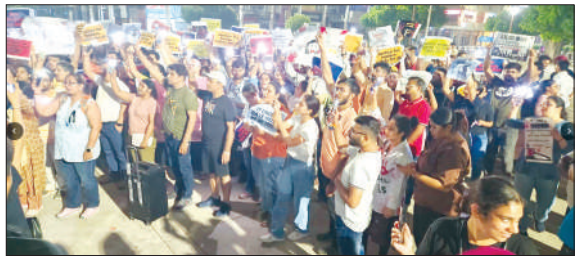
ਸਿਸਟਮ ਦੇ ਨੇੜਿੰਗਾਂ 'ਚੋਂ ਇਨਸਾਫ਼ ਭਾਲਦੇ ਪੀ ਜੀ ਆਈ ਚੰਡੀਗੜ੍ਹ ਦੇ ਡਾਕਟਰਾਂ ਵੱਲੋਂ ਕਰਕੜਾਂ ਦੇ ਸਰਕਾਰੀ ਮੈਡੀਕਲ ਕਾਲਜ ਦੀ ਮਿਲਾ ਡਾਕਟਰਾਂ ਦੇ ਗੋਤਾ ਦੇ ਵਿੱਚੋਂ ਵੱਜੋਂ ਤੇ ਇਨਸਾਫ਼ ਲਈ ਪੀ ਜੀ ਆਈ ਚੰਡੀਗੜ੍ਹ ਤੋਂ ਸੈਕਟਰ 17 ਨੂੰ ਕੋਲਡ ਮਾਰਚ ਕੀਤਾ ਗਿਆ।