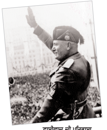
ਫ਼ਾਈਵਾਦ ਦੀ ਪਰਿਭਾਸ਼ਾ ਆਖਰੀ ਸਫ਼ੇ 'ਤੇ