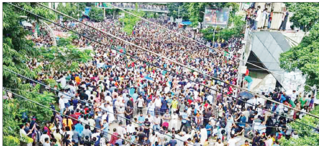
ਹਸੀਨਾ ਦੇ ਭੱਜਣ ਤੋਂ ਬਾਅਦ ਸੈਂਕੜੇ ਲੋਕ ਉਸ ਦੀ ਰਿਹਾਇਸ਼ ਵਿਚ ਵੜ ਗਏ। ਉਹ ਕੁੱਕੜ, ਮੰਡੀ, ਸਬਜ਼ੀਆਂ, ਸਾੜੀਆਂ, ਭਾਂਡੇ ਤੇ ਫਰਨੀਚਰ ਚੁੱਕ ਕੇ ਲਿਜਾਂਦੇ ਨਜ਼ਰ ਆਏ।

ਦੇਸ਼ ਦੀ ਵਾਗਡੋਰ ਸੰਭਾਲਣ ਤੋਂ ਬਾਅਦ ਸੈਨਾ ਮੁਖੀ ਜਨਰਲ ਵਕਾਰ-ਉਜ਼-ਜ਼ਮਾ ਨੇ ਐਲਾਨ ਕੀਤਾ—ਮੈਂ (ਦੇਸ਼ ਦੀ) ਸਾਰੀ ਜ਼ਿੰਮੇਵਾਰੀ ਲੈ ਰਿਹਾ ਹਾਂ, ਕਿਰਪਾ ਕਰਕੇ ਸਹਿਯੋਗ ਕਰੋ। ਹਸੀਨਾ ਨੇ ਦੇਸ਼ ਛੱਡ ਦਿੱਤਾ ਹੈ। ਅੰਤਰਰਾਸ਼ਟਰੀ ਬਣਾਈ ਜਾਵੇਗੀ। ਮੈਂ ਸਿਆਸੀ ਨੇਤਾਵਾਂ ਨੂੰ ਮਿਲਿਆਂ ਹਾਂ ਅਤੇ ਉਨ੍ਹਾਂ ਨੂੰ ਦੇਸ਼ ਦਿੱਤਾ ਹੈ ਕਿ ਸੈਨਾ