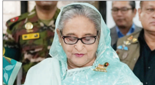
ਇੰਗਲੈਂਡ ਜਾਣ ਵਾਲੀ ਹਸੀਨਾ ਬੰਗਲਾਦੇਸ਼ ਦੇ ਹਿੰਦੁਸਤਾਨੀ ਔਡ 'ਚੋਂ ਉਡੰਤਰੀ।

ਢਾਕਾ : ਬੰਗਲਾਦੇਸ਼ ਦੀ ਪ੍ਰਧਾਨ ਮੰਤਰੀ ਹਸੀਨਾ ਵਜ਼ਿਰ ਸਰਕਾਰ ਦੇ ਖਿਲਾਫ ਜਾਰੀ ਪ੍ਰਦਰਸ਼ਨਾਂ ਦੇ ਮੱਦੇਨਜ਼ਰ ਸੋਮਵਾਰ ਅਸਤੀਫਾ ਦੇ ਕੇ ਦੇਸ਼ ਛੱਡ ਗਈ। ਵਿਵਾਦਤ ਕੋਟਾ ਵਿਵਸਥਾ ਨੂੰ ਲੈ ਕੇ ਹੋ ਰਹੇ ਪ੍ਰਦਰਸ਼ਨਾਂ ਤੋਂ ਬਾਅਦ ਸ਼ੇਖ ਹਸੀਨਾ ਨੂੰ ਅਸਤੀਫਾ ਦੇਣ ਲਈ ਮਜਬੂਰ ਹੋਣਾ ਪਿਆ।