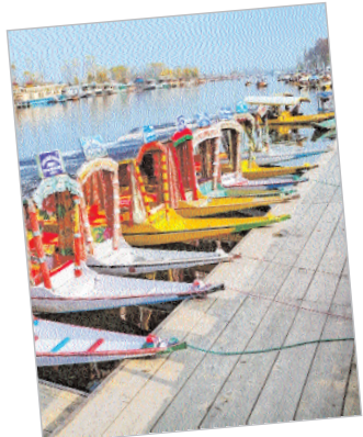
ਕਲਮੀਰ ਫੋਰੀ ਆਖਰੀ ਸਫੇ 'ਤੇ