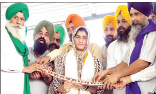
ਨਵੀਂ ਦਿੱਲੀ : ਸ਼ੁੱਠ ਬਾਰਡਰ 'ਤੇ ਲੰਮੇ ਸਮੇਂ ਤੋਂ ਚੱਲ ਰਹੇ ਕਿਸਾਨ ਅੰਦੋਲਨ ਨੂੰ ਸ਼ਨੀਵਾਰ 200 ਦਿਨ ਹੋ ਗਏ। ਇਸ ਮੌਕੇ ਕਿਸਾਨਾਂ ਨੇ ਵੱਡੇ ਪੱਧਰ 'ਤੇ ਪ੍ਰਦਰਸ਼ਨ ਕੀਤਾ। ਇਸ ਦੌਰਾਨ ਸ਼ਨੀਵਾਰ ਨੂੰ ਉਲੰਪੀਅਨ ਭਲਵਾਨ ਵਿਨੋਬ ਫੋਗਟ ਵੀ ਸ਼ੁੱਠ ਬਾਰਡਰ ਪਹੁੰਚੇ। ਕਿਸਾਨਾਂ ਨੇ ਵੱਡੇ ਪੱਧਰ 'ਤੇ ਵਿਨੋਬ ਫੋਗਟ ਦਾ ਫੁੱਲਾਂ ਦੇ ਹਾਰ ਪਾ ਕੇ ਸਵਾਗਤ ਕੀਤਾ। ਵਿਨੋਬ ਫੋਗਟ ਨੇ ਕਿਸਾਨਾਂ ਪ੍ਰਤੀ ਆਪਣਾ ਸਮਰਥਨ ਪ੍ਰਗਟ ਕਰਦੇ ਹੋਏ ਕਿਹਾ ਕਿ ਕਿਸਾਨ ਆਪਣੇ ਅਧਿਕਾਰਾਂ ਲਈ ਲੜਨਾ ਪੈਣਾ ਹੈ।

ਨਵੀਂ ਦਿੱਲੀ : ਸ਼ੁੱਠ ਬਾਰਡਰ 'ਤੇ ਲੰਮੇ ਸਮੇਂ ਤੋਂ ਚੱਲ ਰਹੇ ਕਿਸਾਨ ਅੰਦੋਲਨ ਨੂੰ ਸ਼ਨੀਵਾਰ 200 ਦਿਨ ਹੋ ਗਏ। ਇਸ ਮੌਕੇ ਕਿਸਾਨਾਂ ਨੇ ਵੱਡੇ ਪੱਧਰ 'ਤੇ ਪ੍ਰਦਰਸ਼ਨ ਕੀਤਾ। ਇਸ ਦੌਰਾਨ ਸ਼ਨੀਵਾਰ ਨੂੰ ਉਲੰਪੀਅਨ ਭਲਵਾਨ ਵਿਨੋਬ ਫੋਗਟ ਵੀ ਸ਼ੁੱਠ ਬਾਰਡਰ ਪਹੁੰਚੇ। ਕਿਸਾਨਾਂ ਨੇ ਵੱਡੇ ਪੱਧਰ 'ਤੇ ਵਿਨੋਬ ਫੋਗਟ ਦਾ ਫੁੱਲਾਂ ਦੇ ਹਾਰ ਪਾ ਕੇ ਸਵਾਗਤ ਕੀਤਾ। ਵਿਨੋਬ ਫੋਗਟ ਨੇ ਕਿਸਾਨਾਂ ਪ੍ਰਤੀ ਆਪਣਾ ਸਮਰਥਨ ਪ੍ਰਗਟ ਕਰਦੇ ਹੋਏ ਕਿਹਾ ਕਿ ਕਿਸਾਨ ਆਪਣੇ ਅਧਿਕਾਰਾਂ ਲਈ ਲੜਨਾ ਪੈਣਾ ਹੈ। ਕਿਸਾਨਾਂ ਦਾ ਜਜ਼ਬਾ ਕਦੀ ਕਮਜ਼ੋਰ ਨਹੀਂ ਹੋਇਆ। ਉਨ੍ਹਾਂ ਕਿਹਾ—ਮੈਂ ਮਾਣ ਹੈ ਕਿ ਇੱਕ ਕਿਸਾਨ ਪਰਵਾਰ 'ਚ ਮੇਰਾ ਜਨਮ ਹੋਇਆ ਹੈ। ਮੈਂ ਅੰਦੋਲਨਕਾਰੀ ਕਿਸਾਨਾਂ ਨੂੰ ਕਹਿਣਾ ਚਾਹੁੰਦੀ ਹਾਂ ਕਿ ਤੁਹਾਡੀ ਬੇਟੀ ਤੁਹਾਡੇ ਨਾਲ ਹੈ। ਮੈਂ ਤੁਹਾਡੀ ਬੇਟੀ ਤੁਹਾਡੇ ਨਾਲ ਖੜੀ ਹਾਂ। ਮੈਂ ਤੁਹਾਡੀ ਬੇਟੀ ਤੁਹਾਡੇ ਨਾਲ ਖੜੀ ਹਾਂ ਕਿ ਤੁਹਾਡੀ ਬੇਟੀ ਤੁਹਾਡੇ ਨਾਲ ਖੜੀ ਹੈ। ਮੈਂ ਤੁਹਾਡੀ ਬੇਟੀ ਤੁਹਾਡੇ ਨਾਲ ਖੜੀ ਹਾਂ ਕਿ ਤੁਹਾਡੀ ਬੇਟੀ ਤੁਹਾਡੇ ਨਾਲ ਖੜੀ ਹੈ। ਮੈਂ ਤੁਹਾਡੀ ਬੇਟੀ ਤੁਹਾਡੇ ਨਾਲ ਖੜੀ ਹੈ। ਮੈਂ ਤੁਹਾਡੀ ਬੇਟੀ ਤੁਹਾਡੇ ਨਾਲ ਖੜੀ ਹੈ।