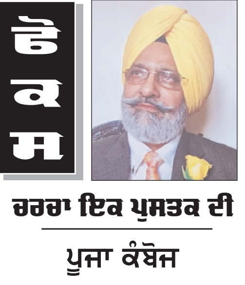
ਚਰਚਾ ਇਕ ਪੁਸਤਕ ਦੀ ਪੂਜਾ ਕੰਬੋਜ