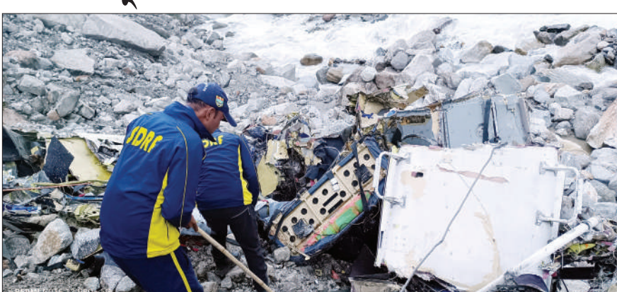
ਦੇਹਰਾਦੂਨ : ਕੇਦਾਰਨਾਥ ਧਾਮ 'ਚ ਗੰਧਰ ਦੇ ਨਜ਼ਦੀਕ ਭੀਮਬਲੀ ਦੇ ਕੋਲ ਇੱਕ ਹੈਲੀਕਾਪਟਰ ਡਿੱਗ ਪਿਆ। ਕਿਸਟਲ ਕੰਪਨੀ ਦਾ ਇੱਕ ਹੈਲੀਕਾਪਟਰ ਖਰਾਬ ਹੋ ਗਿਆ ਸੀ। ਇਸ ਨੂੰ ਠੀਕ ਕਰਨ ਲਈ ਐੱਮ ਆਈ-17 ਹੈਲੀਕਾਪਟਰ ਨਾਲ ਇਸ ਨੂੰ ਲਿਫਟ ਕੀਤਾ ਜਾ ਰਿਹਾ ਸੀ, ਪਰ ਉਸੇ ਸਮੇਂ ਇਸ ਦੇ ਤਾਰ ਟੁੱਟਣ ਕਾਰਨ ਕਿਸਟਲ ਹੈਲੀਕਾਪਟਰ ਮੌਜੂਦਗੀ ਨਹੀਂ 'ਚ ਡਿੱਗ ਗਿਆ। ਹਾਦਸੇ 'ਚ ਕਿਸੇ ਤਰ੍ਹਾਂ ਦੇ ਜਾਨ-ਮਾਲ ਦਾ ਨੁਕਸਾਨ ਨਹੀਂ ਹੋਇਆ। ਦੱਸਿਆ ਜਾ ਰਿਹਾ ਹੈ ਕਿ ਇਸ ਖਰਾਬ ਹੈਲੀਕਾਪਟਰ ਦੇ ਜ਼ਰੂਰੀ ਪਾਰਟ ਪਹਿਲਾਂ ਹੀ ਕੱਢ ਲਏ ਗਏ ਸਨ। ਇਸ ਖ਼ਬਾਰ ਹੈਲੀਕਾਪਟਰ ਨੂੰ ਠੀਕ ਕਰਨ ਲਈ ਹਵਾਈ ਫੌਜ ਦੇ ਐੱਮ

ਬ੍ਰਾਜ਼ੀਲ ਸੁਪਰੀਮ ਕੋਰਟ ਨੇ 'ਐੱਕਸ' 'ਤੇ ਲਾਈ ਪਾਬੰਦੀ