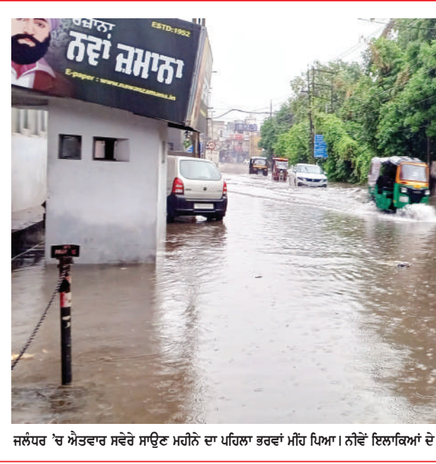
ਜਲੰਧਰ 'ਚ ਐਤਵਾਰ ਸਵੇਰੇ ਸਾਉਣ ਮਹੀਨੇ ਦਾ ਪਹਿਲਾ ਭਰਵਾਂ ਮੀਂਹ ਪਿਆ। ਨੀਵੇਂ ਇਲਾਕਿਆਂ ਦੇ ਘਰਾਂ 'ਚ ਪਾਣੀ ਵਢ ਗਿਆ।