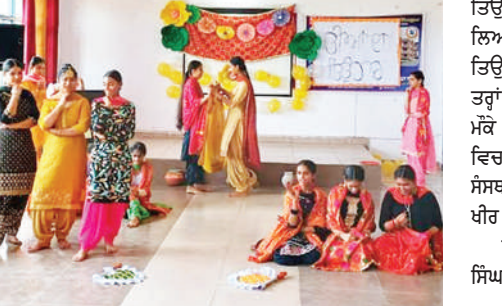
ਸਨੌਰਾ ਸਕੂਲ ਵਿਖੇ ਤੀਜਾ ਦਾ ਤਿਉਹਾਰ ਬੜੇ ਉਤਸ਼ਾਹ ਅਤੇ ਪ੍ਰਾਯਾਸ ਨਾਲ ਮਨਾਇਆ ਗਿਆ। ਸਕੂਲ ਨੂੰ ਰੰਗ-ਬਿਰੰਗੀ ਸਜਾਵਟ ਨਾਲ ਸਜਾਇਆ ਗਿਆ ਸੀ।

ਭੋਗਪੁਰ (ਕੁਲਵਿੰਦਰ ਸਿੰਘ ਕਾਰਲੋ)-ਸ੍ਰੀ ਗੁਰੂ ਤੇਗ ਬਹਾਦਰ ਪਬਲਿਕ ਸਕੂਲ ਸਨੌਰਾ ਵਿਖੇ ਤੀਜਾ ਦਾ ਤਿਉਹਾਰ ਬੜੇ ਉਤਸ਼ਾਹ ਅਤੇ ਪ੍ਰਾਯਾਸ ਨਾਲ ਮਨਾਇਆ ਗਿਆ। ਸਕੂਲ ਨੂੰ ਰੰਗ-ਬਿਰੰਗੀ ਸਜਾਵਟ ਨਾਲ ਸਜਾਇਆ ਗਿਆ ਸੀ। ਸਾਰਿਆਂ ਨੇ ਇਸ ਤਿਉਹਾਰ ਦਾ ਭਰਪੂਰ ਆਨੰਦ ਮਾਣਿਆ। ਸਾਡੇ ਮਹਿਮਾਨ ਅਤੇ ਸਟਾਫ ਨੇ ਰਵਾਇਤੀ, ਰੰਗੀਨ ਪਹਿਰਾਵੇ ਪਾ ਕੇ ਉਸਨੂੰ ਤਿਉਹਾਰ ਦੀ ਭਾਵਨਾ ਨਾਲ ਜੋੜਿਆ। ਵਿਦਿਆਰਥੀਆਂ ਵੱਲੋਂ ਪੇਸ਼ ਕੀਤੇ ਜੰਗਲਦਾਰ ਨਾਚਾਂ ਨੇ ਤੀਜਾ ਦੇ ਤਿਉਹਾਰ ਦੇ ਮੌਕੇ ਹੋਰ ਵੀ ਆਨੰਦ ਦਾ ਇੱਕ ਮਾਹੌਲ ਬਣਾ ਦਿੱਤਾ। ਮਜ਼ੇਦਾਰ ਖੇਡਾਂ ਦਾ ਆਯੋਜਨ ਕੀਤਾ ਗਿਆ ਸੀ ਅਤੇ ਹਰ ਕਿਸੇ ਨੇ ਵੱਖ-ਵੱਖ ਤਰ੍ਹਾਂ ਦੇ ਖਾਣਿਆਂ ਦਾ ਆਨੰਦ ਲਿਆ। ਇੱਕ ਵਿਸ਼ੇਸ਼ ਮਹਿੰਦੀ ਦਾ ਸਟਾਲ ਵੀ ਲਗਾਇਆ ਗਿਆ ਸੀ।